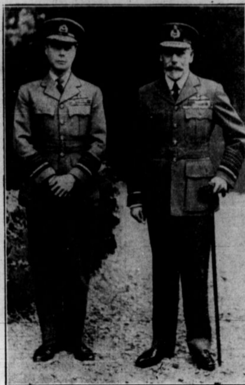
Angleški kralj George V., star 70 let, je dne 21. januarja umrl. Kraljevska služba je imel nekaj nad 25 let. Nasledil ga je njegov sin Edward, ki je osmi angleški kralj tega imena. Star je 41 let in samski.