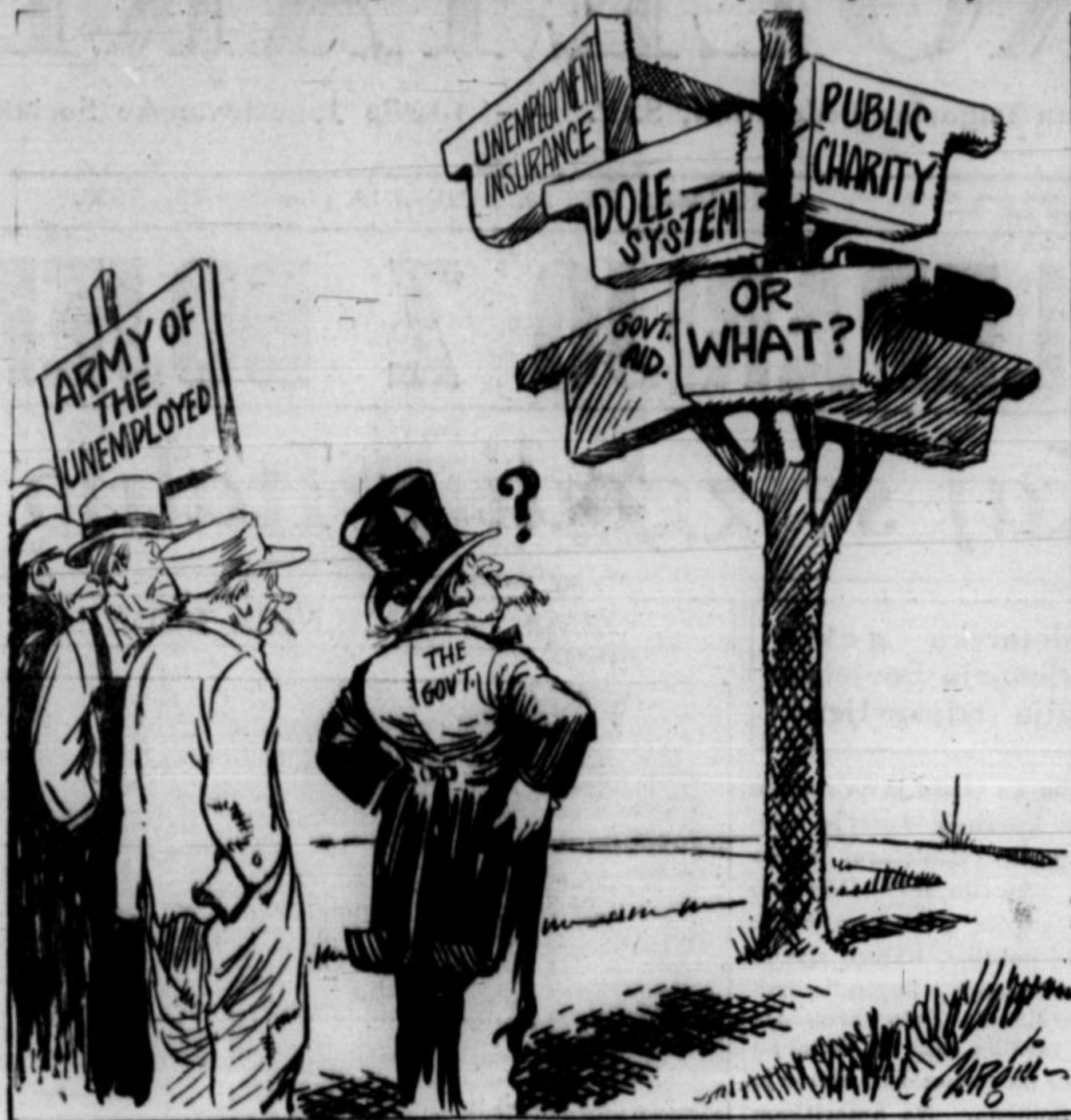
Gornji kartun je bil narisan v jeseni l. 1931. V Proletarcu je bil prvič priobčen 17. septembra imenovanega leta. Predstavlja ameriško vlado, ki na razpustih premišljuje, ob množici nezaposlenih, kam se obrniti.

Dinastija v Angliji je ustanova, ki je cementirala njen imperializem. V vladnih poslih ne odločuje. Kraljeve govore napiše premier, pa naj bo to Stanley Baldwin ali Ramsay MacDonald. Veljavo pa si je kralj ohranil kljub temu in je še vedno deležen spoštovanja ljudskih množic. Popularnost in trdnost v sedanji dobi si je pridobil zato, ker se je znal asimilirati demokraciji v Angliji in v njenih dominjonih.