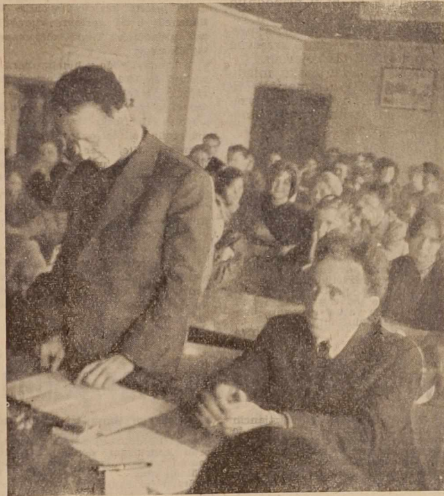
S konference ZMS v Ljutomeru

Mnogim čestitkam ob dnevu JLA se pridružuje tudi uredništvo našega lista.