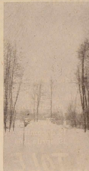
Sneg, sneg,

škem sporu, o odnosih med SFRJ in Avstrijo in Zvezno republiko Nemčijo, o kmetijskih problemih v SZ, o naši zunanji trgovini in o zaposlovanju naših ljudi v inozemstvu je bila zadovoljiva. V teh dneh bodo takšna predavanja še v preostalih 14-tih centrih krajevnih organizacij SZDL v soboški občini.