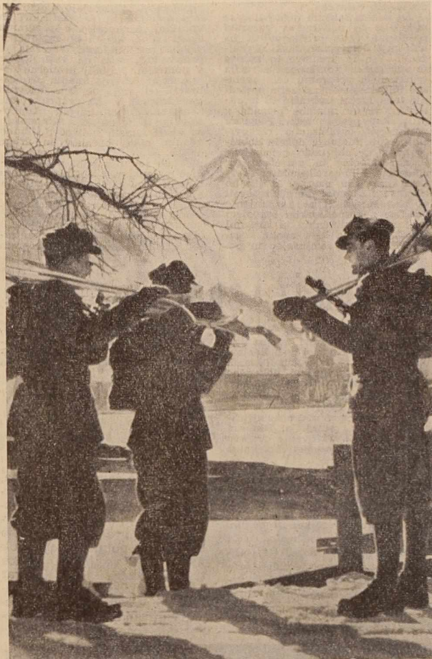
Vojaki JLA - smučarji

Sedanje stanje cestnega omrežja v Pomurju je seveda izredno slabo in zato postaja nujno, da se cestna mreža modernizira. Ta nujnost pa je še toliko večja, ker se je promet s tovornimi avtomobili pa tudi osebnimi tako povečal, da je obremenjenost večine cest v soboški občini nad republiškim in zveznim povprečjem. Kljub tolikšnemu razvoju pa je Prekmurje še danes povezano z ostalo Slovenijo z enim trdnim mostom preko Mure in to pri Slatina Radencih. Za vedno večji gospodarski razvoj, zlasti pa še za razvoj kmetijske