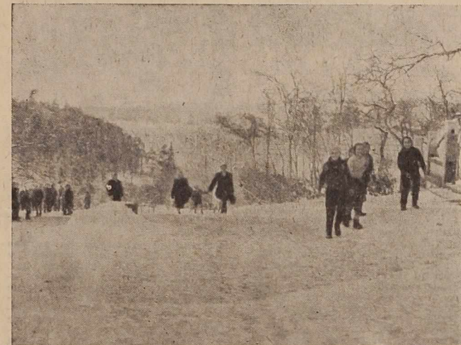
Tako se veselijo snega šolarji v Bodoncih