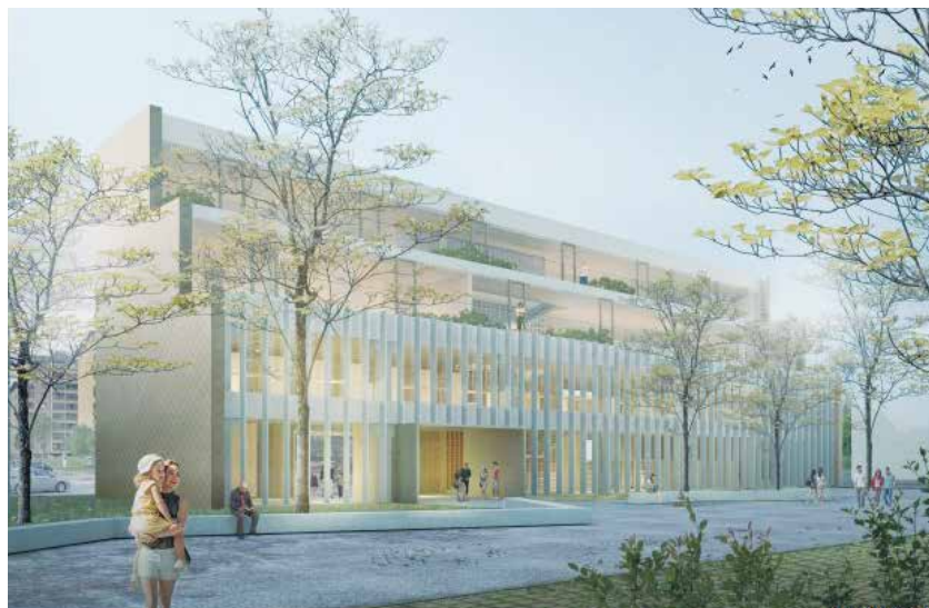
Zunanji videz nove knjižnice iz idejne zasnove

Hotel je bil odprt leta 1980, ima 2602 kvadratna metra skupnih površin in je skozi desetletja doživel kar nekaj prenov in posodobitev, ki pa so po besedah Matic Lasiča slabšale njegovo vrednost. Objekt je delno podkleten, nosilna konstrukcija je armiranobetonska z opečnatimi predelnimi stenami. Zgrajen je bil zelo kakovostno in je konstrukcijsko dobro zasnovan. To arhitekturo, ki je odraz časa, želijo ohraniti in poudariti tudi pri prenovi, seveda z novo vsebino, barvni poudarki pa naj bi