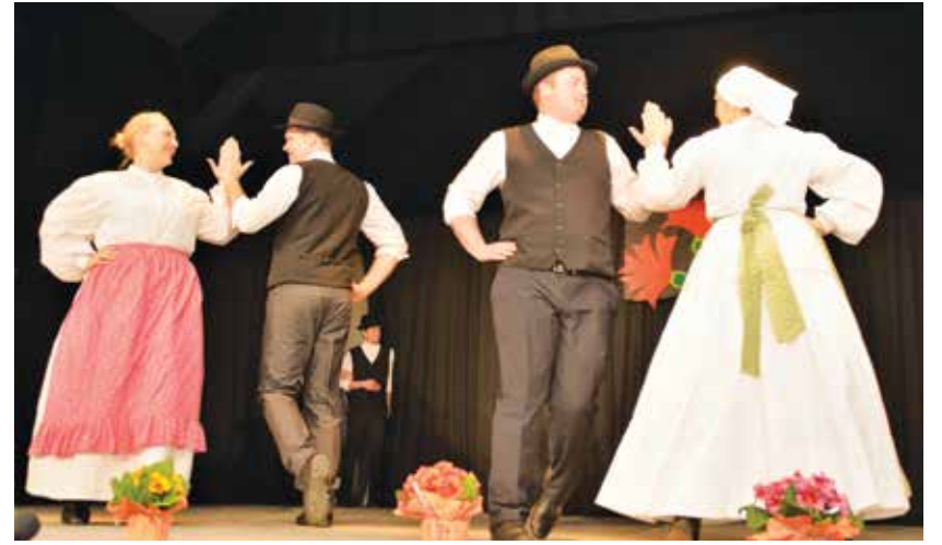
Še bolj na poskok so se zavrtele odrasle folklorne skupine v Galiciji.