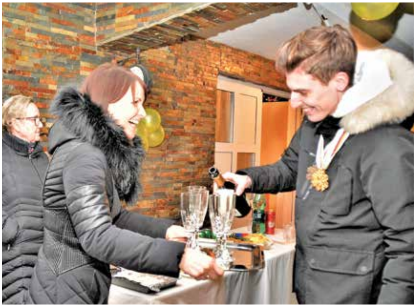
Timi se je izkazal tudi kot natakara, pri čemer mu je pomagala tudi njegova izbranka.

je bilo super, nepozabno in čustveno, zlasti ko je meni v čast igrala slovenska himna in nato še vsem mojim sotekmovalcem po ekipni tekmi. Sedaj je že tri dni od takrat, glava se je umirila, vtisi so strnjeni in pripraviti se moram na tekme, ki me še čakajo do konca sezone. Žal ne moremo v nedogled proslavljati, a sem zelo vesel, da sem danes lahko prišel domov in s tem razveselil svoje domače, sosede, vaščane ... navijače. Res je super, bo pa za proslavljanje več časa po zaključku sezone. Upam, da tudi zaradi še kakšnega dobrega rezultata na tekmah na Norveškem in Finskem in na poletih v Planici.«