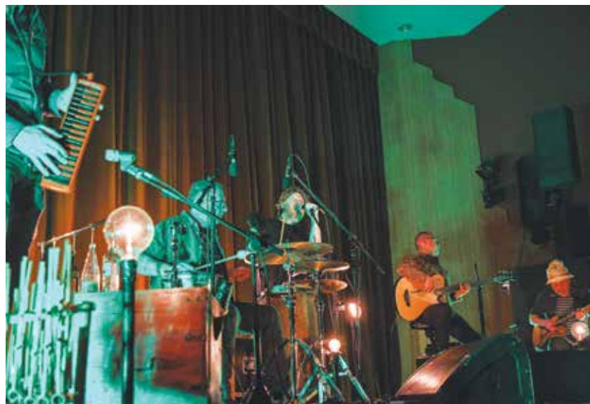
Tihi koncert, eno najuspešnejših in navdihujočih glasbenih potovanj