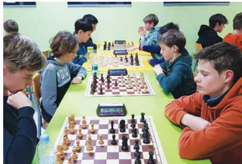
V Petrovčah so odlični tudi v šahu.