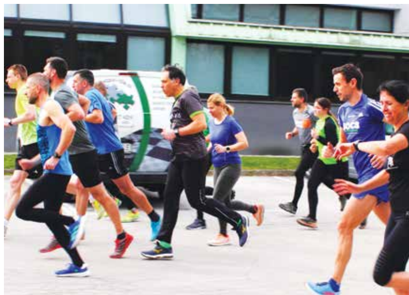
Prvi trije uvrščeni v absolutni moške kategoriji

V otroških kategorijah, tekme so potekale na atletskem stadionu v Žalcu, je med dekletih prvo mesto