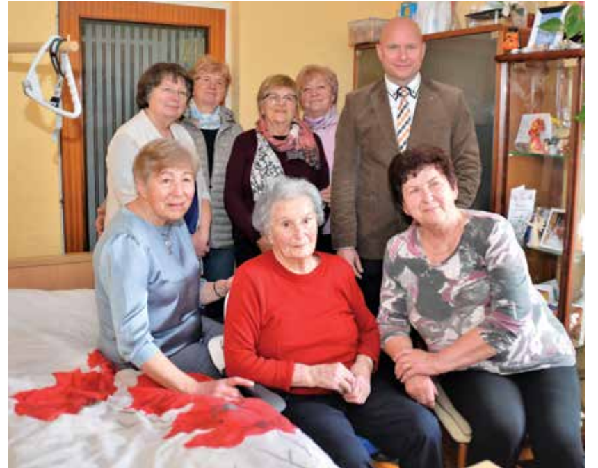
Skupinska slika s hčerkama (na vsaki strani jubilatke) in gosti