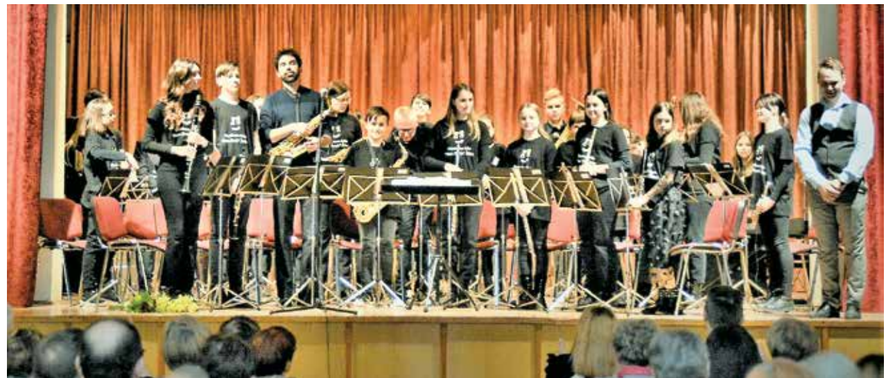
Ob zaključku nastopa Pihalnega orkestra GŠ RS Žalec

V preboldski dvorani Glasbena šola Risto Savin Žalec vsako leto organizira koncert v počastitev dneva žena in hkrati tudi materinskega dne. K sodelovanju vedno povabijo tudi Pihalni orkester Prebold, ki se z veseljem odzove in skupaj z njimi izkaže spoštovanje ženam in materam ob njihovem prazniku.