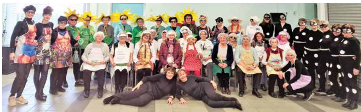
Skupna fotografija vseh šestih skupin v pustnih kostumih

Po nasvetu strokovnjakinje pri pospravljanju začnemo z oblekami, ker pri tem najlažje prepoznamo, kaj imamo radi. Potem se lotimo knjig, dokumentov in papirjev, sledi pa vse ostalo: hišni tekstil, športni rekviziti in pripomočki za dom. Čisto na koncu se lotimo še sentimentalnih