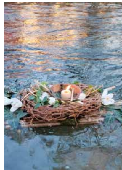
Gregorčki so na vodi zasijali v polni lepoti.

Zbralo se je veliko število otrok s starši, ki so najprej na ogled postala-