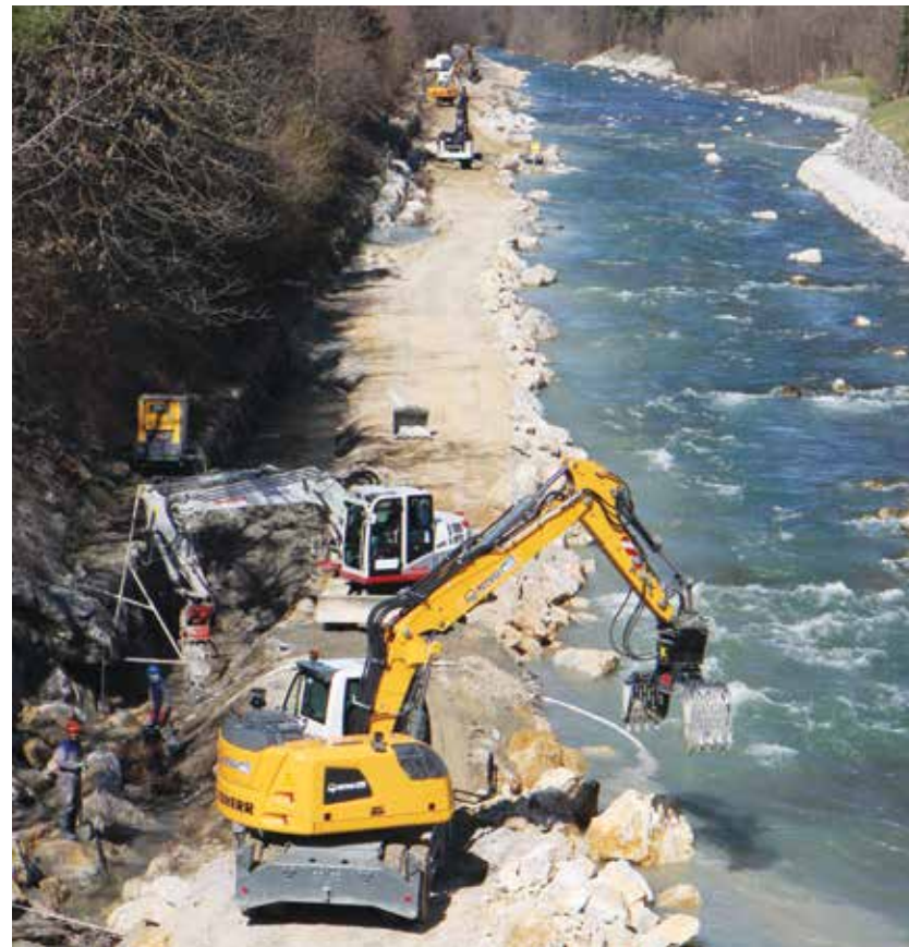
Sanacija desnega brega Savinje