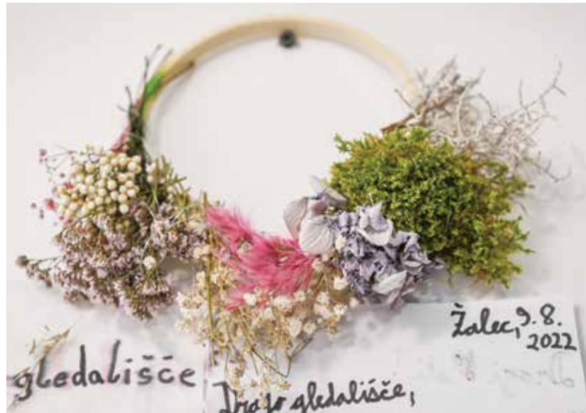
V mladinskem centru organizirajo številne ustvarjalnice.

že močno kadrovske podhranjeni. Veliko so nam pomagali študentje, prostovoljci in zunanji sodelavci, a kontinuirano delo in nadgrajevanje storitev, ki prideta čez čas, lahko zagotavljajo le redni sodelavci. Na srečo sta nam ustanovitelja prisluhnila in odobrila dodatna sredstva za zaposlitev strokovnega sodelavca in poslovnega sekretarja, ki sta z delom nastopila v zaključku leta 2022. Prav tako pa smo v novem kompleksu zaradi izvajanja tržne dejavnosti hotela in kavarne zaposlili še dva redna sodelavca. Trenutno je v zavodu tako redno zaposlenih šest oseb, preko drugih oblik dela pa nam redno pomaga še enkrat toliko zunanjih sodelavcev.«