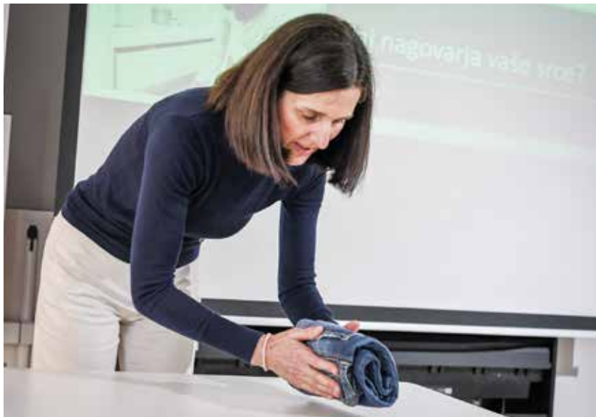
Oblačila zlagamo na poseben način.

K spomladanskemu čiščenju lahko pristopite s holistično metodo.