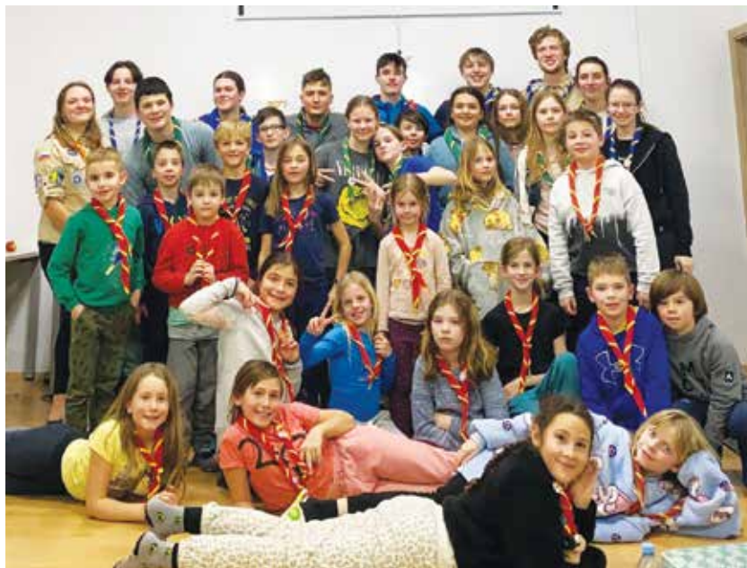
Otroci so babicam pokazali del svojega ustvarjanja.

Taborniki rodu Bistra Savinja Šempeter smo od 17. do 19. februarja organizirali zimovanje v Planinskem domu Kal.