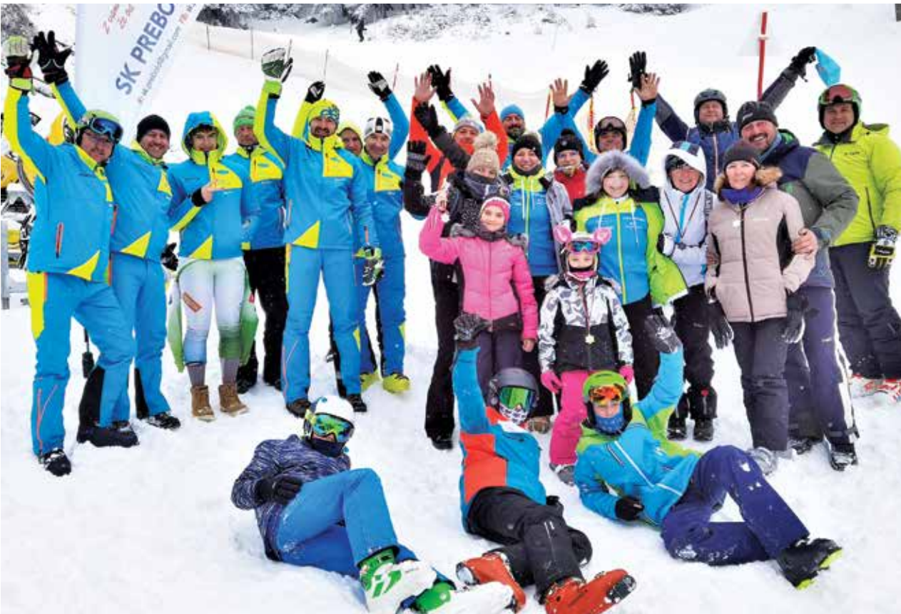
Skupinska slika po končanem tekmovanju