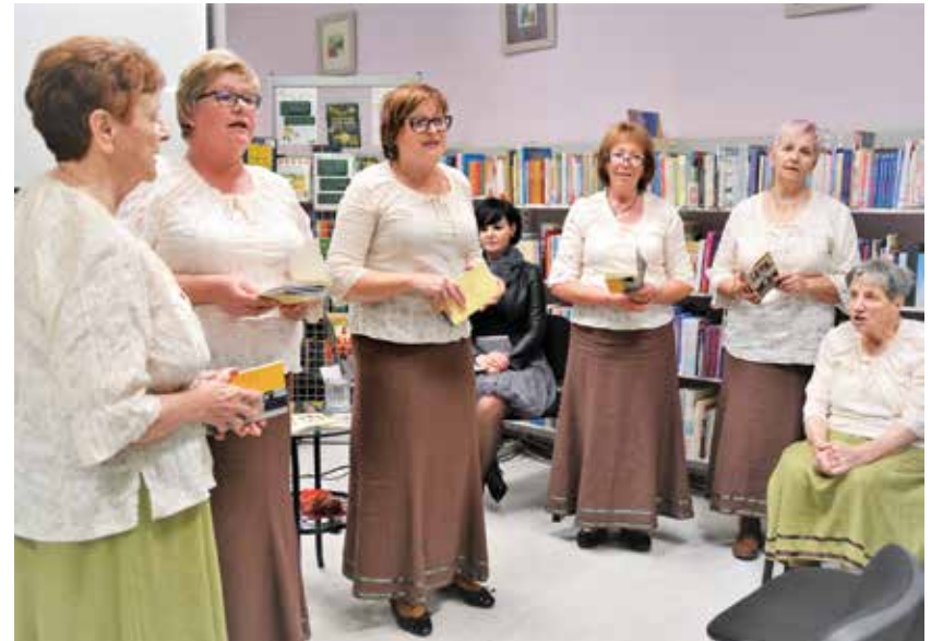
Ljudske pevke med nastopom

dokaz, da je važna vesela duša, da telo poje in se radosti. Po predstavitvi vsake skupine se je začelo druženje ob soku in krofih. Tedenska ura, kolikor se družijo po navadi, je bila daljša. Sorodniki so pripeljali tudi članice, ki so sicer v domovih za starejše, in zato je bilo srečanje res popolno.