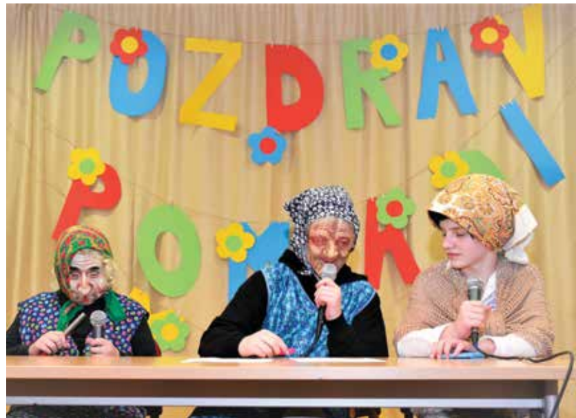
Na odru so se zvrstile najrazličnejše točke, med njimi tudi skeč z dogajanjem v domu za ostarele.