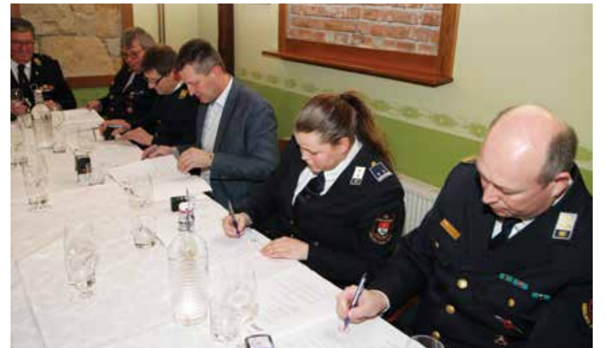
S podpisa pogodbe

Predsedniki društev so ob koncu nekaj besed namenili lansnemu delu in načrtih dela za letos.