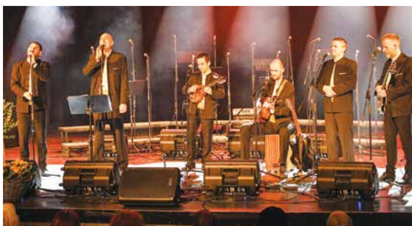
Klapa Kampanel vedno pritegne k petju tudi občinstvo.