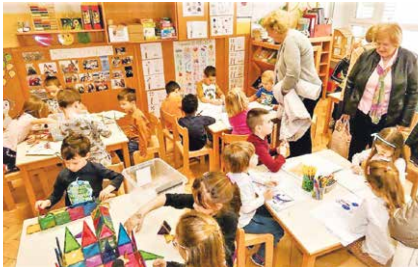
Otroci so babicam pokazali del svojega ustvarjanja.

bojne odnose, spreminjajo stališča in tabuje o mladi in stari generaciji,