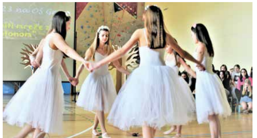
Eden od nastopov iz zaključne prireditve