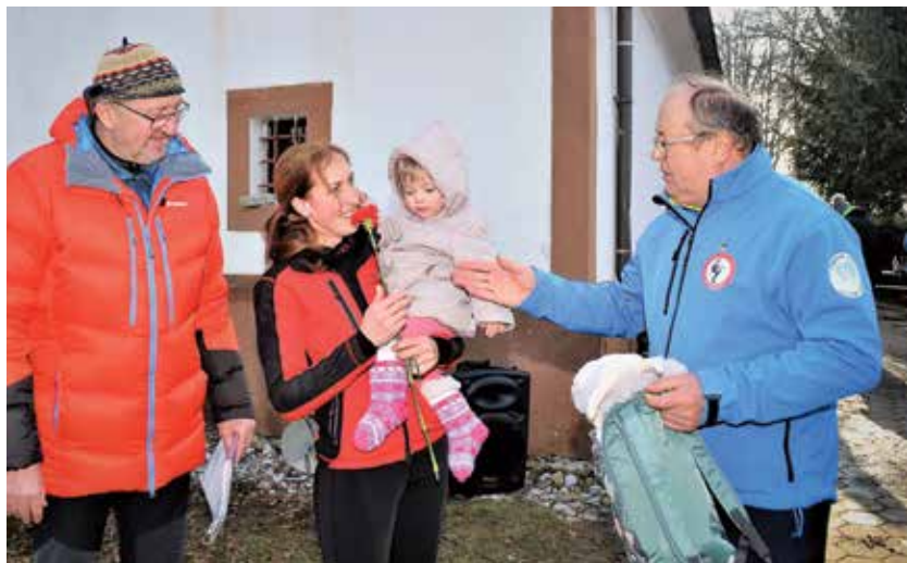
Med podelitvijo darila najmlajši pohodnici

Planinsko društvo Zabukovica je tudi letos pripravilo pohod, posvečen mednarodnemu prazniku žensk, in ga zaključilo s prireditvijo in podelitvijo priznanj na svoji planinski postojanki na Homu.