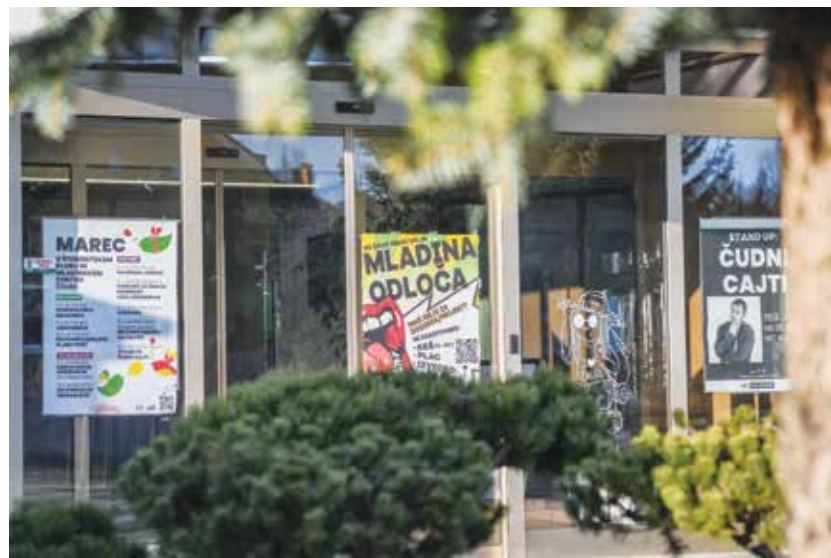
V mladinskem centru se kaj zanimivega dogaja dobesedno vsak dan.