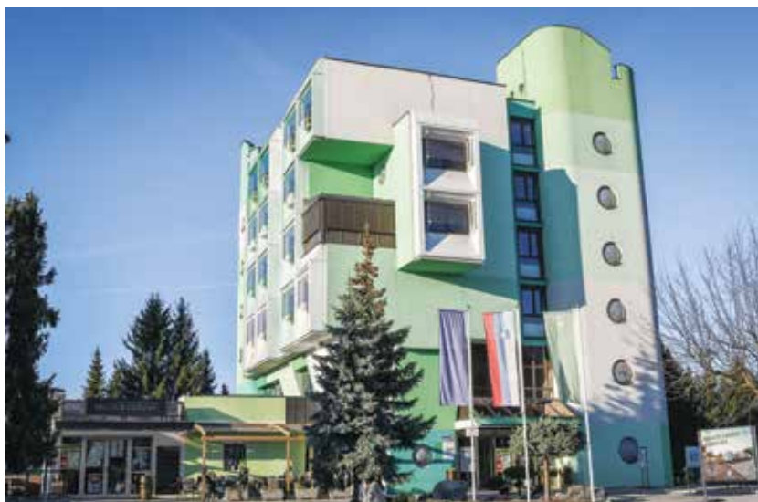
Nekdanji hotel Žalec čaka prenavo

se bližali barvi piva z zlato-bakrenimi odtenki, ki bi bili bolj primerni od sedanje zelene barve. Zagotovo pa so zelo dotrajane vse napeljave, ki jih bo treba zamenjati in posodobiti, pri tem pa arhitekti predlagajo, naj bo obnova tako temeljita, da bo zadoščala za 60 in več let.