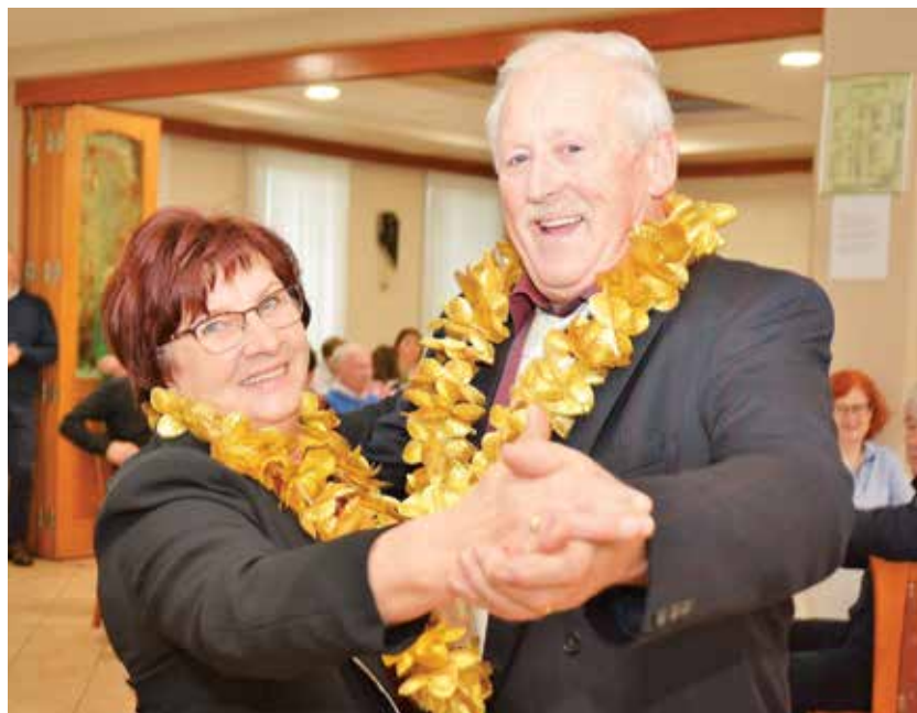
Oba rada plešeta, kar sta dokazala tudi na svoji zlati poročni zabavi.