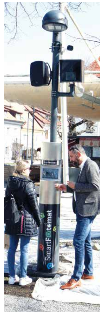
Foto točka SmartFotoMat je letošnja novost