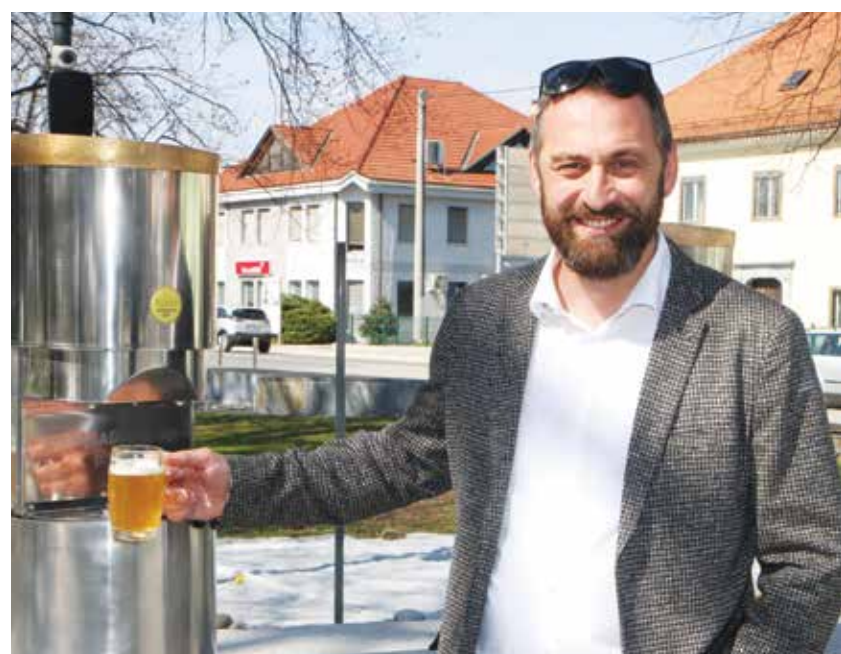
Letos bomo lahko zbirali med 21 vrstami piva iz 19 pivovarj.