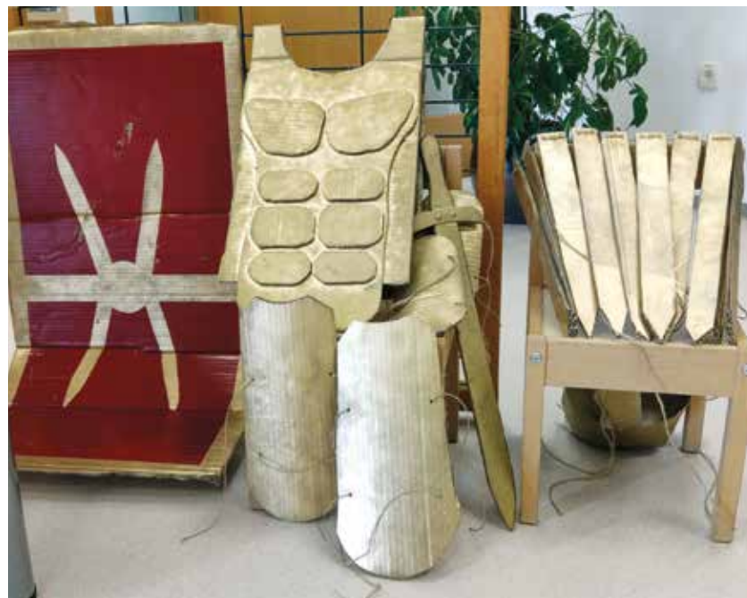
Nekaj fotoutrinkov z razstave