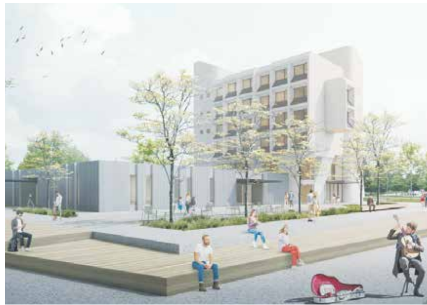
Videjni zasnovi prenave hotela so predstavili zunanjo podobo po preureditvi hotela.

Avtorji idejne zasnove so knjižnico odprli na obe strani, poleg sedanjega vhoda bo vhod tudi s ceste oziroma zahodne strani. Urejen bo predprostor. V pritličju bi poleg knjižnice (oddelka za otroke), centralnega stopnišča in servisnih prostorov uredili tudi manjšo večnamensko dvorano za 50 do 60 oseb, ki bi bila primerna tudi za zunanje uporabnike.