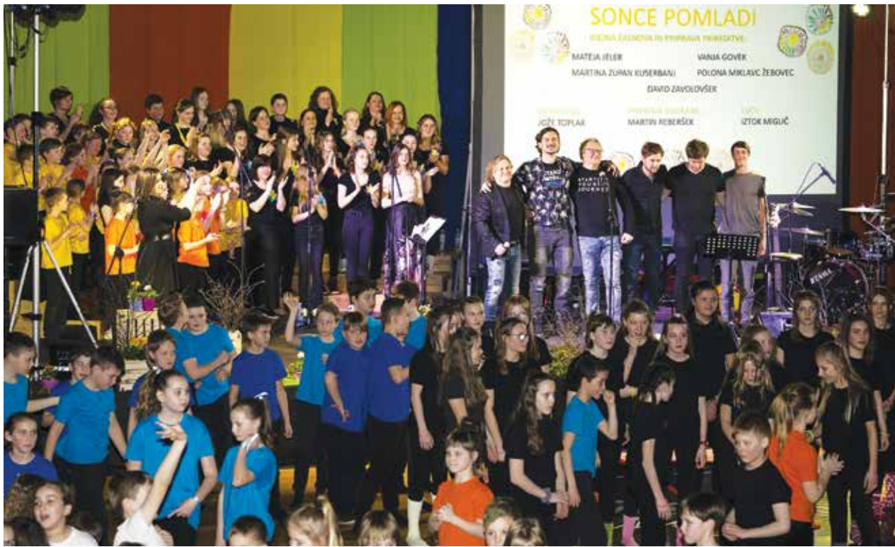
S prireditve ...

OŠ Vransko-Tabor je v četrtek, 9. marca 2023, v športni dvorani pripravila glasbeno-plesno prireditev Sonce pomladi, s katero so počastili praznični marec.