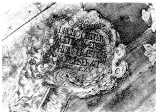
Detajl mizice z upodobitvijo Bistre