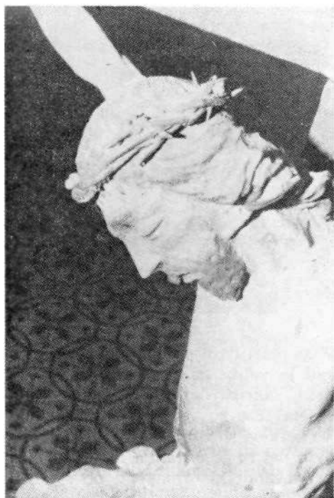
Križani v Marijini kapeli v Črnem Vrhu

Najlepše še ohranjeno in prav tako po tradiciji sporočeno Ortnerjevo mizarsko delo je zakristijska omara na Valterskem Vrhu. 28 Oblikovana je kot masivna kredenca. Spodnji zaprti del podpirata dva polstebriča, zgornji del z odprto polico in ornamentiranimi krili ob straneh pa se na vrhu razvije v cvetlične oblike in neregularno hrustančevje. Tako se v poznem 18. stoletju spet srečamo z izročilom zlatih oltarjev in opreme 17. stoletja. Omaro je že močno načel zob časa. Najbrž ni edini Brunov izdelek na loški strani.