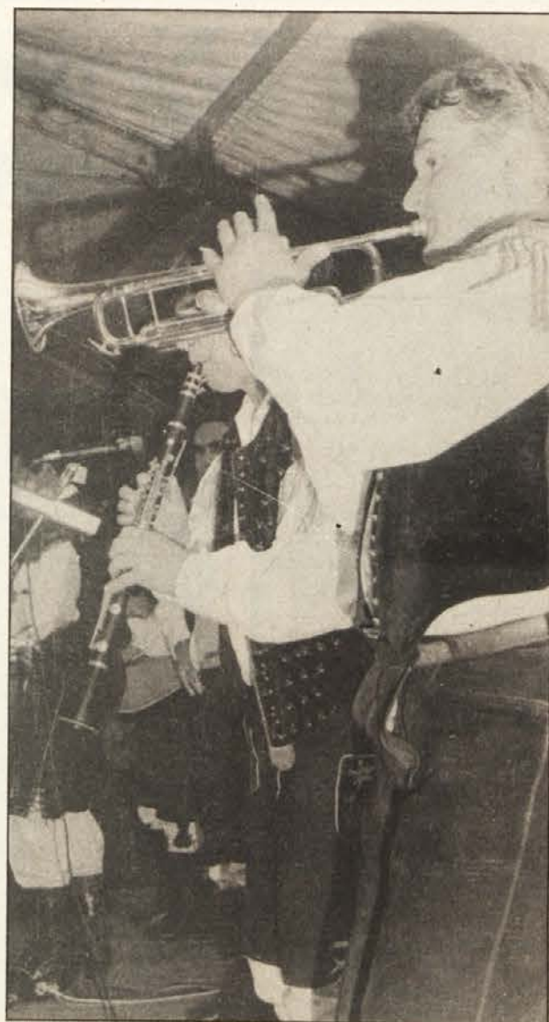
Nad 1500 ljubiteljev domače zabavne glasbe je prejšnji petek pri Šoštariju v Globasnici doživelo koncert narodno-zabavnih ansamblov (na sliki skupina „Alpina“). Koncert je bil nepreslišen klic odgovornim v deželi in državi naj pridejo Glasbeni šoli na Koroškem s subvencijami na pomoč

Haiderjeve izjave je ostro zavrnilo tudi zvezno ministrstvo za pouk na Dunaju. „Prizadevamo se za nadaljevanje dela v komisiji v stvarni in konstruktivni klimi in brez vsakega pritiska od zunaj“.