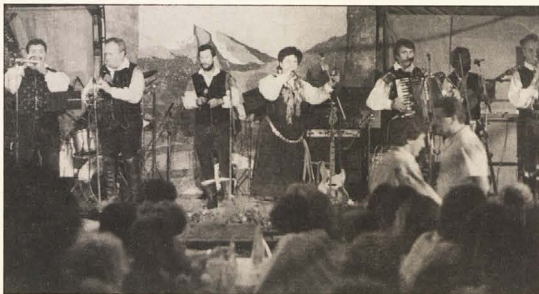
Narodno-zabavni ansambli iz Koroške in Slovenije so sodelovali na koncertu za Glasbeno šolo, katerega se je udeležilo nad 1500 ljubiteljev domače glasbe.