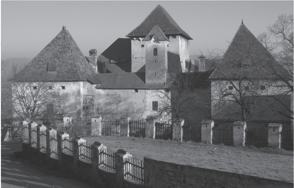
Gracarjev turn danes