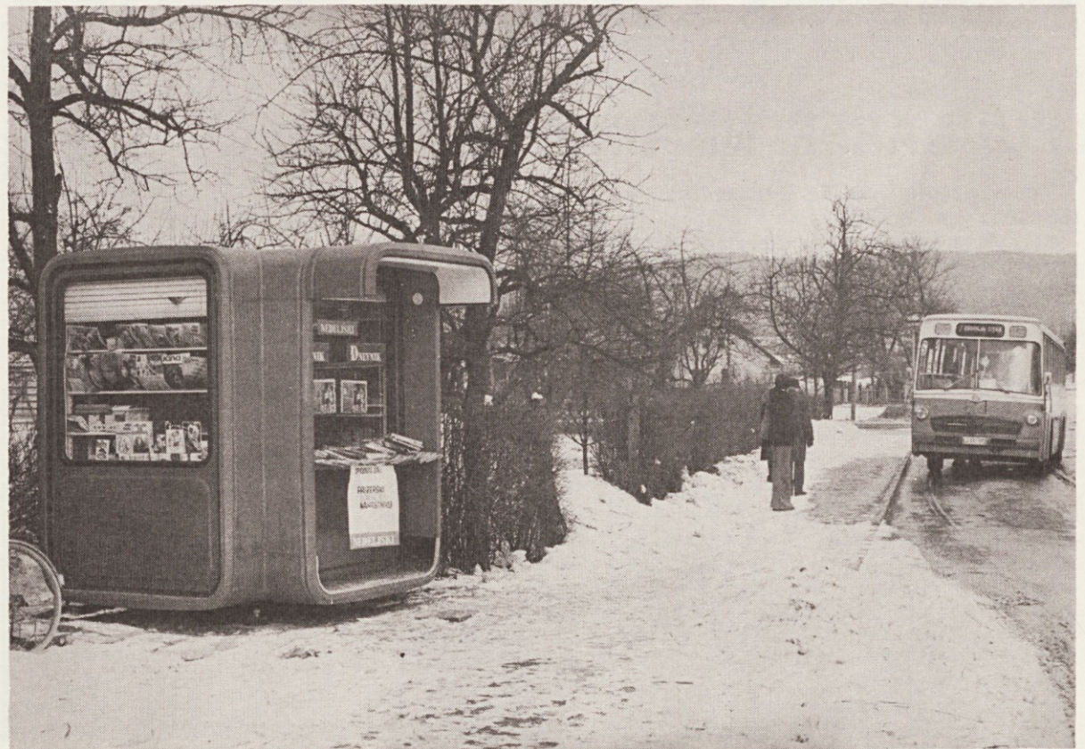
To je novo prodajno mesto Dnevnika na končni postaji avtobusne proge št. 7 v Kamnogoriški ulici. Tak kiosk že stoji tudi v Šišenski ulici, v kratkem pa bo prodajna služba postavila v Ljubljani še dva kioska.

Gre torej za neke vrste premostitveno kreditiranje, ki ga naj bi odobraval Dnevnik iz svojega poslovnega sklada svojim stalnim naročnikom. Če pa hočemo to akcijo tudi izvesti, bi morali povečati poslovni sklad za približno 2.200.000 din do 2.500.000 din. Tako bi si zagotovili svoje stalne odjemalce, ne glede na njihovo trenutno nelikvidnost.