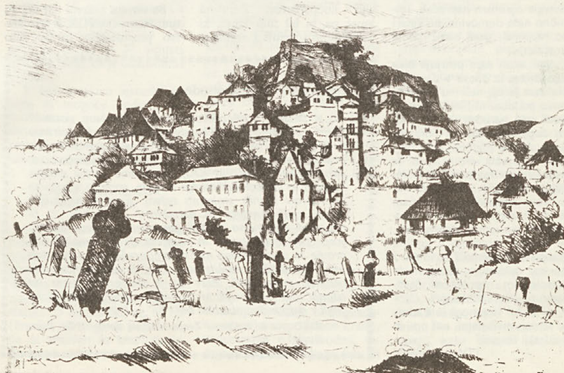
Božidar Jakac: JAJCE (jedkanica, 1946)