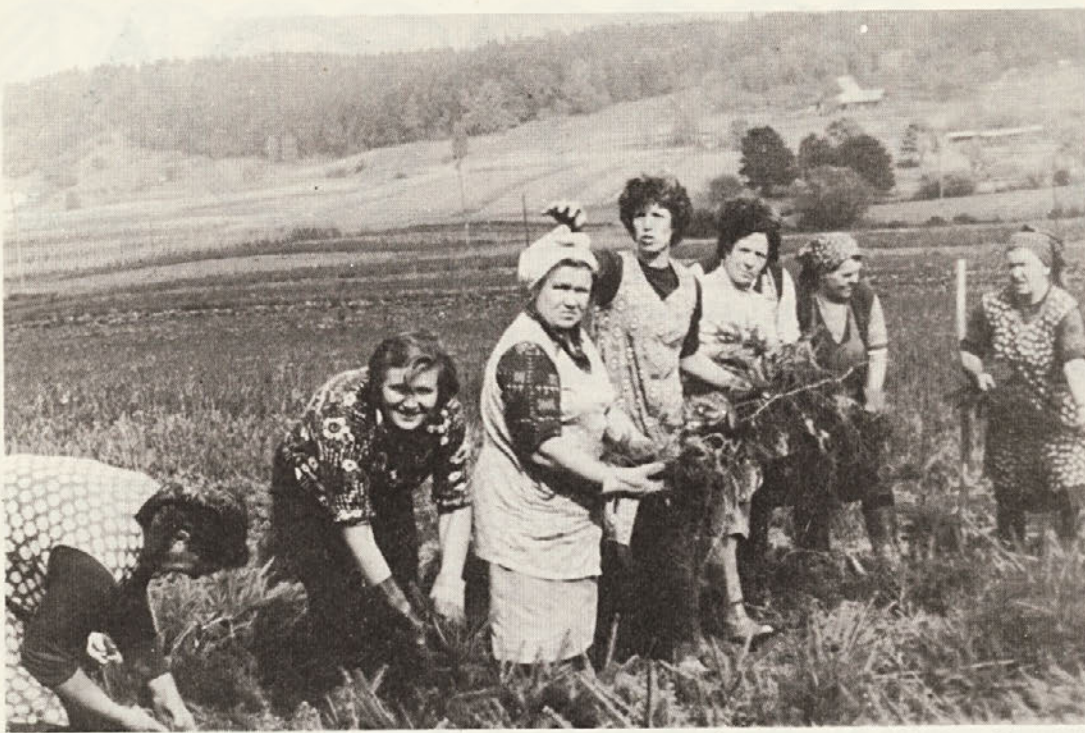
Končujemo z jesenskim pogozdovanjem. V drevesnicah smo vzgojili obilo sadik. Delavke v drevesnici Rožek sortirajo in vežejo sadike, ki jih v gozdu že čakajo pripravljena tla in pridne roke pogozdovalcev.

treba tudi zakon o gozdovih v tem smislu spremeniti.