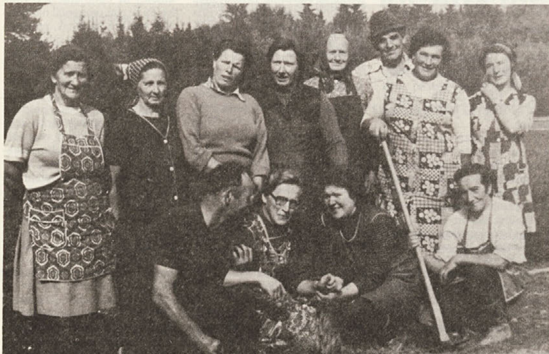
Ko so izkopale sadike, kolikor jih bo presajenih v gozd to jesen, so se želele delavke v drevesnici Struga fotografirati. Saj je bilo to delo zadnje letos, ko so še tako skupaj. Prihodnjo pomlad jih bo drevesnica spet potrebovala.