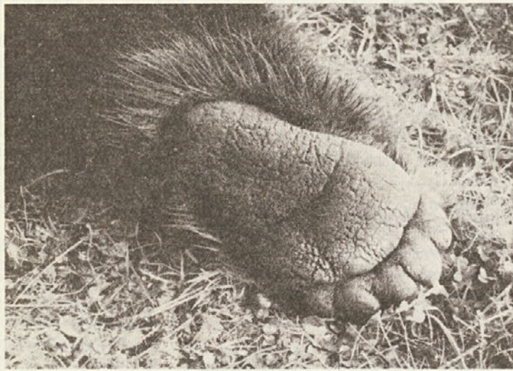
Medvedova šapa – fotografirana seveda na kosmatincu, ki so ga spretni lovci že položili na dlako. Takle „podplat“ z ostrimi kremplji pa je v naravi seveda vse kaj drugega kot „lepa igračka“.