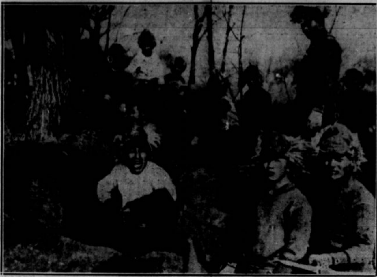
Militaristi na Japonskem so s svojo propagando in hujskanjem spravili ljudstvo v histerično vojno razpoloženje. Pripovedujejo mu o nevarnosti, ki proti Japonski iz Amerike, Rusije in Kitajske. Nove japonske čete odhajajo v Mandžurijo in v provinco Jehol ob Mandžuriji, katero si Japonci laste v prid "neodvisne" mandžurske države. Japonci so spravili v zagato tudi ligo narodov. Državniki se na njenem zborovanju v Ženevi pričakajo, kako bi japonske generale pomirili in

pridobili japonsko vlado za mirnejšo politiko na Kitajskem. Japonska je kršila mirovne pogodbe lige narodov in one, ki jih je sklenila s drugimi državami, npr. Kelloggov pakt. Vesilele bi zdaj morale z njo obratovati, kar bi bržkone vodilo v svetovno vojno. Vrhutega tudi same niso nič boljše. Eni evropski državniki celo simpatizirajo z Japonsko v njenem osvajanju Kitajske, medtem ko jo radi javnosti obsojajo. Na sliki je oddelček japonskih čet, ki tabore v Mandžuriji.