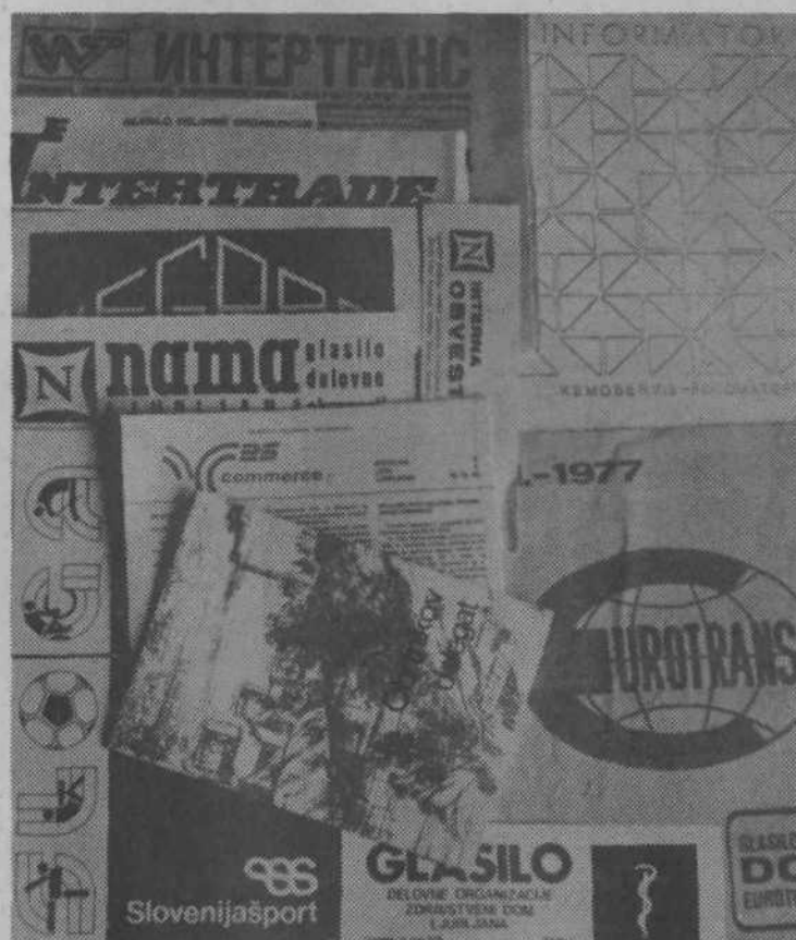
GLASILO DELOVNIH KOLEKTIVOV iz sedemdesetih let — 4. del

Mladina v šolah že od nekdanj rada piše. Predvsem se navdušuje za pesmi, pa tudi krajša proza ji rada zdrzne pod pero. Zadnja leta mladi posvečajo vse več pozornosti tudi sporočanju o svojem življenju in delu na šolah ter v krajevnih skupnostih. Kaj čudnega torej, da imajo na vseh osnovnih in srednjih šolah v naši občini svoja glasila?! Le na