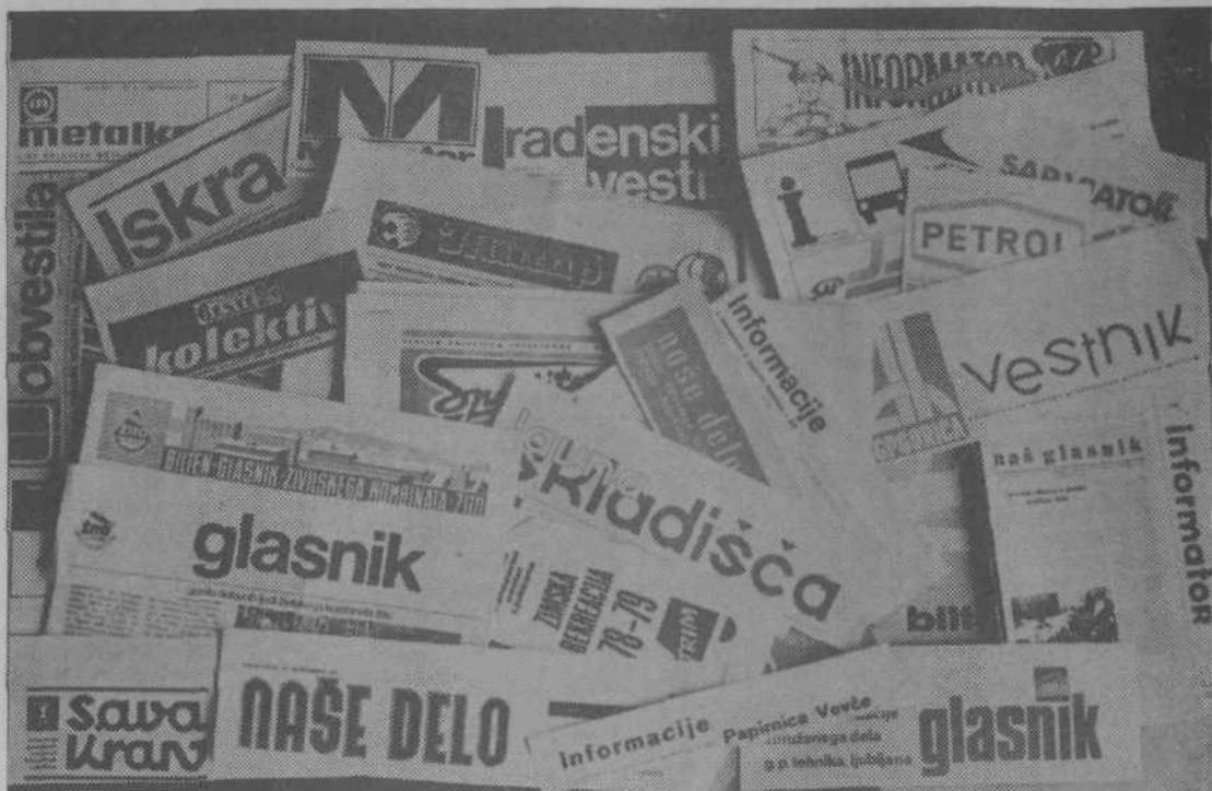
GLASILO DELOVNIH KOLEKTIVOV iz šestdesetih let — 1. del

Poslovno združenje prevoznih podjetij Slovenija transport Titova c. št. 48 (kasneje Poslovno združenje za cestni promet Vektor, Šmartinska c. št. 104) je izdajalo od leta 1962 do 1963 mesečno (od 1964 do 1966 občasno) glasilo ST (Slovenija transport), kasneje VEK-