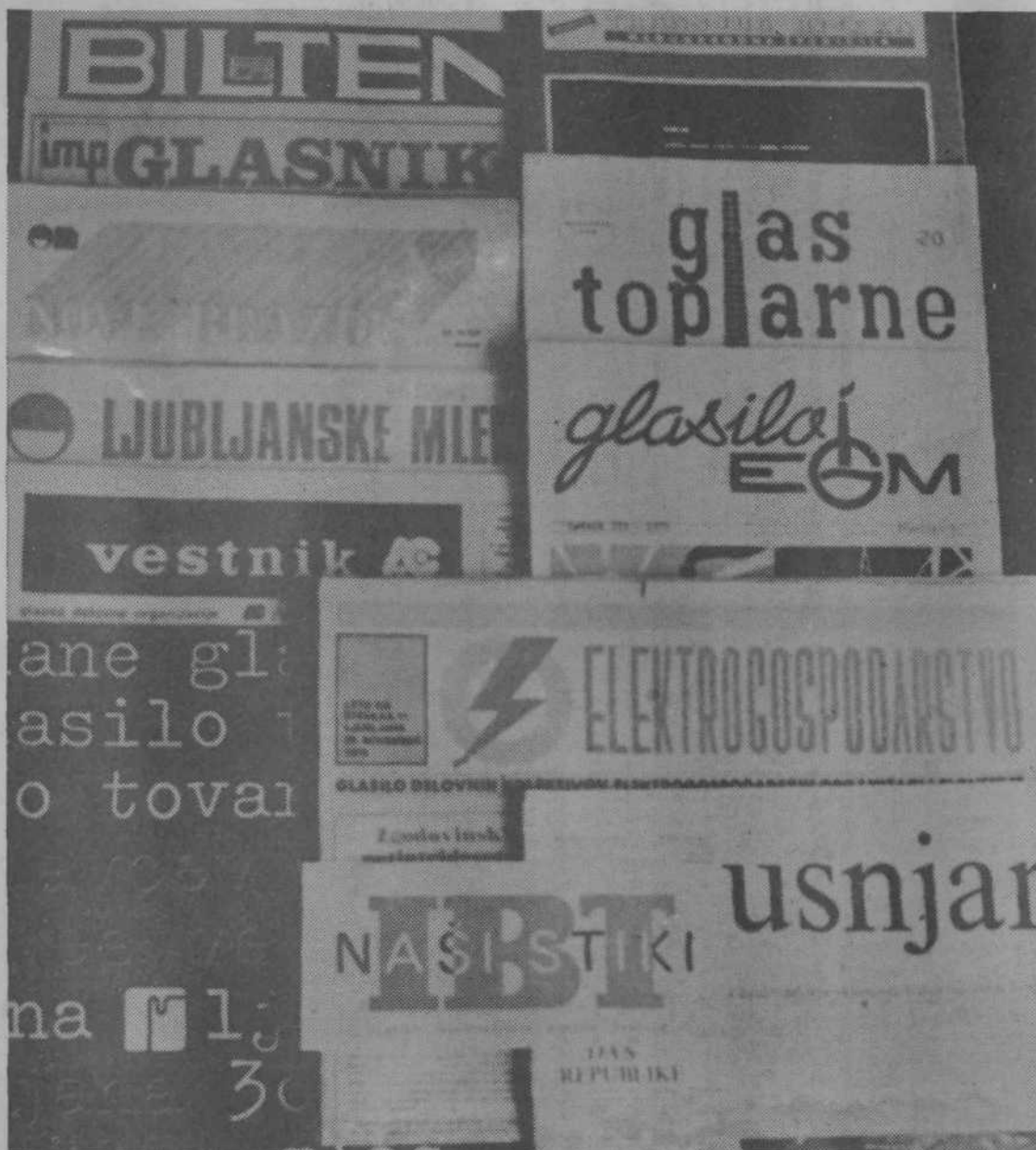
GLASILO DELOVNIH KOLEKTIVOV iz šestdesetih let — 2. del