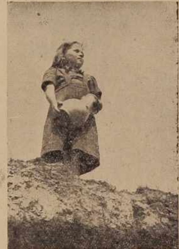
Motiv z Goričkega

Cesta od Kuzme čez Motovilce in Topolovce proti Soboti pa je prav tak žuljav problem, ki traja že desetletja. Pradedje kmetov iz teh vasi so naredili nekoč napako, ker niso sprejeli nekaj novega v svoje življenje. Bila je to proga za vlak. Trasa je bila še zakoličena in vse je bilo pripravljeno za gradnjo, toda kmetje niso hoteli odprodati del svoje zemlje za pot proge. Zato gre ta proga zdaj drugod. Njihovi sinovi so že nekoliko drugačnih misli. Hoteli so imeti državno cesto v tej smeri. To je najbolj ravni predel do skrajnih goriških vasi. Na vseh drugih cestah je več vzpetin. Nekateri kmetje so zbirali podpise za gradnjo dobre ceste na tistem mestu, kjer so še zdaj kolne poti in vaške ceste. To je bilo pred drugo svetovno vojno. Po osvoboditvi pa so se najbolj podjetni zavzeli za akcijo in del te ceste toliko uredili, da jo je prevzel v oskrbo okraj. To je del ceste iz Kuzme skozi Dolič in Gornje Slaveče. V letošnjem letu pa si prizadevajo v Motovilcih in sosesčini. Tu so aktivni cestni odbori in kmalu bo nekaj iz stare obrabljene ceste. Temu zgledu je treba slediti še drugod skozi vasi prav do urejene okrajne ceste, ki vodi v Mursko Soboto in