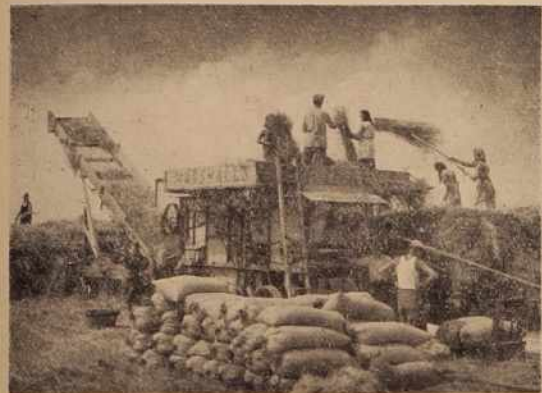
Letos je srednje dobra letina — prabijo mlatici in kmetovalci. Boljša seveda tam, kjer so sejali dobro seme in zemlji tudi primerno gnojili.

jočih sort in uveljavljanjem sodobnih pridelovalnih ukrepov kar najbolj povečati hektarske donose.