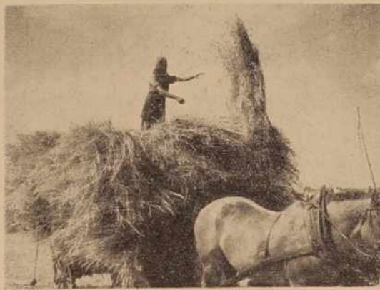
Le krepko vrzi, da bo voz čimprej poln!

Po razstavi je bila revija naslednikov plemenskih bikov po skupinah. V glavni skupini so bili po-