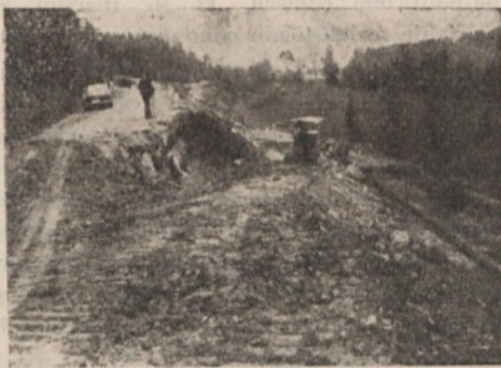
Stara in porajajoča se nova cesta