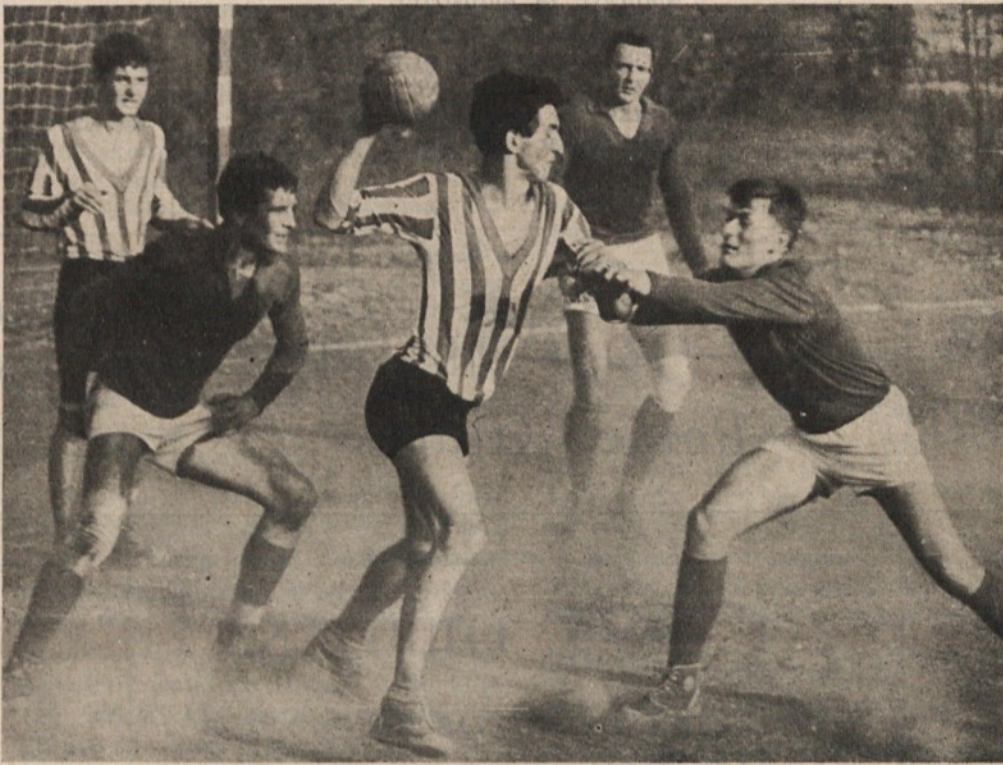
Rokometaši „Partizan—Krima“ so se s porazom z Dinamom v Pančevu (19 : 10) poslovili od letošnjega tekmovanja za jugoslovanski pokal. Uvrstitev med osem najboljših moštev v državi predstavlja doslej največji uspeh mladih rokometišev z Rakovnika.

To pa je le v skromnih obrisih bežen prikaz stanja in težav v telesnovzgojnem življenju na področju viške komune. Za boljše uspehe in čim širšo agitacijo mladih z njihovim vključevanjem v športne in ostale telesnovzgojne institucije, pa bo potrebno storiti še marsikaj, zlasti pa še pridobiti sredstva, ki ne bi bila v prihodnje tako skopo odmerjena kot doslej. Prav pri tem pa velja razmisliti, komu vse in v kakšni meri naj