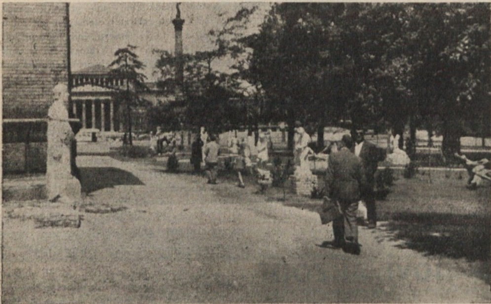
Del moderne galerije na prostem

29. junija smo se poslovili od glavnega mesta in z avtobusom krenili na 12-dnevni oddih ob Blatnem jezuru. Pri poslovilni večerji v hotelu „Palace“ so nam toliko opevani madžarski cigani poleg ostalega zaigrali: „Tamo daleko, daleko kraj mora, tamo je selo moje“ in pa „Ti s' Marička moja...“ čemur je sledila kopica govornjenja.