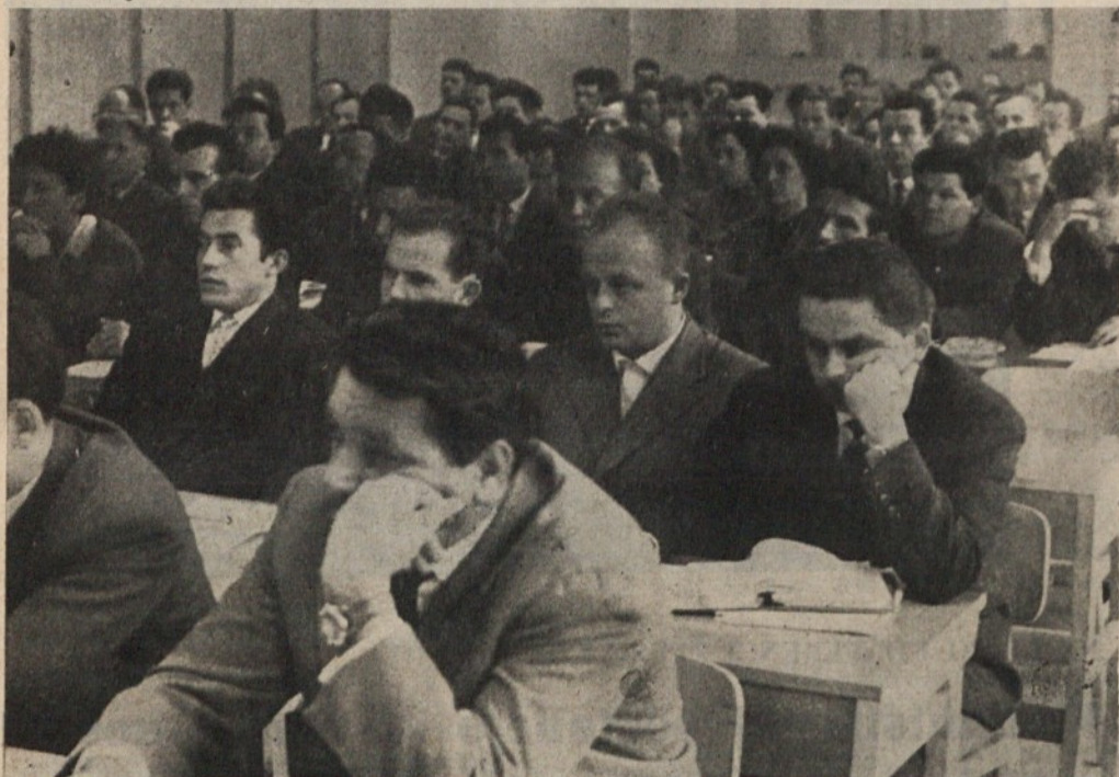
Delegati med delom konference

Podatki nam kažejo, da je bilo konec septembra ustvarjeno 74,3% od plana za leto 1962, narodni dohodek pa s 74%. Rezultati so ugodni in kažejo, da bo plan v celoti dosežen oziroma presežen.