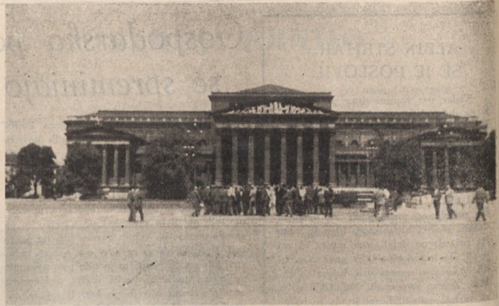
Za kratek čas smo se ustavili tudi v narodnem muzeju

bivanja otrok v ustanovi bo prilagojen potrebam staršev in pa tudi otrok samih. Poleg vzgojno-varstvenih nalog, bodo skrbeli tudi za fizični razvoj varovancev. Gojenci bodo lahko prejeli v ustanovi tudi ceneno malico in pa kosilo.