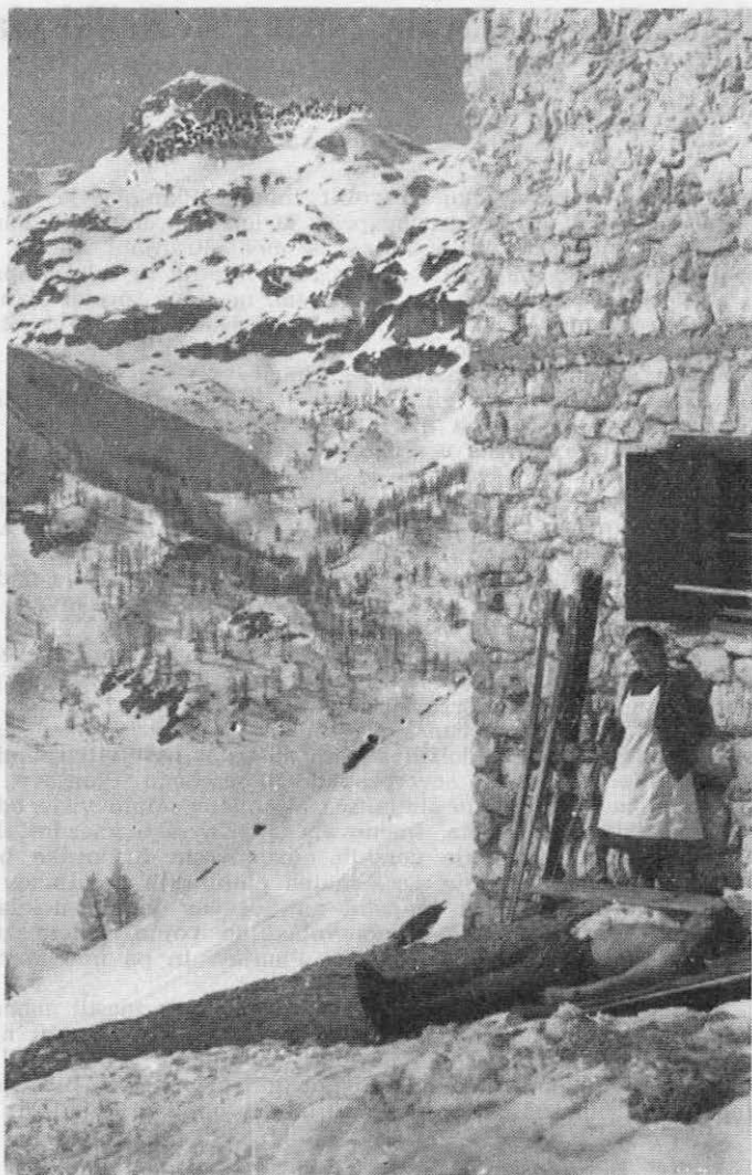
Zgodnje spomladansko tihožitje ob Vođnikovi koči, ki ga v poznem poletju zamenja glasno vpitje

Julijcev? Ali bo to še naš Triglav? Pri- znati moramo, da bo prizadet marsi- kdo, ki ljubi gorski mir. K sreči pa je pri nas še dovolj zatišnega gorskega sveta, tudi zahodno od Velega polja, kjer je priroda za- varovana z zakonom o Triglavskem na- rodnem parku. Ne- kateri trdijo, da je treba gore približati množicam in ne množice goram. Drugi pa jim opo- rekajo, češ saj so gore take, kot so, na voljo in dostopne vsem, ki se ne bra- nijo truda. Z isto upravičenostjo bi lahko alpinisti raz- drli že nadelane ste- ze na pr. iz doline Vrat na Triglav, češ saj imamo speljane plezalne smeri čez severno triglavsko steno. Je že tako, da si hribe lasti vedno več ljudi, tudi taki, ki so ostareli, slabotni, neokretni in komodni. V čiga- vem imenu bi jim skušali preprečiti la-