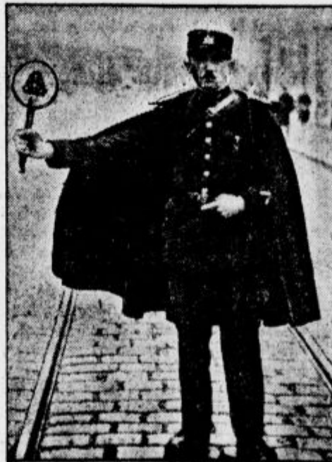
Policiisti, ki svetijo. Leva slika nam kaže pariškega prometnega policista z električno razsvetljeno signalno palico, ki jo vozniki že od daleč vidijo. Desna slika pa nam kaže policista z električno žarnico na kapi.