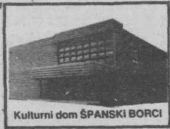
Kulturni dom ŠPANSKI BORCI

To pa je bil morda tudi glavni namen zadnje razstave fotosekcije KUD Vide Pregarc. Je bil dosegšen dovolj globoko in široko? D. JEŽ