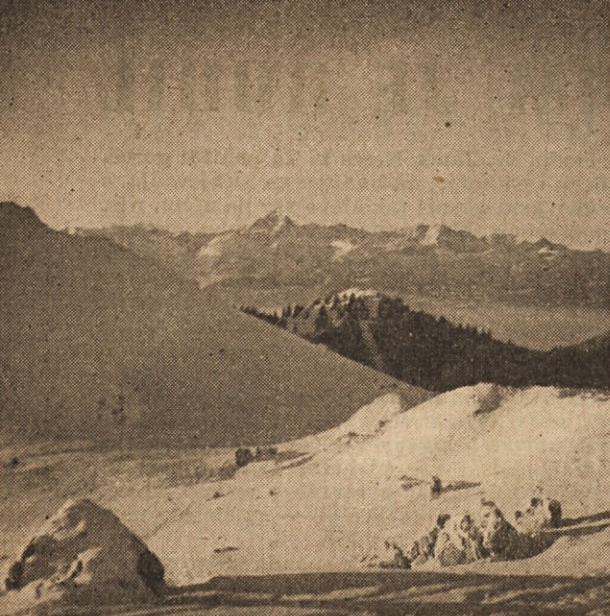
Triglavsko pogorje v zimi

di adventa nam ga že kaže v bližini: „Že je blizu Gospod...“ Štiri dni pred božičem točno napoveduje že dan njegovega prihoda: „Ne bojte se; peti dan namreč že pride k vam naš Gospod.“ Zadnji dan, na vigilijo, nam naznani konec našega pričakovanja: „Glejte, dopolnilo se je vse, kar je bilo oznanjeno po angelu o Devici Mariji.“ V stolnih cerkvah in samostanih, kjer se opravljajo slovesne dnevnice, se poje vzneseno oznanilo, kakor jih pozna malo cerkvena liturgija, ki naznanja veliki dogodek človeške zgodovine — rojstvo učlovečenega božjega Sinu.