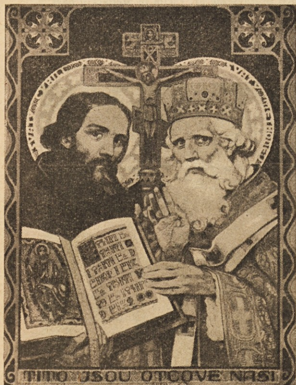
Sv. brata Ciril in Metod