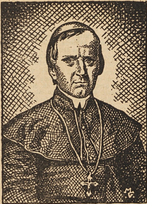
Antonius Martinus Slomšek

Gorečnost za zveličanje duš Slomšku ni pustila, da bi se omejil samo na svojo škofijo, temveč se je raztezala zlasti na misijonsko področje. Že kot spiritual v semenišču je znal navdušiti svoje gojence za misijone. S številnimi misijonarji je bil v stalnem dopisovanju ter je njihova pisma objavljal v svojih listih. Bil je osebni prijatelj velikega misijonarja in poznejšega škofa Friderika