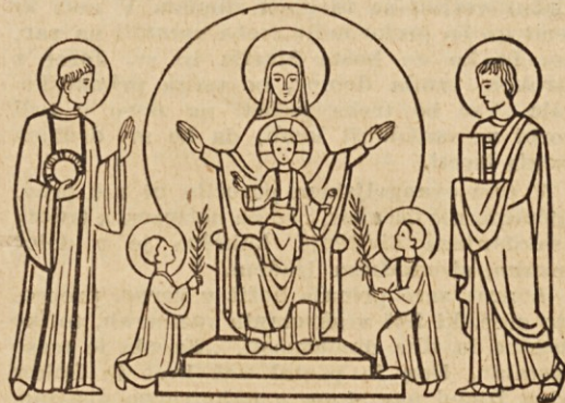
Ob Mariji in Jezuščku: nedolžni otroci, sv. Štefan in sv. Janez Evangelist