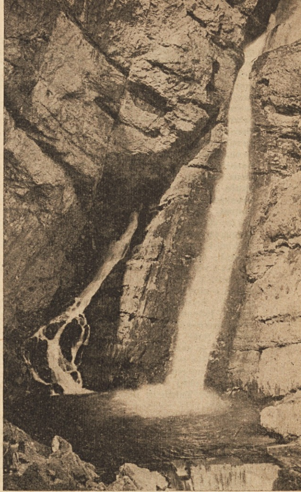
Slap Savica v Bohinju

Ta trojna nevednost jasno pokaže, kako potrebno je govoriti o čistosti.