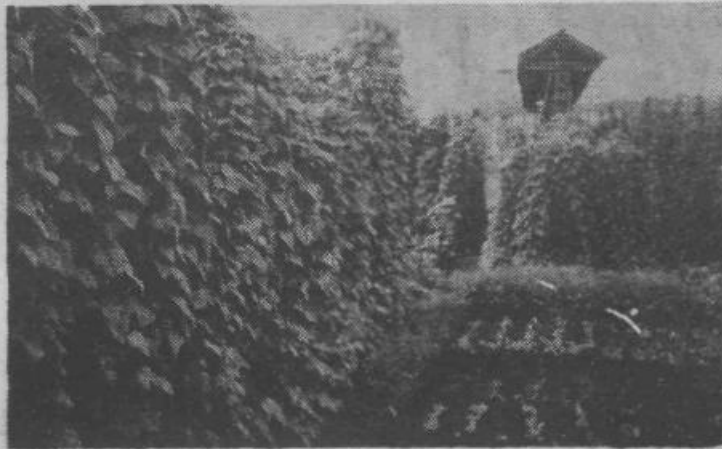
Nasadi fiziola ob robu naselja