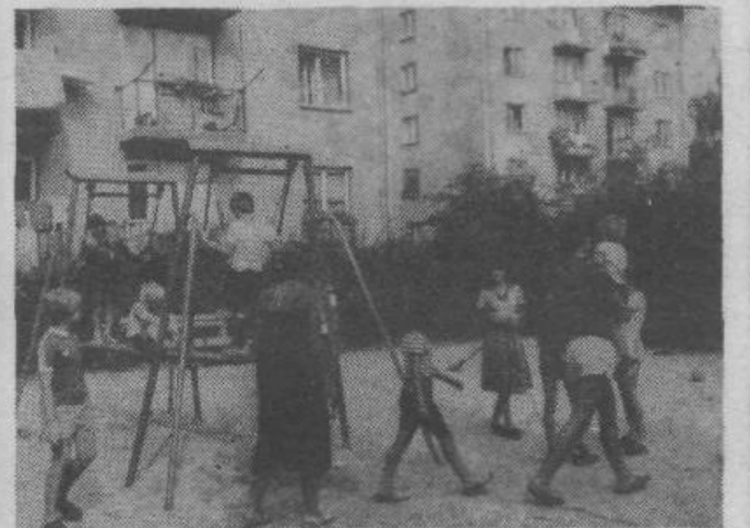
Pred odhodom na bazen so se otroci poigrali na igrišču pred vrtcem