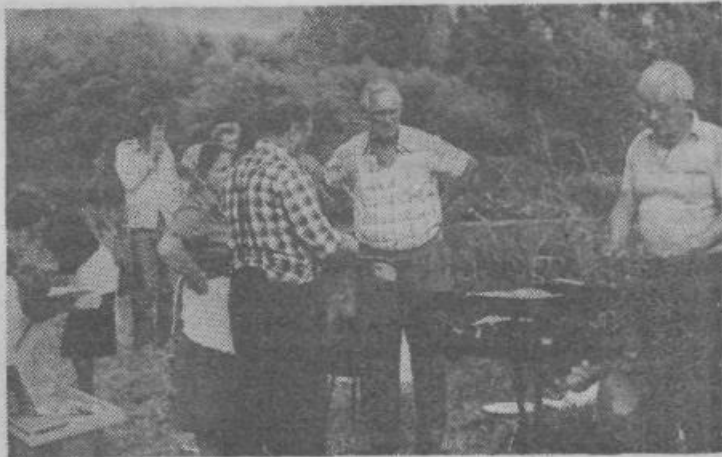
Ribiške specialitete na žaru: odlično!