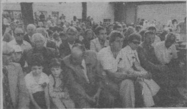
Udeleženci proslave s častnimi gosti v ospredju