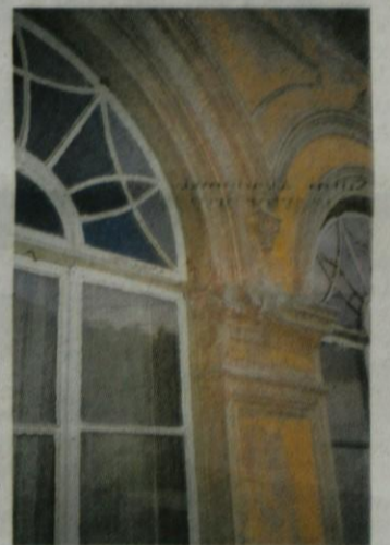
Detajl z vile podobarja Ozbiča pod Zapricami