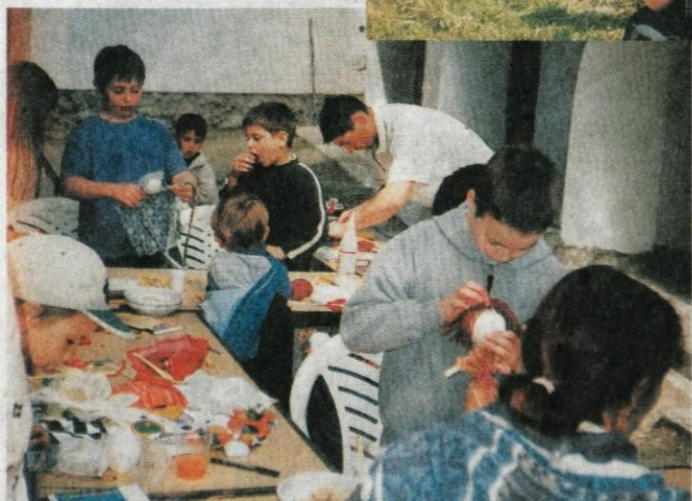
Medobčinski muzej Kamnik in Slovenski etnografski muzej sta pripravila na dvorišču gradu Zaprice muzejsko delavnico, kjer so izdelovali otroške igrače - lutke (na sliki).