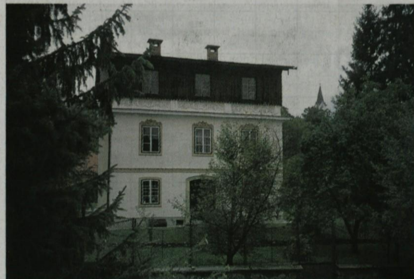
Vila podobarja Ozbiča pod Zapricami

stale sredi 19. stoletja, glavna pa konec stoletja v osemdesetih in devetdesetih letih ter na prelomu stoletja vse do začetka prve svetovne vojne, s katero se zaključijo cvetoče obdobje tovrstne arhitekture na Gorenjskem. Spremenjene družbenopolitične razmere, formiranje Jugoslavije in izoblikovanje stila zmerne modernizma po vojni tudi v arhitekturi vil pomeni novo poglavje, ki ga bo potrebno še raziskati in ovrednotiti.