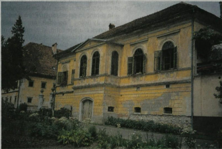
Pogled na Prašnikarijo

Kranj, na Bledu in Jesenicah pa poveže posamezne ruralne zaselke v novo celoto. Nenazadnje v interierih pogosto srečamo tudi kvalitetne oblikovne detajle, ki so najpogosteje res izbrani po katalogih, pa vendar so predhodniki modernega oblikovanja. Prve začetke gradnje vil sredi 19. stoletja beležimo na Bledu, ki je zaradi slikovite pokrajine in termalnih vrelcev prvi začel privabljati turiste. Najstarejše vile so na-