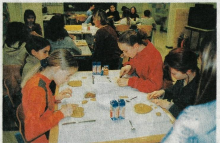
V ustvarjalni delavnici so nastajali loški kruhki iz slanega testa