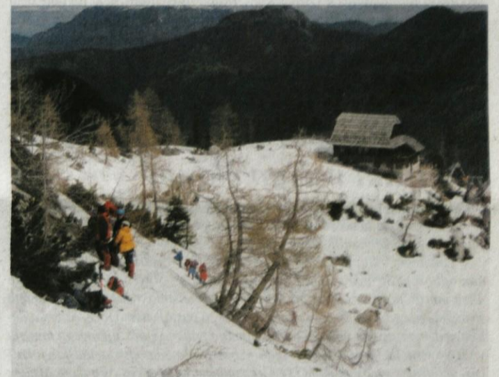
Sredi maja letos je bilo pri Češki koči še skoraj meter snega.

Toda poletje se neustavljivo bliža in pozimi zaprte planinske kočice