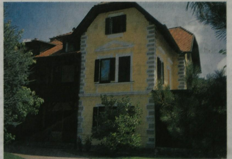
Vila Soss na Perovem