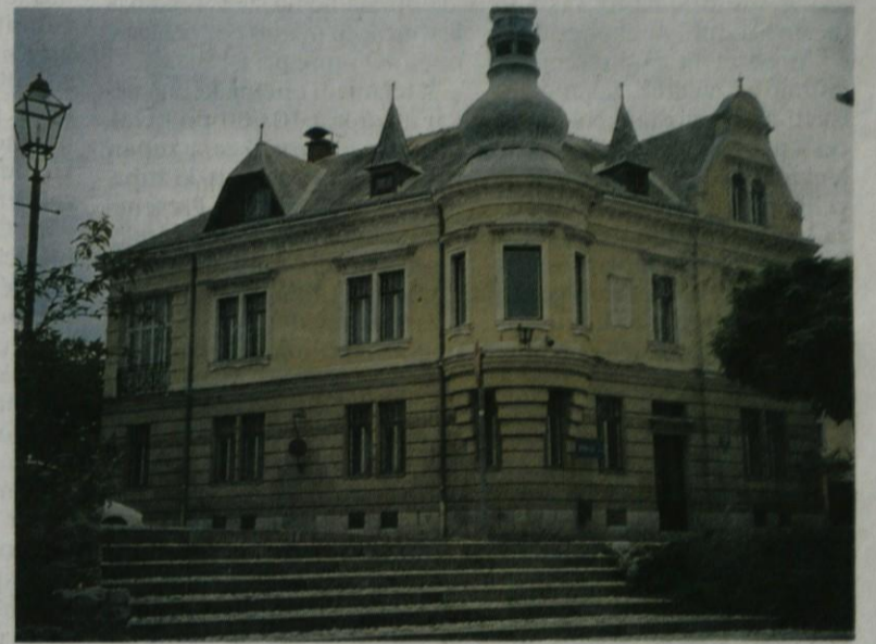
Orožnova vila v Kamniku arhitekta Antona Wolfa iz Ljubljane