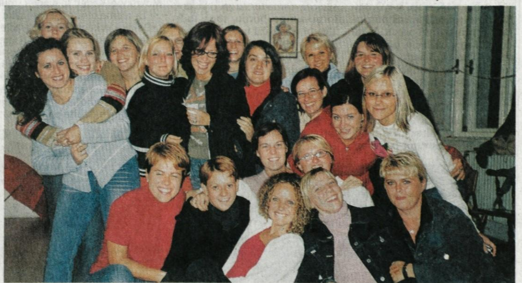
Prikupna in vselej nasmejana dekleta iz Dekliške pevske skupine Sirene že deset let družijo želja po petju, druženju in prijateljstvu.