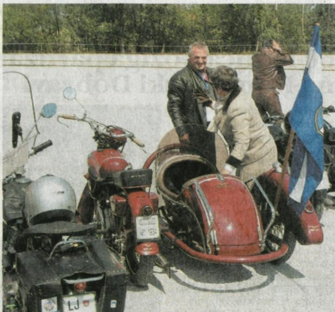
Moto Guzzi, letnik 1934, motor s prikolico