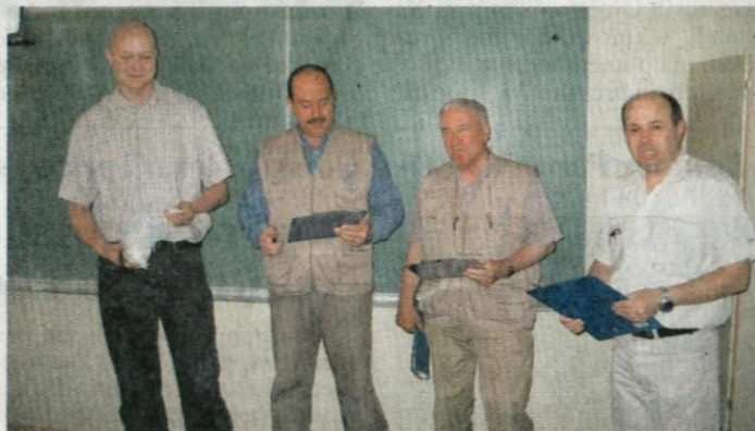
Člani občinskega sveta za preventivo in vzgojo v cestnem prometu so se na tekmovanje dobro pripravili.

računalnikih. Sledilo je preverjanje spretnosti na kolesih na poligonu na igrišču OŠ Toma Brejca. Nato pa so se mladi tekmovalci podali še na mestne ulice in prevozili progo po Usnjarski, Trgu svobode, Japljevi, preko Glavnega trga, Tomšičeve ulice, Trga prijateljstva, Maistrove ulice in se po Solski ulici vrnili na izhodiščno točko. Tekmovalci so bili razporejeni v dve skupini, v prvi so bili učenci učenci 5. in