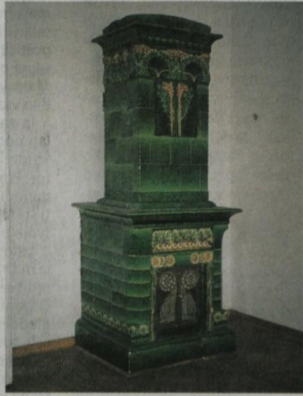
Secesijska peč v Orožni vili v Kamniku

tikov, znanstvenikov in nenazadnje tudi umetnikov, je gradnja vil pomembna tudi z urbanističnega vidika, saj je povezana z oblikovanjem prvih mestnih četrti izven starih srednjeveških jeder, kar velja zlasti za Radovljico in