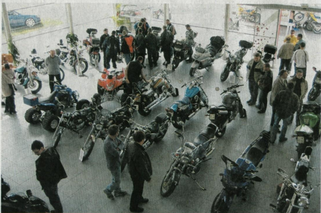
Preko šestdeset motociklov članov Moto kluba Kamnik in njihovih prijateljev je vabilo poglede in občudovanje obiskovalcev.

Že nekaj let se Kamnik, poleg mnogih znamenitosti, lahko pohvali tudi s svojim moto klubom. Klub deluje že od leta 1999 in od tedaj se člani družijo, skupaj potujejo in pripravljajo prireditve. Dosegajo tudi odlične dosežke v Supermotu in Minimoto, na spretnostnih tekmovanjih in amaterskih dirkah.