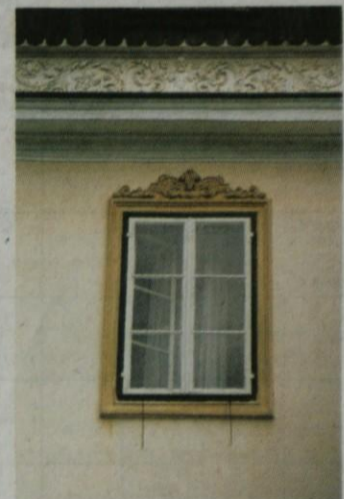
Okno na paviljonski zgradbi Prašnikarije