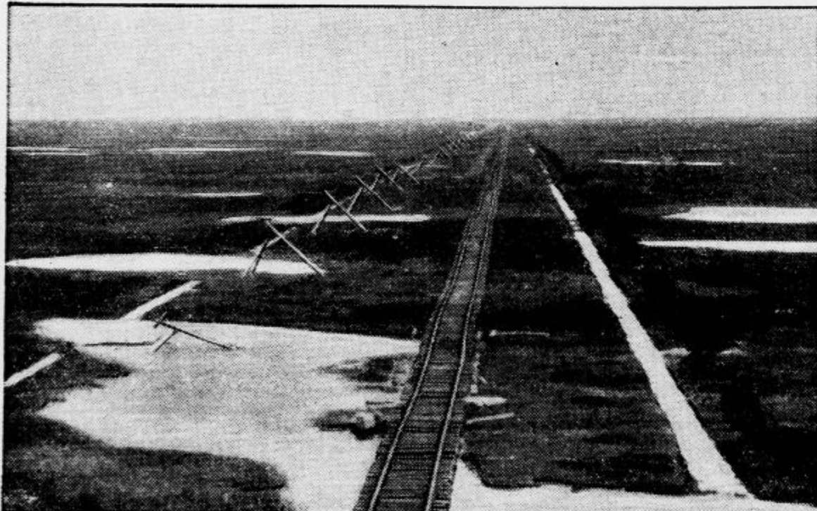
Na severu Kanade gradijo železnico, ki bo vozila čez dva metra debelo ledeno skorjo v Hudsonovem zalivu. Proga bo dolga 270 km. Namen železnice je skrajšati zvezo med vzhodno in osrednjo Kanado. Naprave na levi niso španski jezdci, ampak brzobojni drogi, ki imajo namen ščititi brzobojne naprave pomladi, ko se premikajo ledne plošče