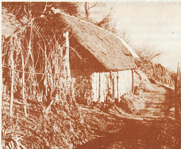
Zidanica na Homu