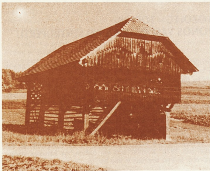
Toplar na Bistrici