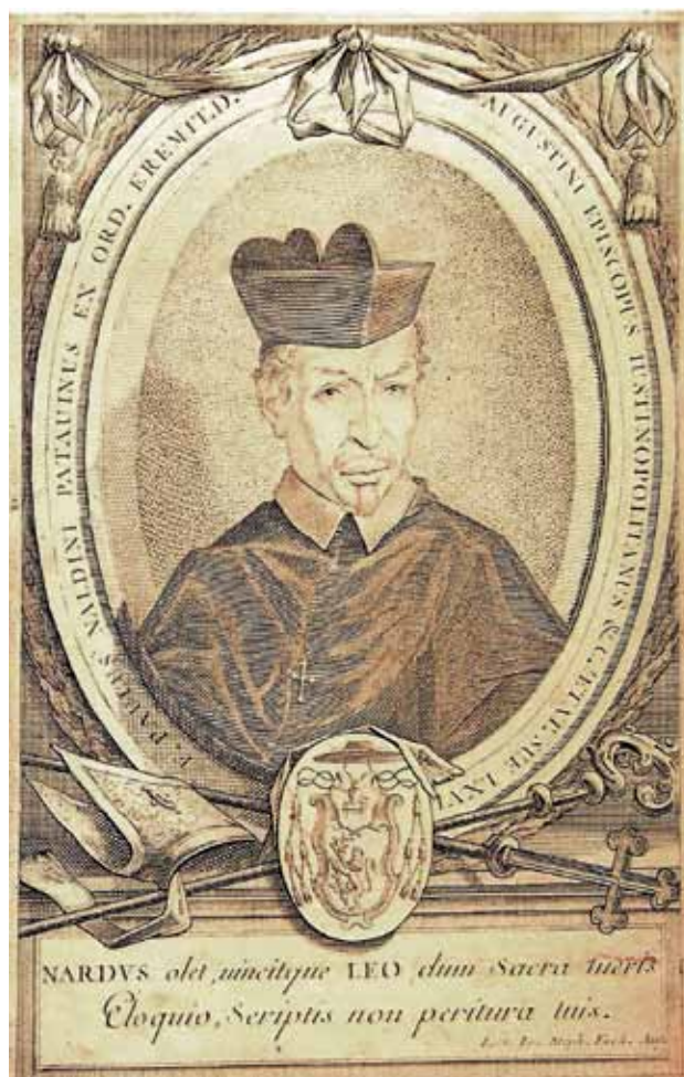
Sl. 2: Koprski škof Paolo Naldini ( Corografia ecclesiastica, Venezia 1700 ).

V Dalmaciji sta se srečali dve glagoljaški tradiciji: ena zahodna, ki je že zdavnaj likvidirala kult sv. Cirila in Me-