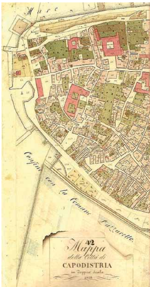
Sl. 3: Območje Zubenage z vrisanim tlorisom dominikanskega in gregoritskega samostana (Pikel, 2004, 18). Fig. 3: La zona di Zubenaga con la pianta incisa del convento domenicano e gregoriano (Pikel, 2004, 18).

toda (ker ju je rimska hierarhija proglašala za heretika), in druga vzhodna (makedonsko-humska-bosanska), ki je ta kult ohranila. To vzhodno so tretjeredniki verjetno prinesli iz Bosne.