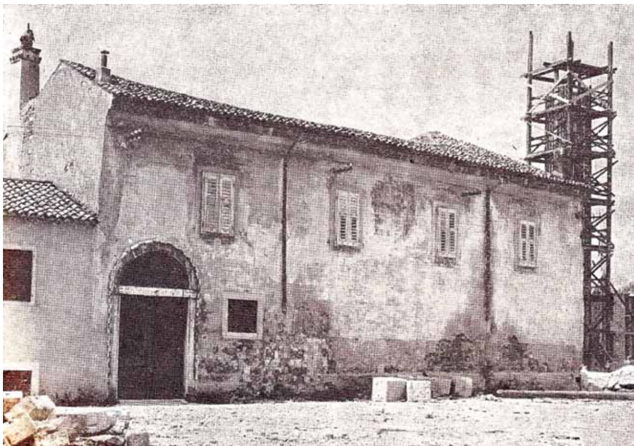
Sl. 5: Ostanke glagoljaškega samostana v petdesetih letih 20. stoletja.