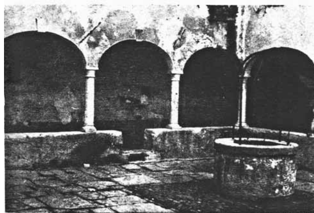
Klaustar bivšega samostana sv. Grgura

Sl. 4: Notranjost glagoljaškega samostana (Štefanić, 1956).