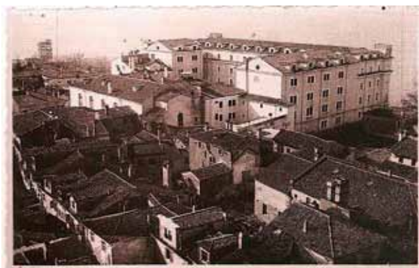
Pogled na koprške zapore z mestnega stolpa. Veduta sulle carceri di Capodistria dal torre civico.

Z dekretom o organizaciji svetne duhovščine in redovništva so oblasti radikalno posegle tudi na cerkveno področje. 25. aprila 1806 so bili s kraljevim dekretom v