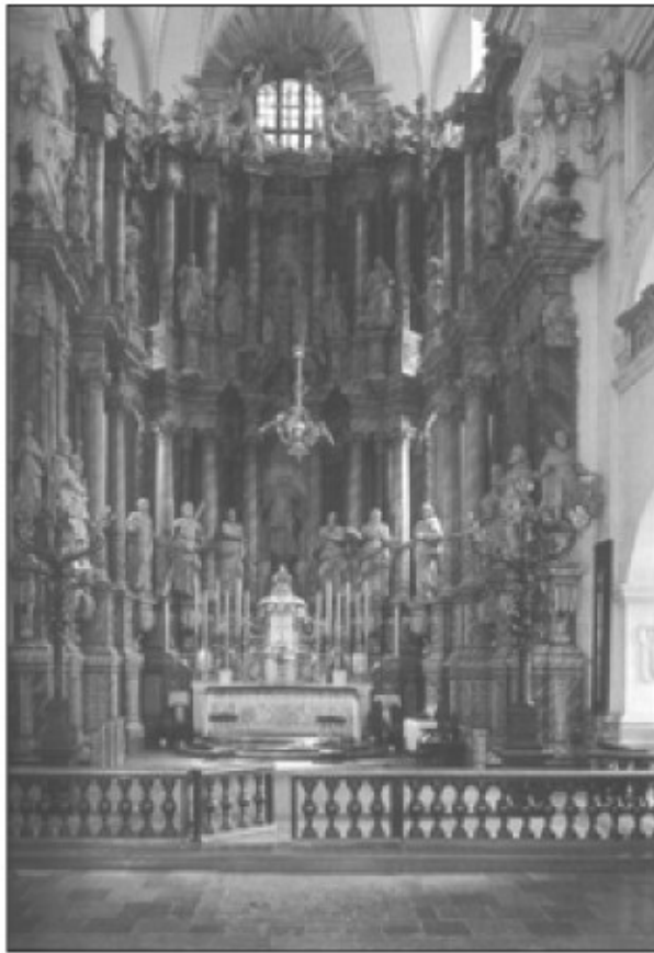
Okrašena notranjost jezuitske cerkve v Polocku