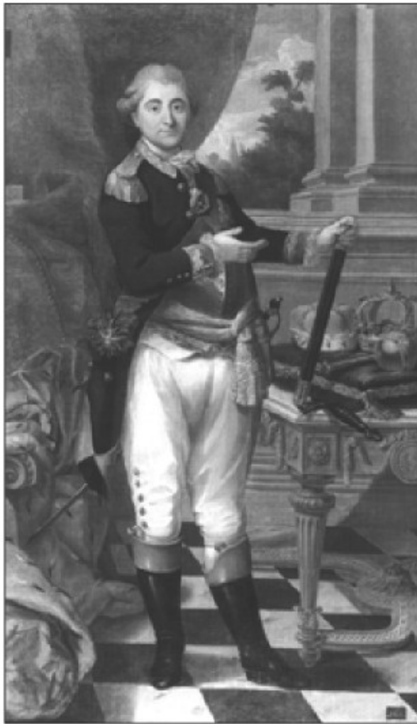
Poljski kralj Stanislav-Avgust II. Poniatowski (1732–1795)

Po prvi delitvi Poljske 14. 10. 1772 je dotlej poljska Belorusija pripadla Katarini II. 12 Generalni guverner Belorusije je postal jezuitom prijazni vojni minister Černišev. 13 Guverner Litve Brown je dobil ukaz, naj sprejme vsakega jezuita, ki bi se pojavil na ruskih mejah. 14 Sistrzenczewicz, 15 rektor kolegija v Polocku, se je šel poklonit carici z željo, da na poljskih posestih, zasedenih na novo, ne bi uporabila ukaza Petra Velikega, o izgonu jezuitov iz vseh ruskih dežel; to ni bilo ravno v skladu z njegovo poznejšo politiko do jezuitov. 16