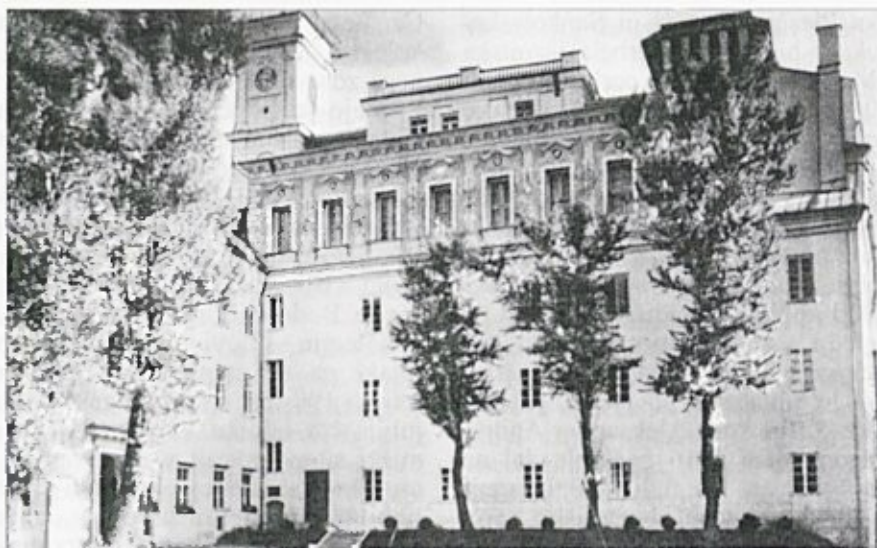
Poczobutov observatorij na univerzi Vilno

Marseillu pri Pezenasu. 212 Nato je leta 1764 postal profesor matematike in vodja astronomskega observatorija v Vilni; bil je prefekt tiskarne (od leta 1767 do 1769), nekajkrat pa je prejel še rektorsko palico. Leta 1768 je v Londonu in Parizu spoznal Lalande in Lacaille; ob vrnitvi pa je obiskal Berlin. Z denarjem kralja in Elizabete Oginiski Pozunov je postavil nov observatorij v Vilni. Leta 1807 je prepustil opazovalnico svojemu učencu Šniadeckemu 213 in odšel umret k jezuitom v Dyneburg. Objavljal je knjige o matematiki in egipčanski astronomiji; od leta 1773 mu je pomagal Strzecki. 214