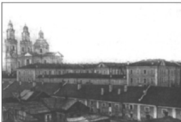
Jezuitski kolegij v Polocku