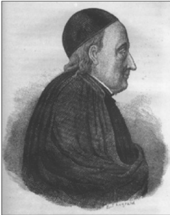
Gabrijel Gruber v profilu (Crétineau-Joly, 1845, 5: 462)

Kljub znanstvenim in tehničkim uspehom je položaj Gabrijela Gruberja in drugih nekdanjih jezuitov na ljubljanskem liceju postajal v letih pred izbruhom francoske revolucije vse bolj negotov. Zato je Gruber na skrivaj zapustil Ljubljano in sredi januarja 1785 odšel k jezuitom v Belorusijo. Služabniku je naročil, naj kuri v njegovi ljubljanski sobi, češ da bi se rad vrnil na toplo v tisti mrzli zimi. Možakar je dolgo kuril in kuril; dokler ga ni namesto gospodarjeve pohvale presenetilo pismo, da je Gruber odšel v Rusijo in da se ne vrne več v Ljubljano. Gruberjevo imovino so ocenili na 17.798 gld, jo prodali na dražbi in z izkupičkom poravnali dolgove, ki jih je zapustil v Ljubljani. 3