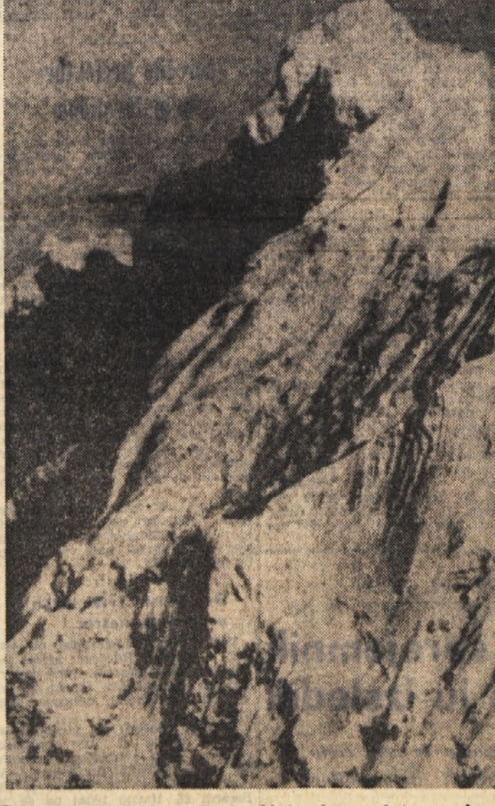
Takšna je himalajska velikanka Lhotse Šar na katero se bo povzpela slovenska alpinistična odprava. Pizalce bo pot vodila približno po meji med osvetljenim in zasenčenim delom strmine

(Nadaljevanje s 3. strani) govori širši okolici, je v tej izdaji moč najti še podatke o potniških agencijah, hotelih, trgovinah, restavracijah, avtomobilskih servisih, muzejih, gledališčih, umetniških galerijah itd.; v izdaji sedem dni v Beogradu, ki izhaja enkrat tedensko v treh jezikih, pa so tuju na razpolago vsi podatki iz zvezi z različnimi sportnimi in kulturnimi prireditvami v teku tedna, z natančno navedbo mesta in časa, nadalje v zvezi z restavracijami z domačimi specialitetami in narodno glasbo, zatem bari z radijskim programom za turiste ipd. Sprito gledališke «mrtno senone» je za tuje goste bilo poskrbljeno z vrsto drugih zanimivih prireditev. V Kolarevi in njeni bo nastopal ansambel narodnih plesov «Kolo» po prvič na teden vse do konca septembra. Godba na pihala ljudske milice in Jugoslovanske ljudske armade zavajata sprehatelce na Kalemegdanu z lahko, operno in zabavno glasbo vsako nedeljo ob 11. uri. Na stadionu Tašmajdan pa so skoraj vsakodnevno na programu kake večje športne in zabavne prireditve. V Domu mladine je trikrat tedensko ples. Številni beograjski muzeji pa nudijo tujim obiskovalcem vse možnosti, da si ogledajo njihove eksponate, nekateri organizirajo celo občasne razstave, kot na primer Muzej etnografije, muzej občasne razstave in umetnosti, Muzej uporabe in umetnosti in drugi. Strojarije vse, da bi se tujec v Beogradu ne dolgočasil.