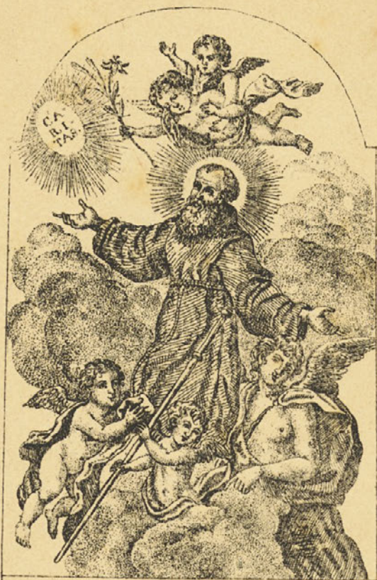
S. Franciscus de Paula