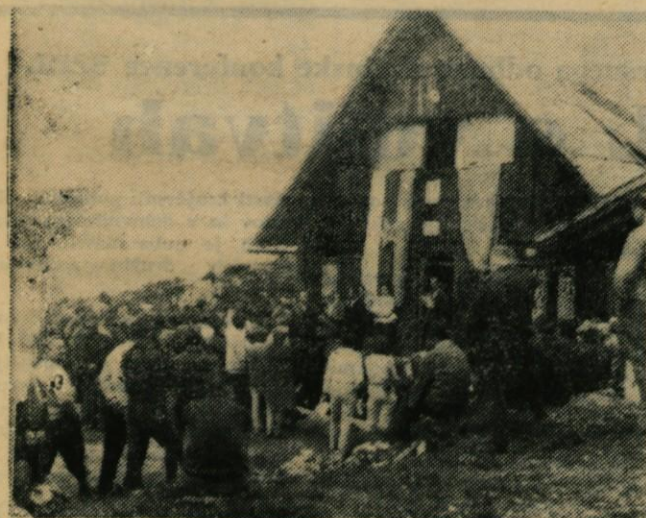
Slovesnost pred planinskim domom na Mali planini

V kratkih, lepo zbranih besedah sta nam tovariša Zore