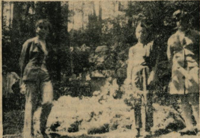
Tudi kamniški pionirji so položili šopek k spominski plošči