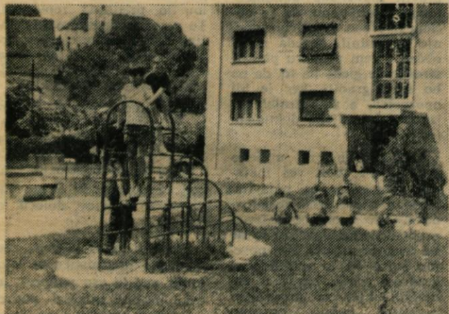
Potrebujemo več otroških igrišč. Najbolj pereče je v Zapricah, kjer 18 stanovanjskih blokov in oddelek otroškega vrtca nima niti najbolj preprostega peskovnika, kamor bi se številni otroci lahko umaknili prometu in asfaltu. Na sliki: otroško igrišče na Grabnu, ki so ga napravili s pomočjo podjetja Kamnik, je vedno dobro izkoriščeno.

V dijaškem domu je v varstvu povprečno 115 otrok, od tega s celodnevno oskrbo povprečno 30 otrok. S to zasledbo je izrabljena celodnevna zmogljivost tega doma in bi se povečala lahko le z dodatnimi investicijami. Dom je v letu 1968 na priporočilo TIS Kamnik organiziral dnevno varstvo šolskih otrok, ker je bilo varstvo za te otroke v otroškem vrtcu ukinjeno. Prostori so bili temu namenu primerno adaptirani. Se vedno pa ima dom težave z ogrevanjem prostorov.