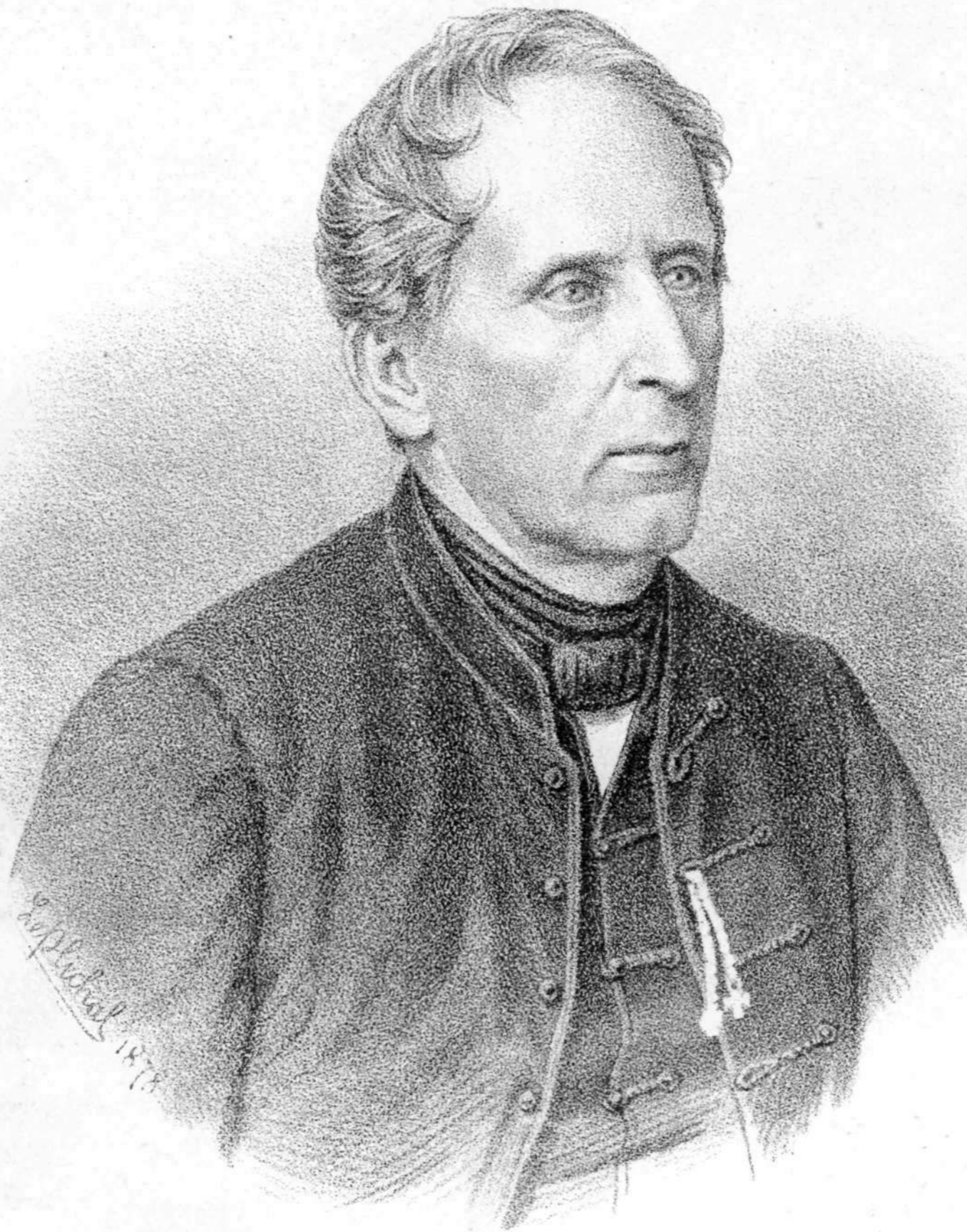
OČE DOR JANEZ BLEIWEIS O SEDEMDESETLETNICI SVOJI DNE 19. NOVEMBRA, LETA 1878.