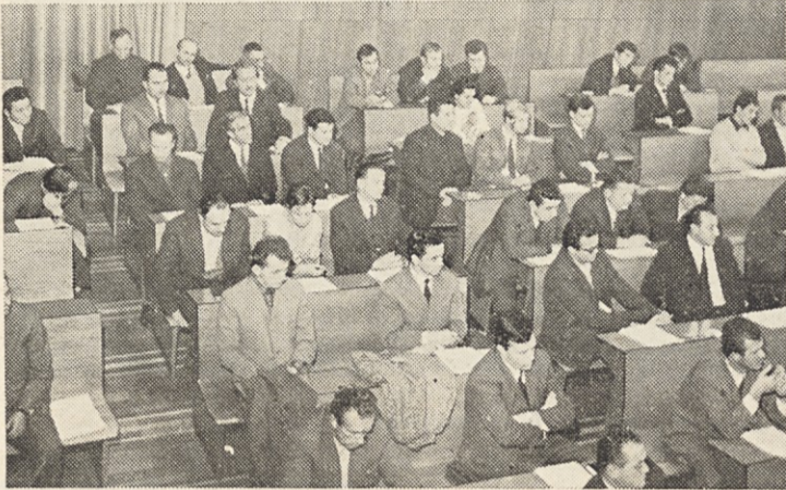
Udeleženci konference ZK