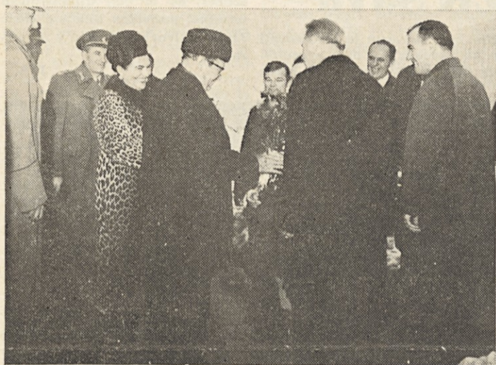
Ob prihodu prisrčen pozdrav

Ob zaključnem računu za leto 1969 naj vse strokovne službe podajo natančno poročilo, kako so izvršile sprejete ukrepe za izboljšanje likvidnosti.