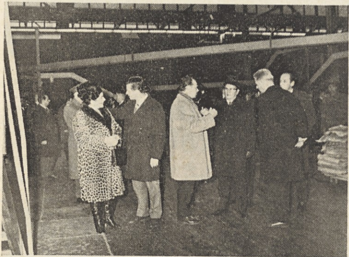
Ogled proizvodnih delovnih enot

Terjatve od kupcev smo v zadnjem času uspeli znižati s klirinško poravnavo, kar pomeni, da