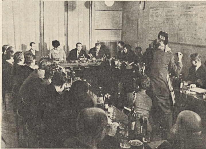
Tov. Tito se je dalj kot eno uro pogovarjal s Savčani

Po tem se je tov. Tito dalj časa zadržal v sejni sobi in se pogovarjal o razvoju tovarne, o problemih in načrtih.