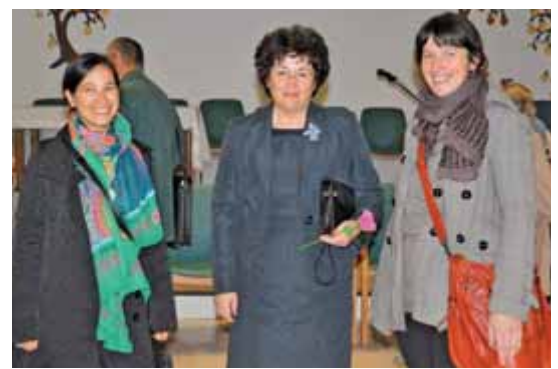
Voditelji skupine za samopomoč ZA-UPANJE s kamniško podžupanjo.

Vse več ljudi meni, da moramo stopiti skupaj in si izboriti prijaznejšo prihodnost. Vse več si nas prizadeva za ponovno vzpostavitev sistemov solidarnosti, za dostojno plačilo dela, za kaznovanje krivcev sedanjega stanja in za ponovno vzpostavitev etičnih vrednot v družbi. Širi se zavedanje, da so krizo povzročili najbolj bogati in jo izkoristili za ve-