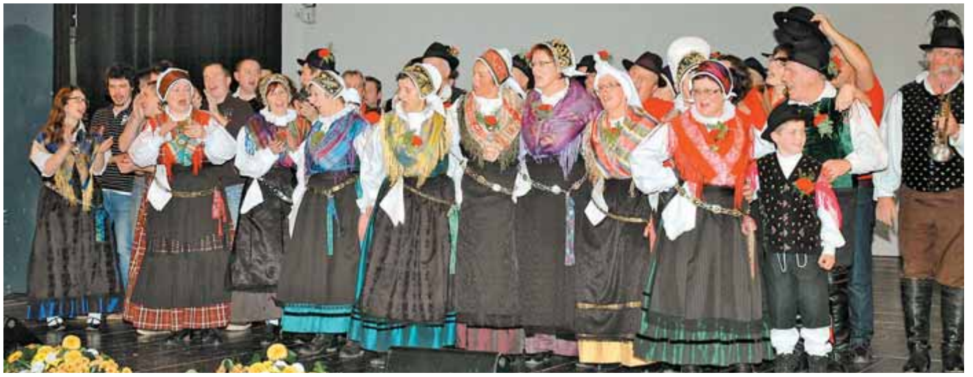
Folklor na Kamniškem deluje že 45 let, v lanskem letu so folkloristi krenili po samostojni poti Folklorne skupine Kamnik, pomladili in okrepili svoje vrste, ki zdaj štejejo že 40 članov.

V letošnjem letu je občina Kamnik izkazala poseben posluš za folklorno skupino. Z izrednim finančnim prispevkom je pripomogla k ureditvi prostora za shranjevanje oblek in opreme za delovanje. Folkloristi pa so pomagali s prostovoljnimi delom.