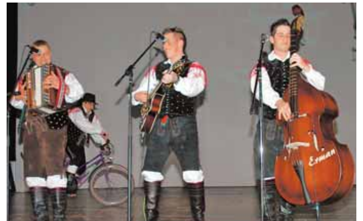
Domačini so nas navdušili z veselimi vižami.