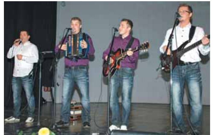
Glasbeno tradicijo ansambla bratov Poljanšek zagnano nadaljujejo tudi mladi Poljanški.