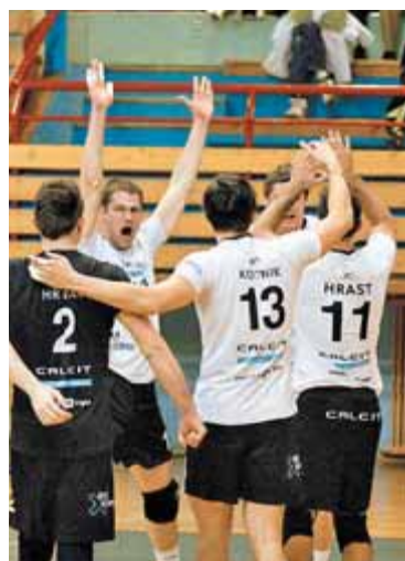
Kamniški odbojkarji po zmagi nad ekipo Jedinstva iz Brčkega v pokalu Challenge.

Če Kamničani ne bi igrali z ekipo Salonita, bi se veselili doslej samih zmag v letošnji sezoni. Toda že v drugem krogu 1. DOL so morali priznati premoč odbojkarjev Salonita, čeprav so igrali v domači dvorani, prav tako so prazen rok proti Kanalcem ostali v prejšnjem krogu domačega prvenstva. Z zmago je Salonit na prvenstveni lestvici prehitel odbojkarje Calcit Volleyballa, ki so na treh zaporednih gostovanjih trikrat zmagali. V Novi Gorici so bili s 3:2 boljši od Go Volleyja, v Novem mestu so s 3:1 premagali Krko in s 3:0 Šoštanj Topolšico. V pokalu Slovenije so se uvrstili na zaključni turnir, v pokalu Challenge pa so po zmagi v Brčkem na domačem igrišču Jedinstvo premagali s 3:2. V prvem krogu glavnega dela pokala Challenge Kamničane čakata tekmi z avstrijsko ekipo Amstetten, ki sodi v kategorijo premagljivih.