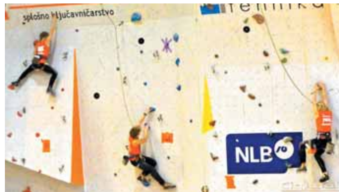
Kamničani, vsak v svoji tekmovalni smeri.