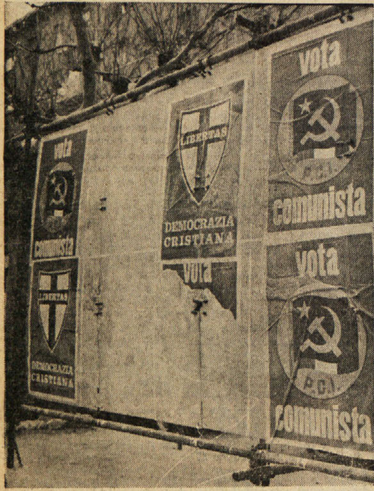
Prvi lepaki pričajo o vnemi največjih strank