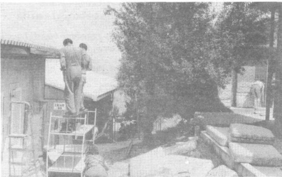
Delavca, ki sta nameščala nove žobove, sta se znašla – postelja na posteljo je lestev. Tovarišice iz vseh letošnjih izmen v Pacugu so prijelo v roke iztepeče in očistile jogi vzmetnice.