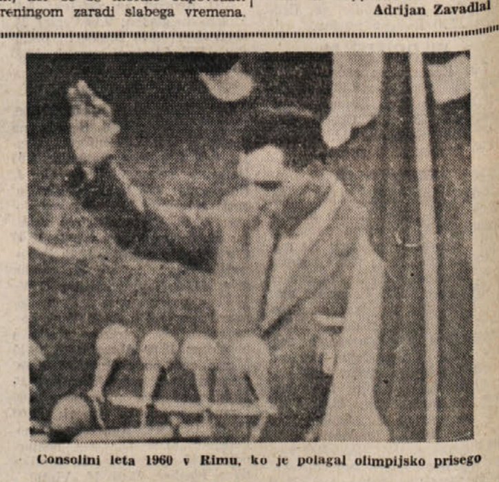
Consolini leta 1960 v Rimu, ko je polagal olimpijsko prisego

Prvenstvo naraščajnikov Bloch C-Polet 47:26 CALZA BLOCH «C» — POLET 47:26 (15:16) POLET: Irena Sosti 4, Vesa Tavčar 2, Rosana Sosti 3, Natasa Smotlak 5, Mira Kraus 12. SODNIK: Ciam (Trst). Po zadovoljivem prvem polčasu so naraščajniki Poleta povsem odpovedale v drugem delu igre in so tako morale prepustiti zmago Tržičankam. Openke niso bile v najboljši formi, ker so se morale odpovedati treningom zaradi slabega vremena.