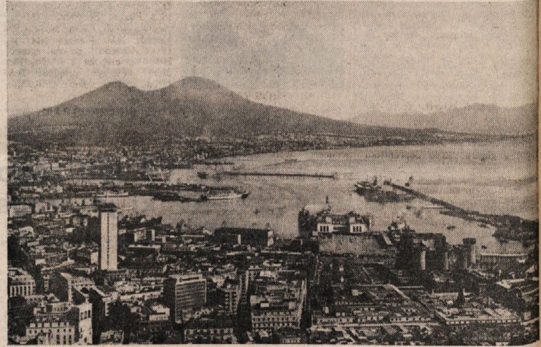
Panorama Neaplja z Vezuvom