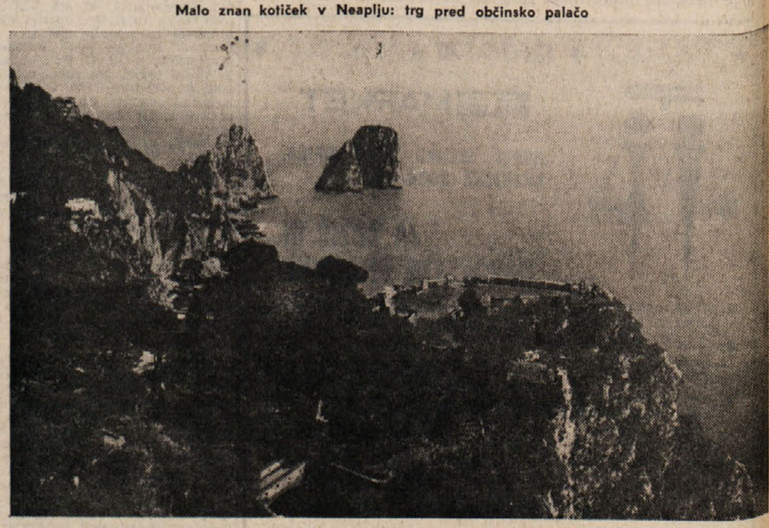
Capri: park «Augusto» in znameniti Faraglioni