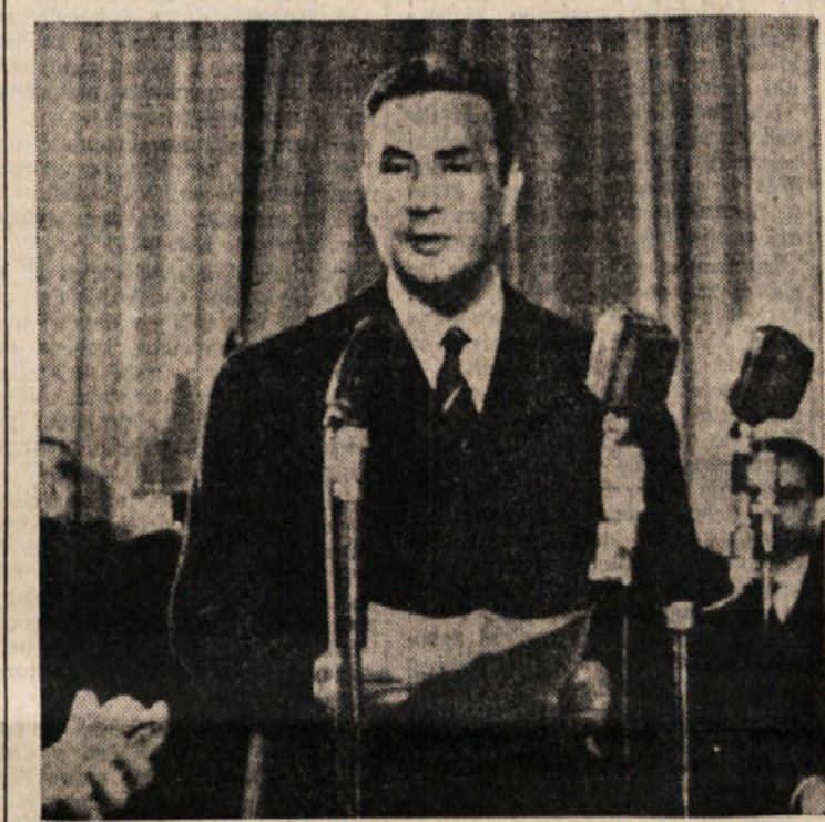
Zunanji minister Aldo Moro

4. Pravica pokrajine, da izkoristi policijske organe za informacije v zvezi z lastnim upravnim delovanjem, bo prisotna pri izdelavi zakonskih tekstov. 5. Če se zaradi ohranitve javnega reda sprejmejo ukrepi, ki se dotikajo ali sicer omejujejo ali začasno prekinjajo delovanje pooblastil na policijskem področju, ki jih je izdal predsednik pokrajinskega sveta, ali drugih od pokrajine sprejetih ukrepov na podlagi njenih pristojnosti, bo takšne ukrepe sprejela pristojna državna oblast po izrecnem mnenju predsednika pokrajinskega odbora, ki bo moral to svoje mnenje izreči v roku, ki ga določa zahteva.