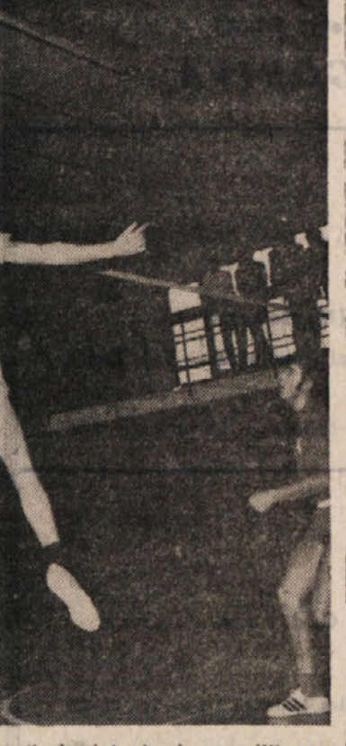
Bor — Polet: mladinci Bora v svoji skupini nimajo resnejših nasprotnikov