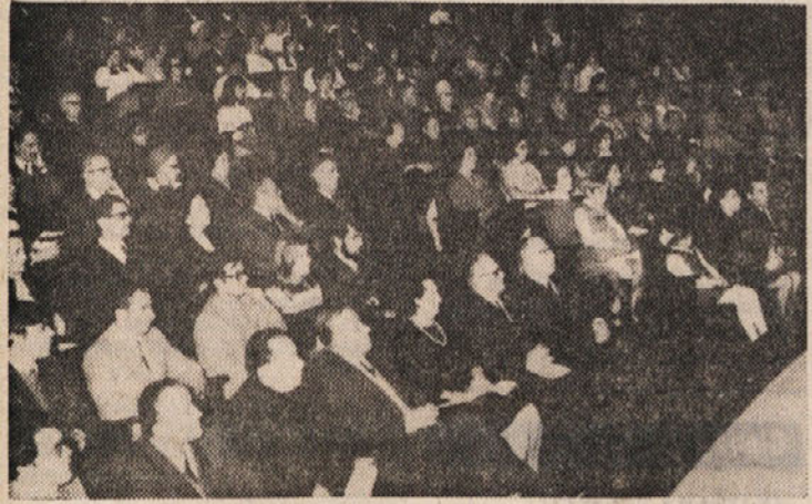
V nedeljo je bila v Kulturnem domu v Ulici Petronio dijaška prireditve v proslavo 25-letnice ponovne oživitve slovenske šole v Trstu in na Tržaškem, hkrati pa so dijaki proslavili tudi pomenovanje slovenskega liceja po našem velikem pesniku F. Prešernu. Mešani zbor liceja je v okviru slavnostnega programa zapel nekaj pesmi, dijaki pa so uprizorili Cankarjevega »Kralja na Betajnovi«. Prireditve je zvalila tolkova občinstva, da je napolnilo veliko dvorano KD.