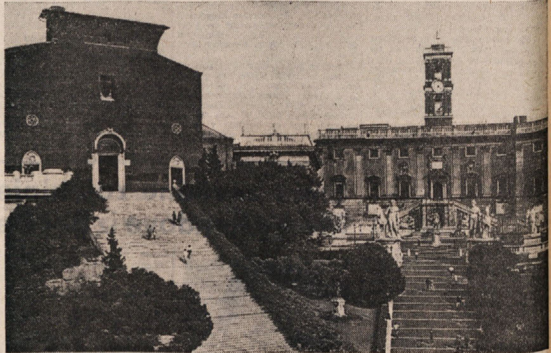
Stanišče Ara Coeli in Campidoglio v Rimu