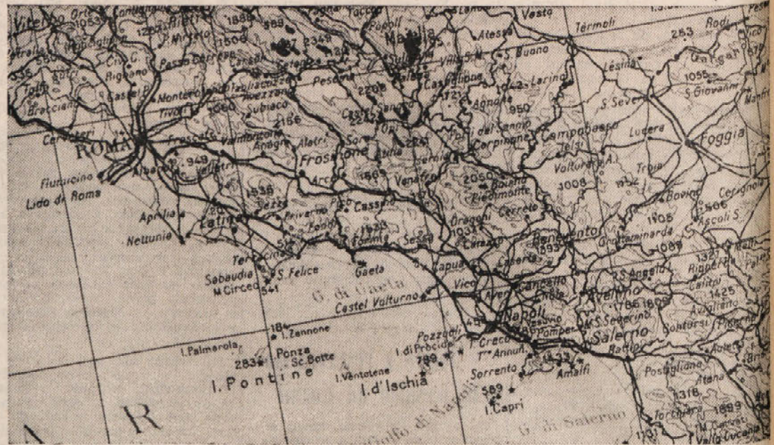
Področje, koder bo potekal naš izlet

In s tem bo našega potovanja konec. Prepričani smo, da bodo izletniki — tako kot na prejšnjih izletih — zadovoljni, saj bodo videli in spoznali nove kraje, nove ljudi, nove navade in način življenja, ki nam je sicer blizu, a vendar tako daleč.