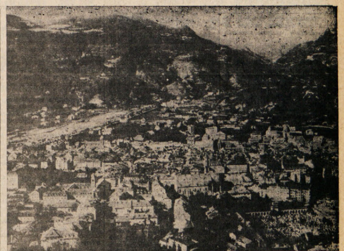
Bocen — Bolzano

9. Povračilo na podlagi odškodnine za planinske koč, ki so bile lastnina južnotirolskih odsekov «Alpenvereine», in čimprejšnje pravno priznanje «Südtiroler Alpenvereine». Slednje ne bo sicer moglo graditi planinskih koč v obmejnem pasu (vojaške služnosti). Drugi del ukrepa ne predstavlja diskriminacije proti «Südtiroler Alpenvereine», pač pa je splošnega pomena. Gre tudi pri izgradnji planinskih koč za uveljavitev zakona o večjih služnostih.