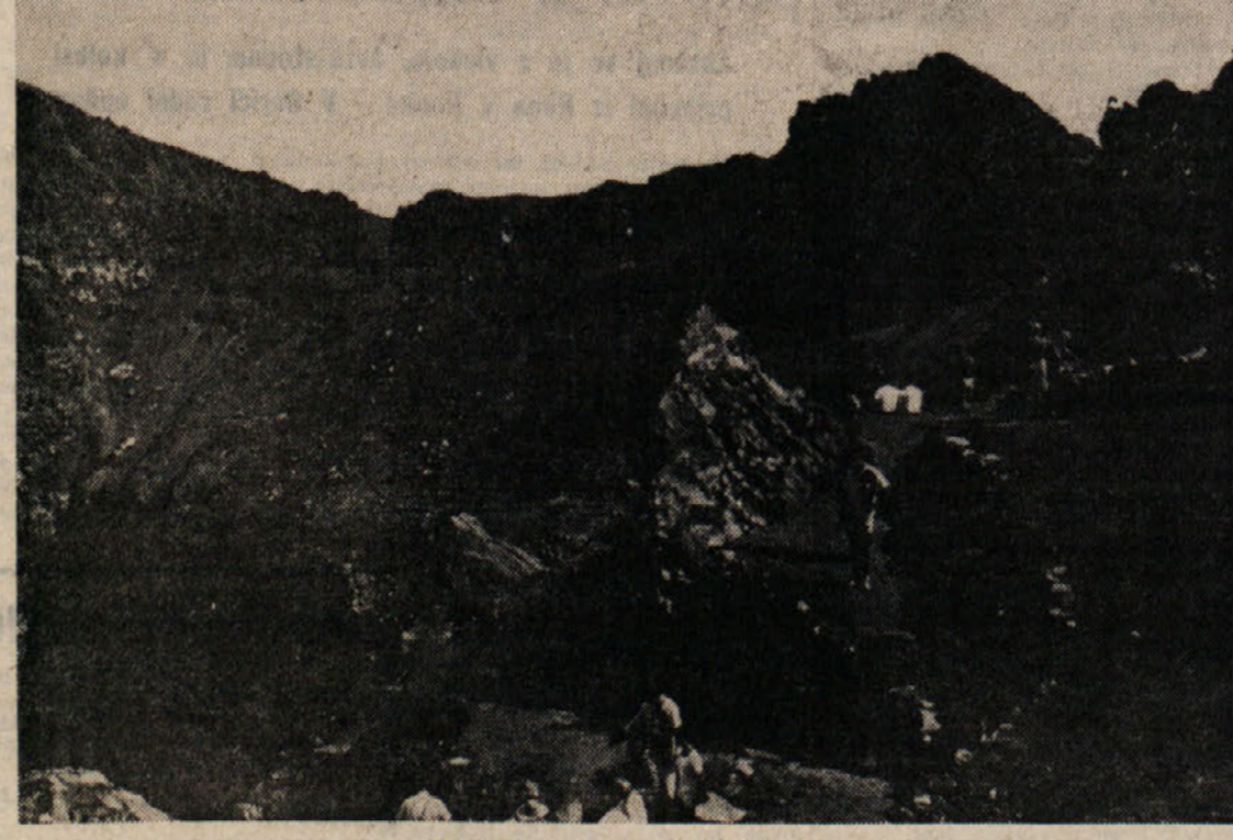
Neapelj: pogled v žrelo Vezuva