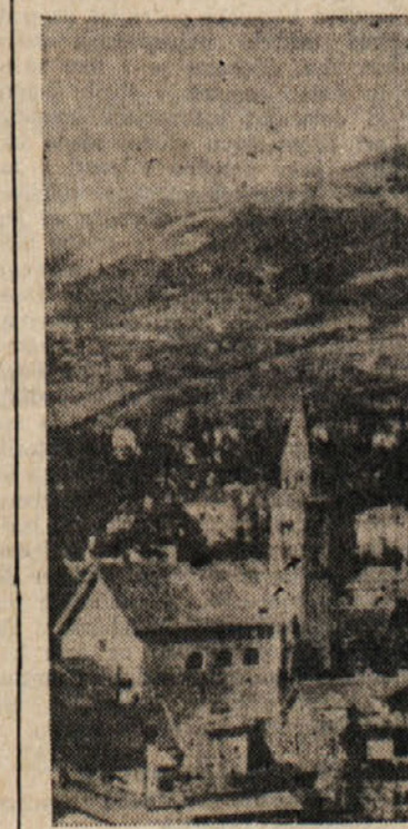
Meran — Merano

3. Uveljavilo se bo načelo, po katerem naj se skladu bocenske