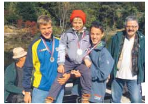
Zmagovalna trojka zadnje tekme – mladinci

Prvenstvo naj ribič se je končalo, zmagovalci pa smo vsi, ki smo tekmovali, saj nas povezuje stik z naravo, za katero tudi skrbimo po svojih najboljših zmožnostih. Tekmovalci so bili zadovoljni, saj nas prvenstvo bolj združuje pri naših prizadevanjih, lovu in prijateljstvu. Ne smem pozabiti tudi na našega tajnika, ki je bil na vseh tekmah tudi glavni kuhar in to zelo dober, ki je v šali odgovoril: "Seveda sem dober kuhar, saj ste vsi preživeli." Kljub hladnemu dnevu je druženje potekalo še v pozno popoldne.