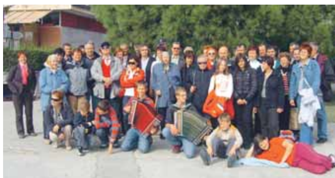
Krvodajalci napeto poslušajo razlago o solinah