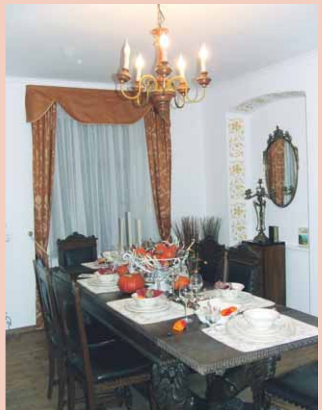
Prostor za posebne priložnosti