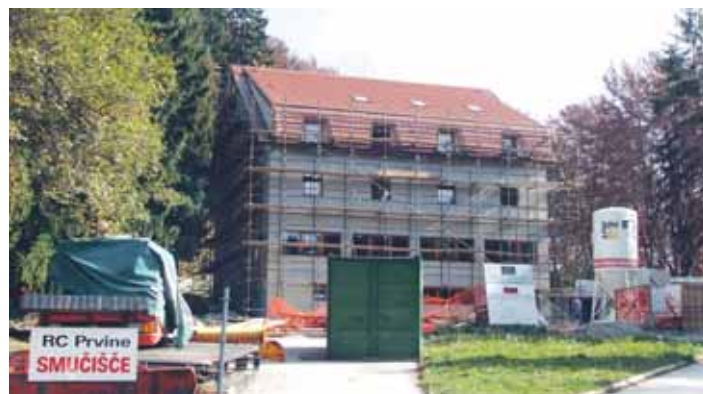
Čudovita narava, del katere je tudi DOM UTRIP

In še beseda o imenu doma: DOM pomeni Dobrodošla Oaza Miru, besedico UTRIP pa g. Zevnik razlaga takole: Urjenje Telesa, Razuma In Prijateljstva.