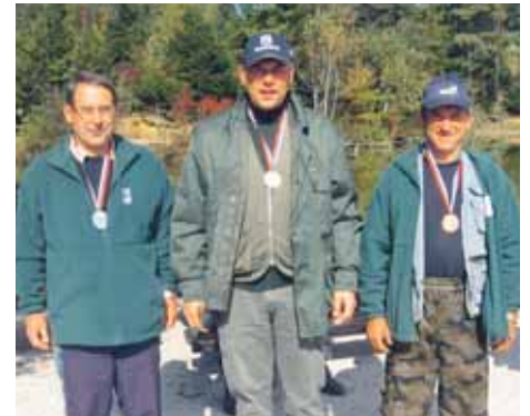
Zmagovalna trojka zadnje tekme – člani nad 18 let