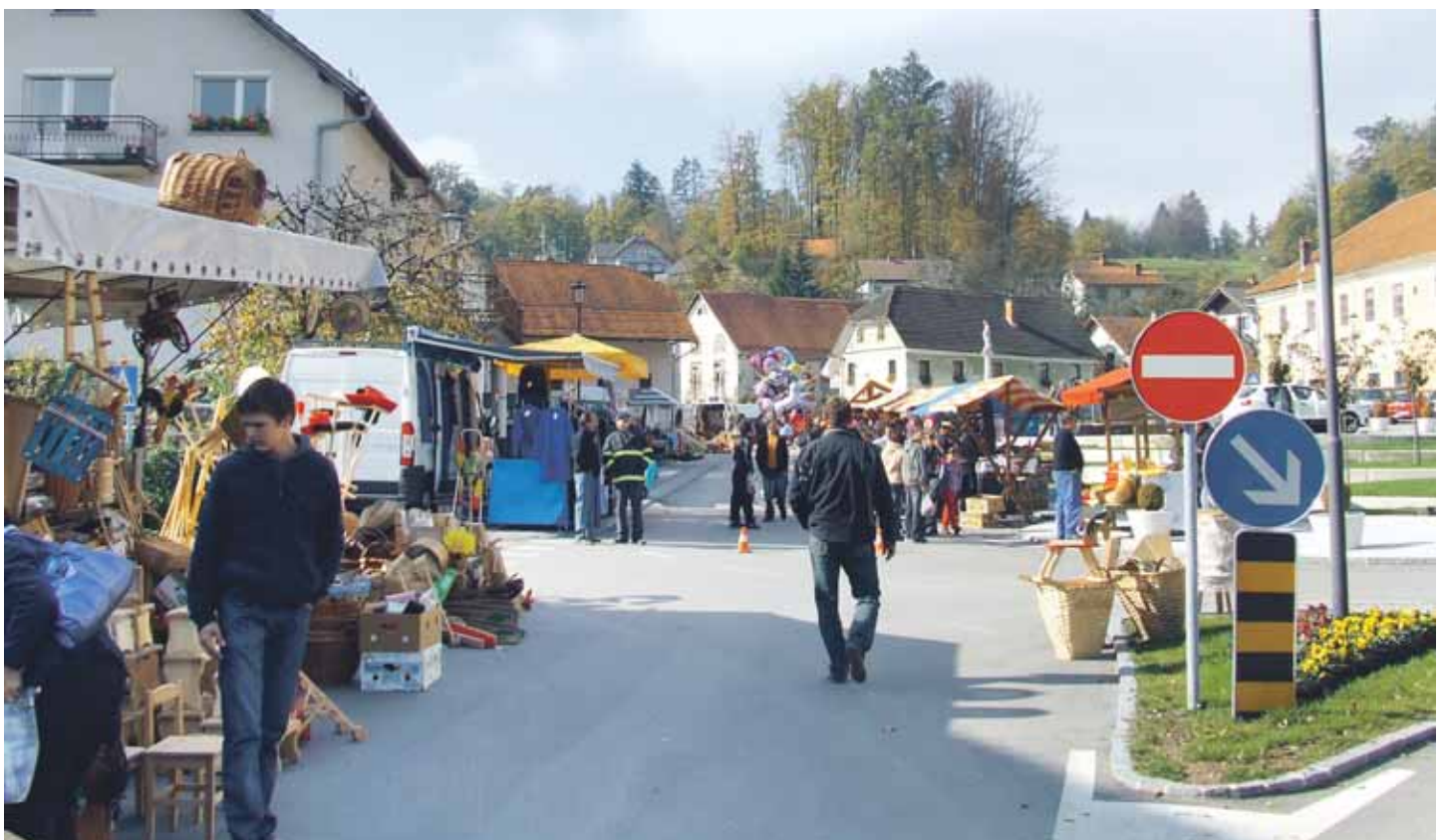
Lukov sejem 2008