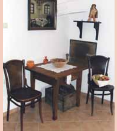
Muzejski del domačije

V razstavnem prostoru so trenutno razstavljena dela naših domačih, lukoviških slikarjev, v muzejskem delu pa so uredili kotiček, ki odseva način življenja na Lukoviškem v času rokovnjačev. Odslej bo moč dahnuti usodni »da« tudi v čudoviti poročni dvorani v občini Lukovica.