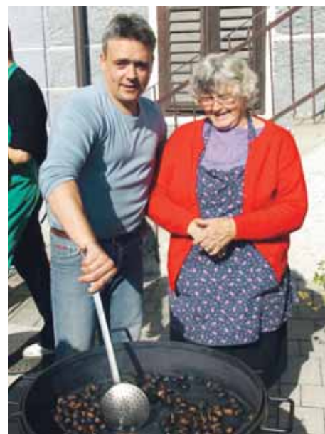
Pri Furmanu so pekli kostanj