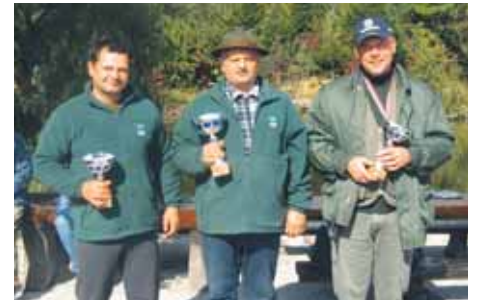
Prejemniki pokalov Naj ribič 2008 – člani nad 18 let