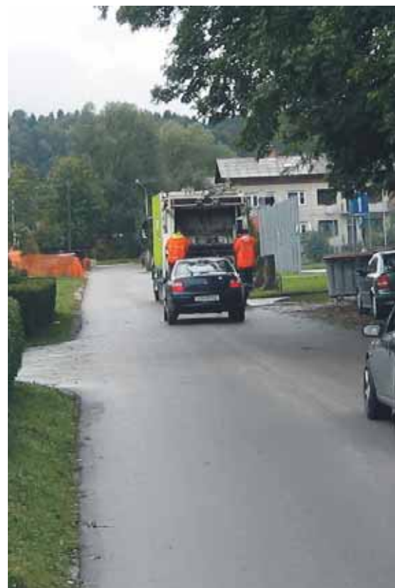
PRODNIK d.o.o. iz ekološkega otoka stresa vse na en tovornjak, ki pobira smeti!?

D) Napačno odložen odpadki lahko onesnaži ostale pravilno ločene surovine, ki tako postanejo neuporabne za nadaljnjo predelavo in jih je potrebno odložiti na odlagališču.