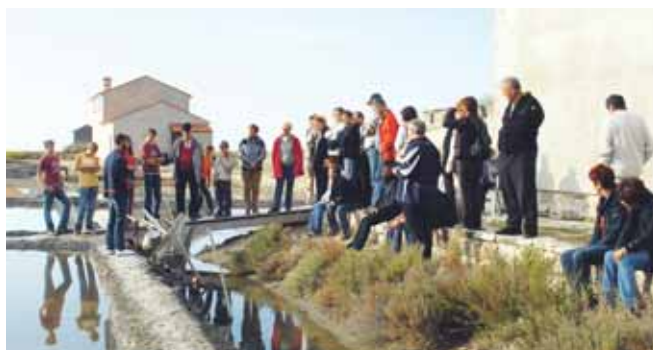
Udeleženci izleta pred obnovljenim hotelom Palace v Portorožu

Že v večernih urah smo se poslovili od tople in prijazne Primorske in se porazgovorili še v gostilni Rus ob obari in golažu ter tako zaključili bogat izlet, ki bo spodbuda še ostalim krajanom, da čim večkrat dajo svojo kri za reševanje življenj ljudem v boleznih ali nesreči. Zahvaljujemo se OZ RK Domžale in KS Rafolče za pomoč pri izvedbi izleta.