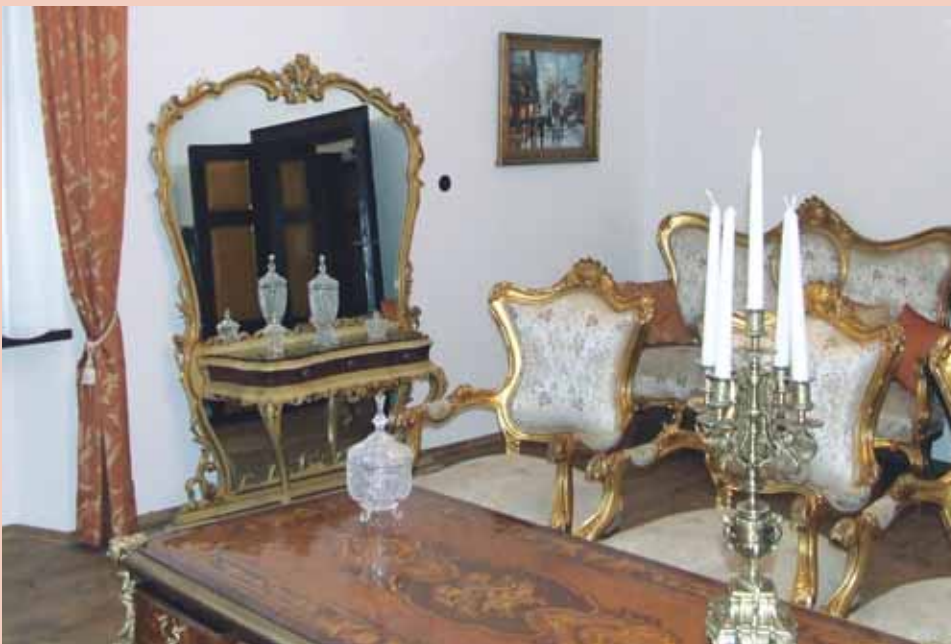
Romantična poročna dvorana