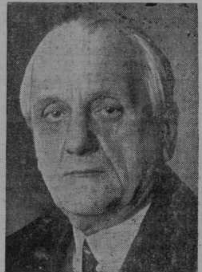
Mažarski zunanji minister Kanya igra važno vlogo pri pogajanjih Slovakov z Mažari zaradi razmejitve.

narodno skupščino. Z veseljem pričakujemo dan 11. decembra, ko bomo zopet svobodno izražali v javnosti svoje mnenje pred maloštevilnimi nasprotniki. Mi bomo volili listo JRZ, kakor smo spomladi pri občinskih volitvah. Zadnjo nedeljo, 9. oktobra, smo imeli na Razkrižju zopet sveto mašo. Čudimo se, da je tudi prišel od drugod organist z nekim zborom, ko vendar imamo doma organista in prav dober zbor. Štokavskih pesmi pa naši ljudje ne razumejo. Zato si lahko takšen zbor prihrani pot na Razkrižje.