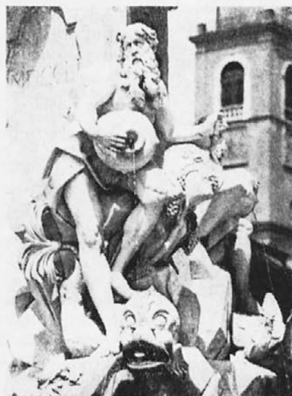
Robbov vodnjak v Ljubljani