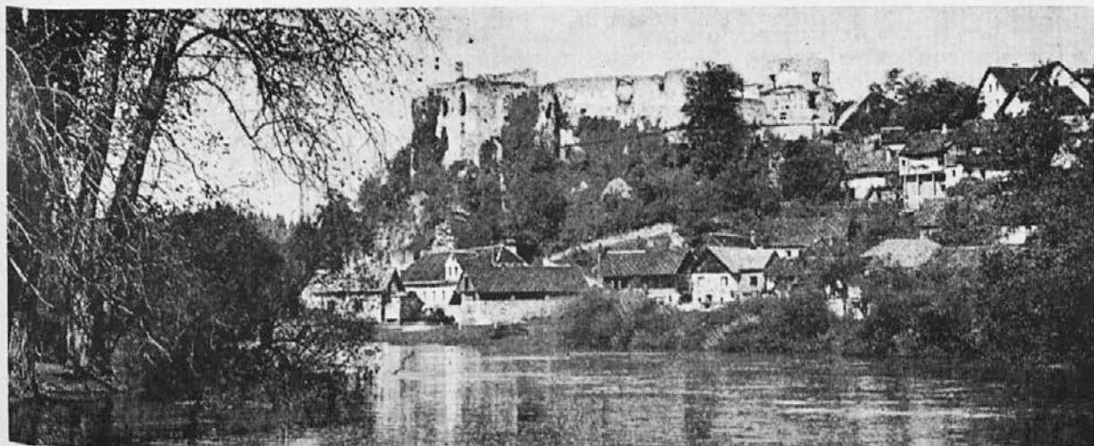
Žužemberk s porušnim graciom