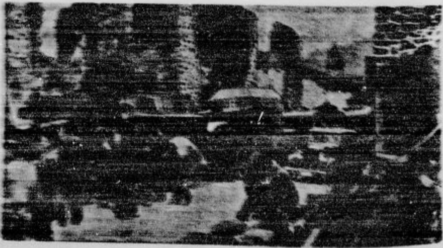
Posledice razlopija ... (Caption text is partially obscured and difficult to read, but seems to describe the scene in the image.)

Beloruske vojske se razlopija. Sprejeti urad splošne bolnišnice v Ljubljani je imel 13. aprila cel dan potne voke dela s sprejemanjem novih bolnikov. Ti so na hodnikih pred uradom stali v dolgi vrsti, tako kakor se včasih med svetovne vojne ljudje čakali pred prodalnica- mi in skladišč na kruh in sladkor. Vseh bolni- kov je bilo sprejetih 146! Okrog 15 bolnikov pa je bilo odklonjenih. Bolniška mizerija se nadaljuje. Vse postelje so zasedene in ni treba povabljati, da spe na tleh posteljat po tve in celo po hodnikih. Trsta je šaka oneniti, da pribija velike število bolnikov v oddaljenih krajih, ki imajo drugače v bližnjih mestih tudi dobre uredene bolnišnice. Pribusajo iz Stajarske in okolice Brežic in iz Dolžanske, kar bi se bol