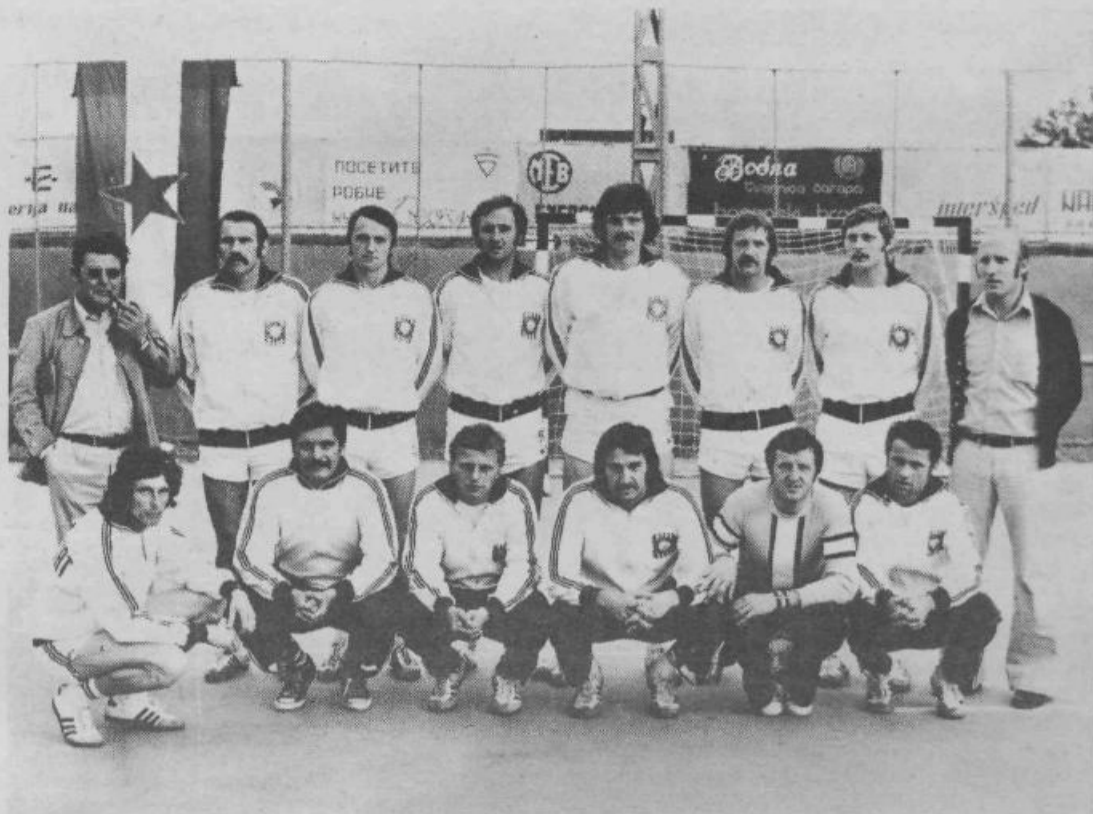
Rokometiški Slovana je naposled vendarle uspelo. Moštvo že vrsto let sodi v sam vrh slovenskega rokometu, zato jim je upravičeno mesto v družbi najboljših jugoslovanskih rokometiških ekip.

metašev, je uspel z mnogo bolj amaterskim (finančno in organizacijsko) lotevanjem stvari. Jasno pa je, da zvezni razred postavlja svoje zahteve, katerim se tako velik entuziazem igralcev in dveh, treh funkcionarjev verjetno ne bo kos. Prav zato so mnogi o sodelovanju v II. zvezni ligi močno različni. Mnenje treznih privrženec je, da ekipa letos še ni zrela za tako zahtevno tekmovalje. Želja igralcev pa je, in to brez dvoma zaslužijo, da sodelujejo. V tem primeru je naloga vseh družbenih dejavnikov, da kadrovske in finančne zagotove ekipi ustrezne možnosti.