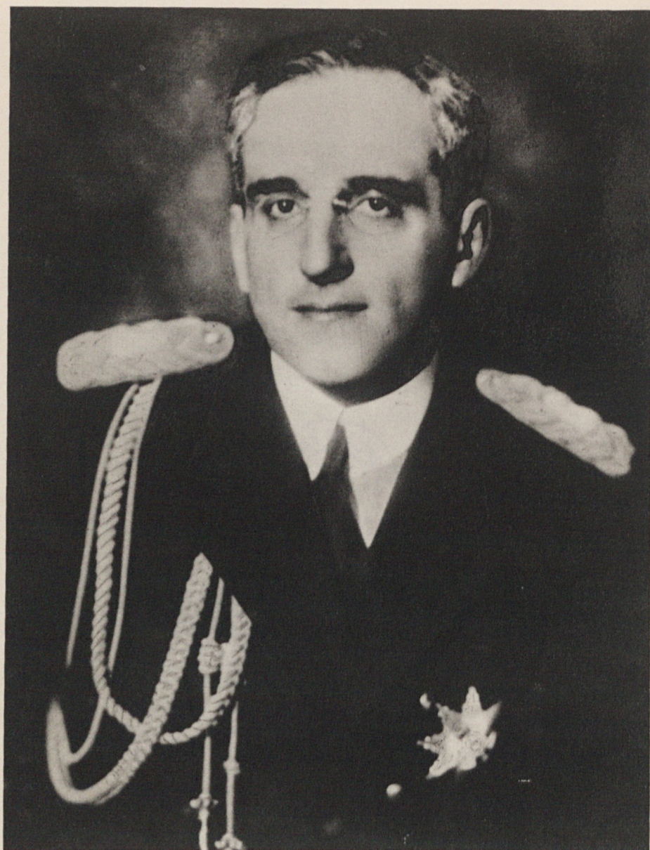
† Viteški kralj Aleksander I. Zedinitelj