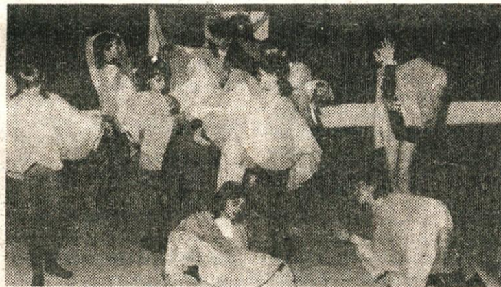
Mladi igralci v »Dežku«

nastopi na raznih srečanjih in novoletni obiski po krajevnih skupnostih. In ravno ta obsežen program je včasih utrudljiv za skupino, saj pravi namen delovanja krožka ni le predstavitveni program. Cilj gledališke vzgoje je v kulturnem smislu širši.