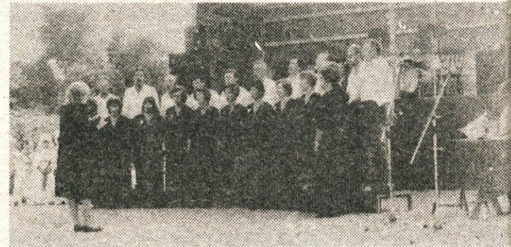
Mešani pevski zbor

Sicer pa pravi, da je uspeh na tekmovanju odvisen od vremenskih pogojev, ki nekemu ustrezajo, drugemu pač ne, do počutja in razpoloženja. »Pogrešam tekmovanje, čeprav je vedno tekmojem v Likovi ekipi na občinskem sindikalnem prvenstvu. Treniram praktično nič. Le kaj? za tekmo, kjer sem dobil bronasto kolajno, sem »spustil« le nekaj nad petdeset strelcov. To pa je premalo. Upam pa, da bodo z mladimi prišli tudi boljši pogoji za ta lep šport.«