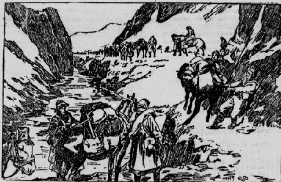
Sestre angleškega Rdečega križa in njih težave ob umikanju iz Srbije.

Srčne pozdrave Vam, domačim in vsem prijateljem »Domoljuba«.