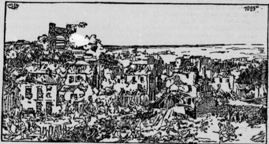
Boji pri Loosu.

Italijansko vojno poročilo. Čujmo, kako obveščajo svoje ljudi italijanski vojni poročevalci: Rim, 9. februarja: Na Tridentinskem in v Karniji je delovalo topništva in naši poizvedovalni oddelki kakor navadno. S cele bojne črte ob Soči se poro-