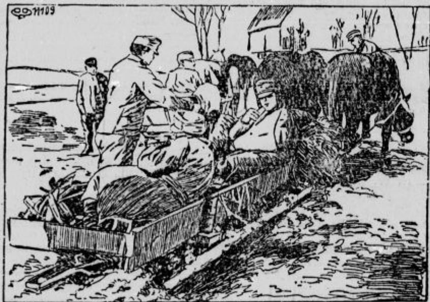
Avstrijski vojaki prevažajo ranjence.

Preljubi moji domačini! Preljubi moji starši, brat, sestre, sorodniki in prijatelji! Prišel je konečno čas, ko moram odriniti na krvavo bojišče. Bojna tromba nas kliče slovenske junake-vojake braniti očetnjava, ki je v nevarnosti pred kletimi sovragi. Ni še prelito zadosti krvi, ne počiva še zadosti junakov na bojnih poljanah; še je treba novih žrtev za domovino. Tudi mi moramo junško prijeti za puško in meč in iti med bojni grom. Mi topničarji hočemo in moramo maščevati padle brate vojake in iztrgati našo zemljo iz nenasitnih rok sovražnikovih. Zastaviti moramo življenje in kri za sivolasega vladarja ter položiti novo žrtev na oltar ljube domovine. V tem svečanem trenutku se moram posloviti od Vas, preljubi moji starši in domači vsi. Morda je to zadnje slovo! Z Bo-