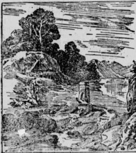
Kje je iskalec zlata?