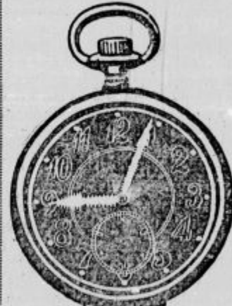
Lastna znamka "IKO" najboljši zanesljiva ura.

tako se stiši mnogokrat popraševati ljudi, kateri pač imajo uro v žepu ali na steni, ampak svoji lastni uri ne verjamejo, ker je le slaba, netočna, vedno stoječa bazar ura. Kdor nasprotno ima Suttnerjevo uro, ve vedno natanko, kako pozno je.