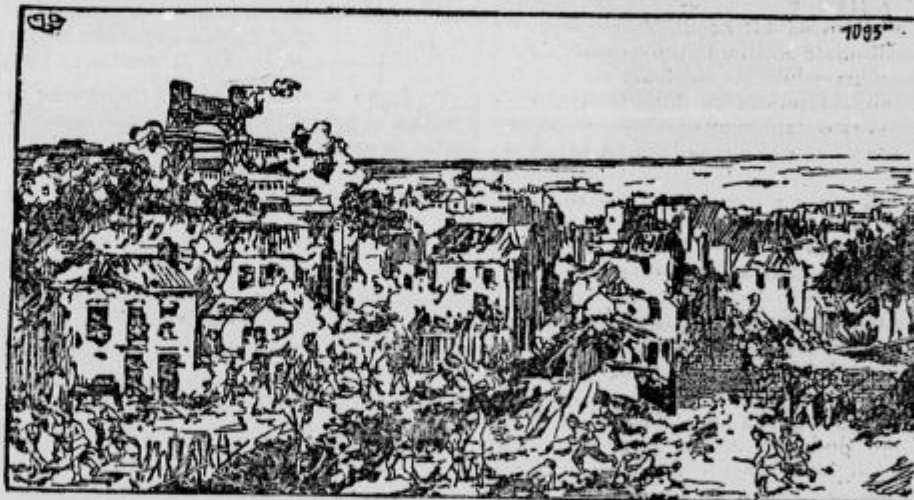
Boji pri Loosu.

Zavezniki od Italije odločno zahtevajo, da bi morala sodelovati tudi na bojiščih izven Italije — pri Valoni ali pa Solunu. Italijani se pa boje, da bi naše čete prodrle