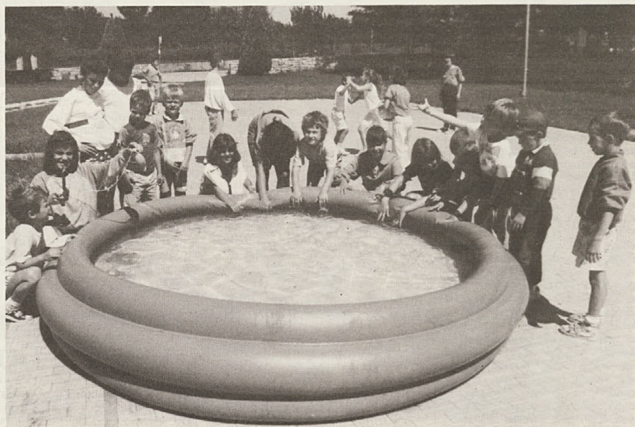
■ Skupina najmlajših v poletnem centru v Zgoniku.