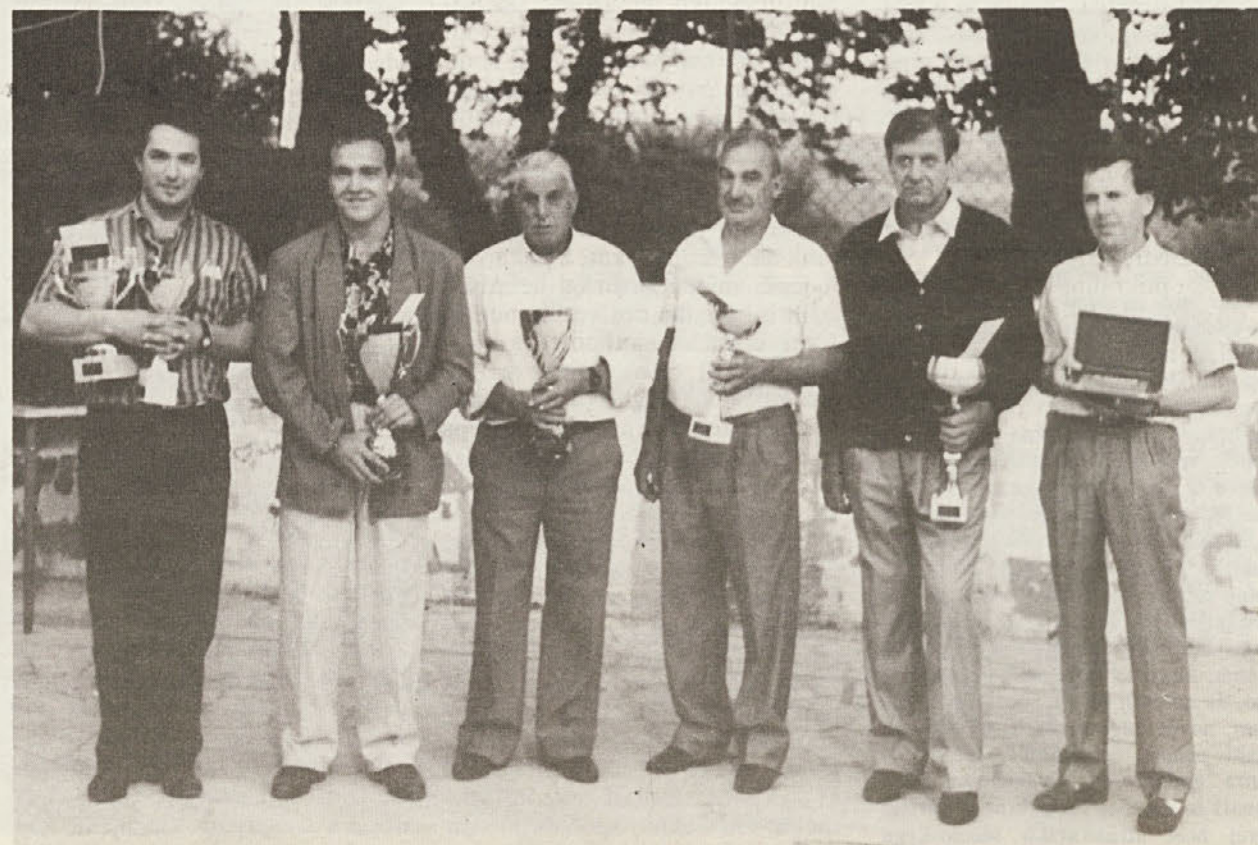
■ Nagrajeni vinogradniki na razstavi vin v Nabrežini.

V dneh 28. 29. in 30. julija bo v Zgoniku festival