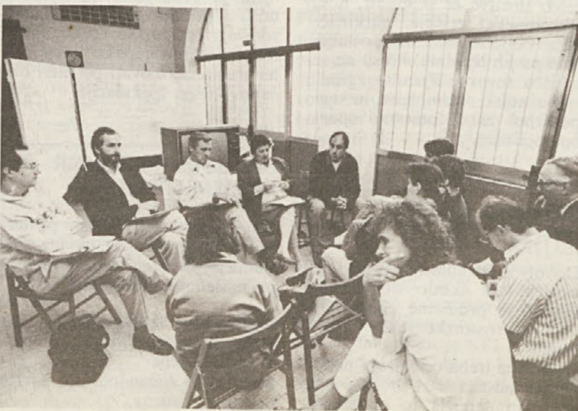
■ ZKMI in zveza za okolje sta na Opčinah organizirali praznik »Naj živi Kras«.

Festival tiska bo v soboto in nedeljo zvečer nadaljeval s plesom ob zvokih ansambla Furlan. V nedeljo popoldne bo na sporedu še kulturni program.