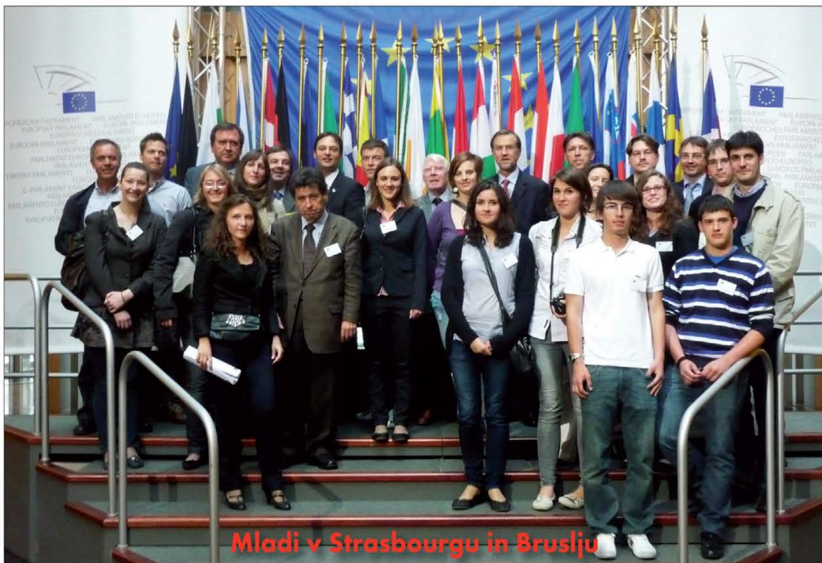
Mladi v Strasbourgu in Bruslju

Če poskušamo sedaj po prvem krogu in pred balotazami povleči pod volilnimi izidi črto in seštetiti rezultate, je izkupiček za našo stranko in za Slovence nasploh pozitiven. Ob pogledu na lep rezultat zlasti na Goriškem pa se seveda vsiljuje vprašanje, kako močni bi bili in kakšne rezultate bi Slovenci lahko dosegali, če bi bili skupaj, vsi združeni v samostojni zbirni stranki, ki ni nujno, da se imenuje SSK. Za nas je pomembno, da smo skupaj! Ta perspektiva je glede naslednjih občinskih volitev v Gorici izjemno zanimiva za slovenske volilce, saj so množično podprli skupno listo SSK-Demokratska stranka. Nekaj skupnih volilnih potez treh slovenskih kandidatov na tej listi pa je naša javnost sprejela z velikanskim odobravanjem in naklonjenostjo, morda celo z olajšanjem, kar nalaga vsem, tudi organizacijam civilne družbe, da skupaj na novo premislimo oblike politične organiziranosti slovenske manjšine v Italiji, ki je žal, kot sem že večkrat zapisal, stara že najmanj 60 let in se ni dosti spremenila vse od konca vojne dalje. Ne moremo več nadaljevati po poti ločevanja na "bele" in "rdeče", napredne in demokrate ali kakorkoli že, saj se je svet okrog nas krepko spremenil, politična slika v Italiji in Sloveniji tudi, zato tudi naj pride iz teh volilnih rezultatov spodbuda, da na tem področju tudi sami, doma, kaj novega in koristnega naredimo. Za vse nas!