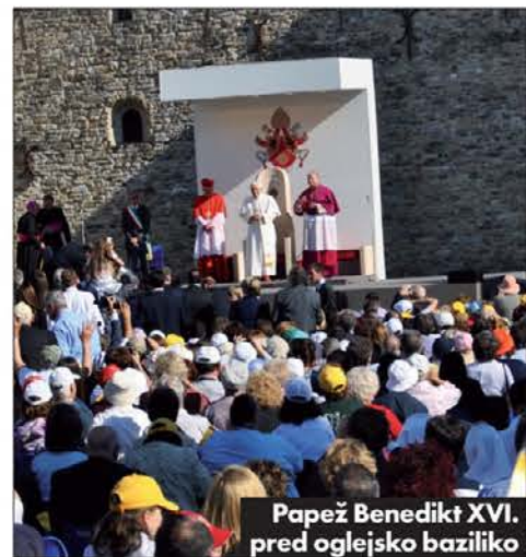
Papež Benedikt XVI. pred oglejsko baziliko

re, južna Koroška do Drave, Kranjska, Južna Štajerska in Japidijska (primorski Kras). Patriarhat je vsa ta območja stoletja upravljal prek svojih namestnikov (arhidiakonov). Edino novost je v tem pogledu predstavljala ustanovitev ljubljanske škofije leta 1463, in sicer v mejah istoimenske župnije. Sedeži arhidiakonov na Slovenskem so bili v Kamniku, Celju, Novem mestu, Ribnici in v Devinu. Na ozemlju oglejske škofije oz. patriarhata so tako živeli Furlani, Italijani iz Veneta, avstrijski Nemci