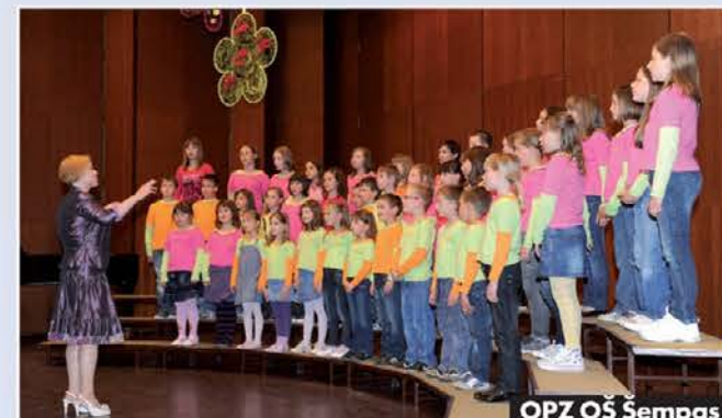
OPZ OŠ Šempas

V Kulturnem domu v Novi Gorici se je v četrtek, 12. maja 2011, ob slavnostni razglasitvi zmagovalcev končalo 5. tekmovanje otroških in mladinskih pevskih zborov, ki ga prireja Zveza pevskih zborov Primorske in Javni sklad Republike Slovenije Območne izpostave Nova Gorica. Na njem je sodelovalo štirinajst