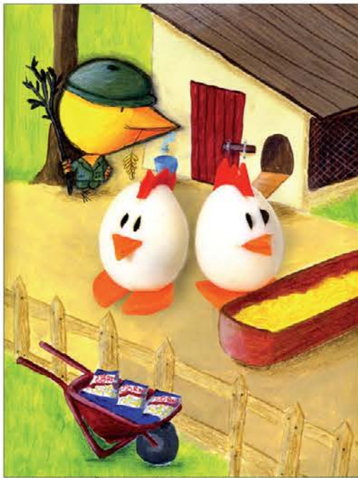
Kokoške kuharja Škrobka iz trdokuhanih jajc, ilustrirala Chiara Sepin

he v aprilski Galebovi likovni delavnici predstavlja Jasna Merku'. Velikonočni zajčki vabijo otroke k rešitvi didaktične naloge Anje Kokalj v nežni ilustraciji Daše