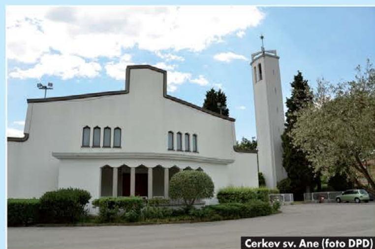
Cerkev sv. Ane

Svoj razmah je naselje doseglo zlasti v '70. letih, ko so tu začeli zidati večstanovanjske hiše. Danes na-