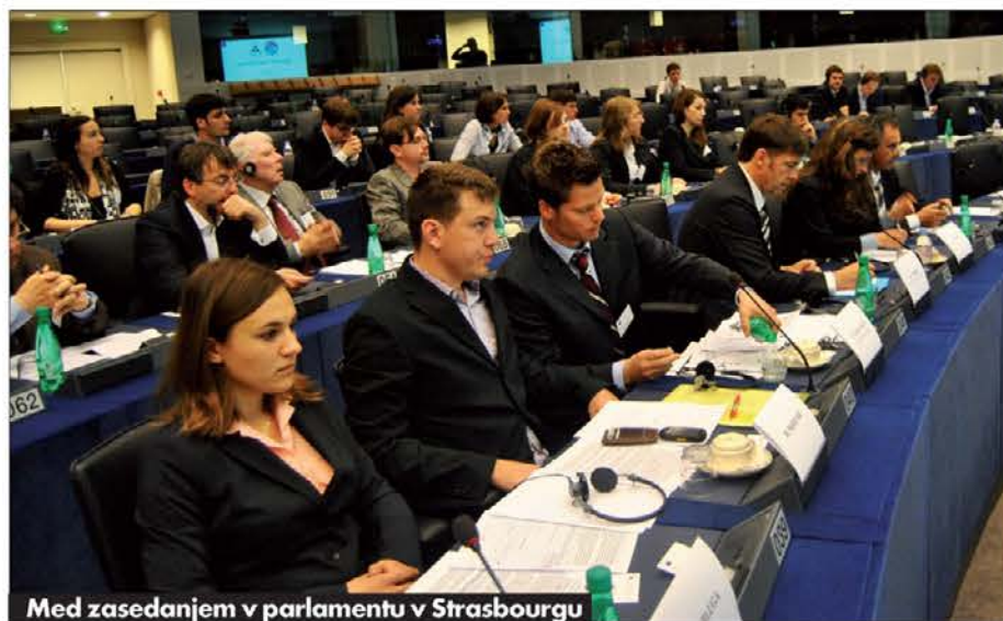
Med zasédanjem v parlamentu v Strasbourg