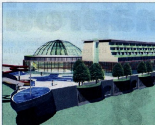
Thermales Laško, kakršno bodo videti po zaključku 56 milijonov evrov vredne naložbe.