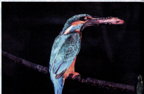
Vodomec je evropsko pomembna vrsta. Za njegov obstoj so pomembne tudi slovenske reke.

V Sloveniji je ministrstvo za okolje in prostor v program Nature 2000 vključilo kar 38 odstotkov vsakega državljankega ozemlja. Pred trem leti dni je uredbo o posebnih varstvenih območjih Nature 2000 in o ekološko pomembnih območjih kljub številnim protestom iz slovenskih občin sprejela tudi vlada. Združenje slovenskih občin (ZOS) se v protestu sklicuje na zakon o lokalni samoupravi in