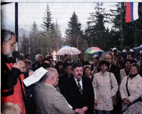
Na srečanju v Savinjski dolini je bila osrednja evropska prireditelj najprej v Solčavi, kjer so v znak prijateljstva med občanov in politikov Zgornje Savinjske in Saleške doline ter avstrijske Koroške, po maši v cerkvi sv. Duha v Podotševi pa so druženje sosedov sklenili na Pavličevem sedlu. (Franjo Atelšek)