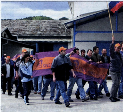
Ob zaključku enomesečne stavke v Cometu je večina stavkajočih obhodila »častni krog« okoli podjetja.

Proizvodnja v ržeškem Cometu, kjer je okrog 170 delavcev, članov sindikata Neodvisnost, stakvalo en mesec, je bila v ponedeljek vseh enotah spet normalna. Vodstvo podjetja je takoj začelo neposredno sprejemati ukrepe za ublažitev posledic stavke. Delo skujejo organizirati tako, da bi lahko izpolnili čim več naročil, s kupci pa se dogovarja za podaljšanje nekaterih dobavnih rokov. V Cometu podatkov o tem, koliko znesla škoda zaradi stavke, še nimajo, je pa že zdaj jasno, da številka ne bo nizka. Že neposredna gospodarska škoda, nastala zaradi upisne škoda izpada proizvodnje, znaša okoli 100 milijon tolarjev. Kakšne bodo dolgoročne posledice na trgu in tolikšna bo cena omajnega nagleda podjetja, pa za zdaj še nihče ne upa oceniti.