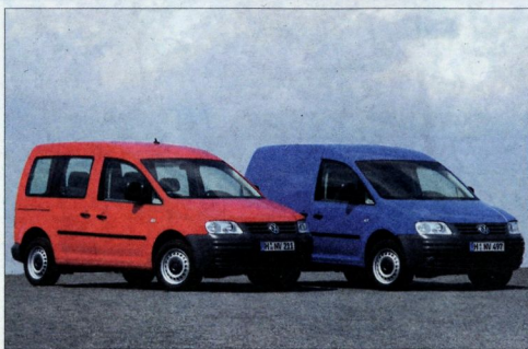
Letos naj bi v Sloveniji prodali vsaj 400 novih caddyjev, pri čemer bo najcenejši na voljo za 2,94, najdražji pa za 4,29 milijona evrov.

Novi (ali prenovljeni) caddy je precej večji in lahko predvsem zaradi kolotnih zavora na vseh kolesih vleče priloško s skupno maso do 1.500 kilogramov. Po novem ponujajo kar štiri izvedenke; dva furgona (dva se deža, brez zadnjih stranskih steklenih oken) in furgon s podaljšano kabino, pri čemer ima tri sedeževe. Nosilnost je 750 kilogramov, kar je prav prijeten številka, zelo uporabna in koristna pa je tudi prostornina v zadnjem delu. Obe izvedenici sta homologirani kot tovarno vozilo in serijsko opremljeni le z enim bočnim državnimi vrati, medtem ko je treba za druga doplačati. Ponujajo tudi potniško varianto, ki ima nekaj manjšo nosilnost (600 kilogramov) in seveda zastekljena okna.