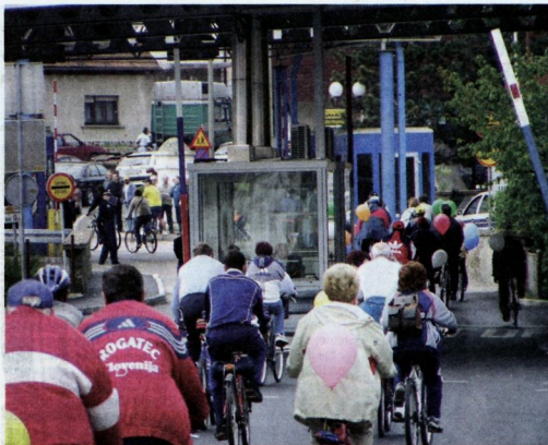
Prehod Slovenije v Evropo pomeni za prebivalce ob hrvaški meji novo ločnico, saj bo tukaj potekala zunanja meja EU. V Rogatecu so zato pripravili kolesarjenje s prijatelji z druge strani meje po obeh bregovih Sotle. Zbralo se je 180 kolesarjev iz bližnje in daljne okolice. (JB)