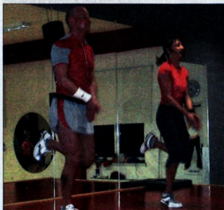
Utrinek s prvega dneva Les Millsov programov

Body Combat je priporočljiv za vse, ne glede na starost