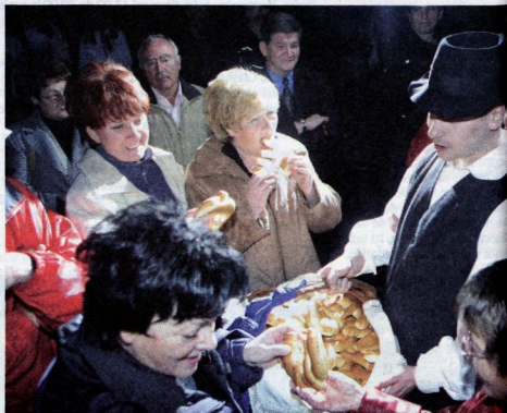
Celjski folkloristi niso samo imenitno odplesali spleta ljudskih plesov, med zbrane so iz pletenih košar delili tudi kruhke, domiselno oblikovane v podobo evra.