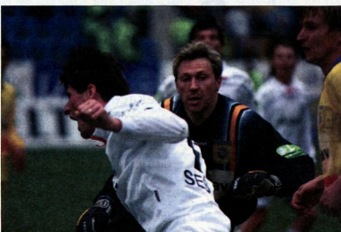
Publikiem je nazadnje točko osvojil z Domžalcami, večeraj pa v Dravogradu trener Jani Zavri ni mogel računati na šest svojih nogometašev.

JASMINA ZOHAR DEAN ŠUSTER