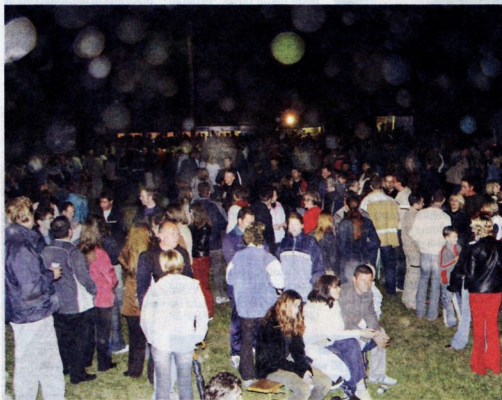
Kresovanje na Špici je bila gotovo ena najbolj obiskanih predprvomajskih celjskih praznov. Čoprav je ves čas rosilo. Očitno so Celjanom dovolj gostinska ponudba, velik kres in možnost druženja.