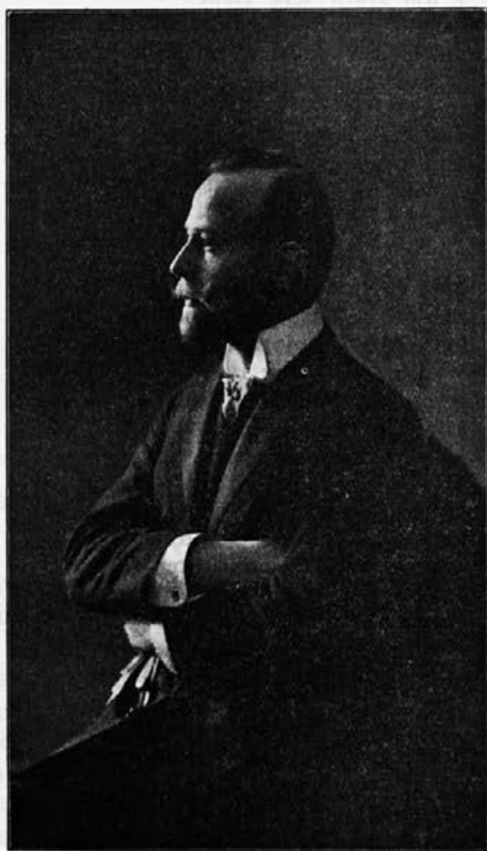
Univ. prof. dr. Ivan Žolger edini slovenski minister v bivši Avstriji in eden naših najboljših pravniških strokov- njakov, je letos umrl.