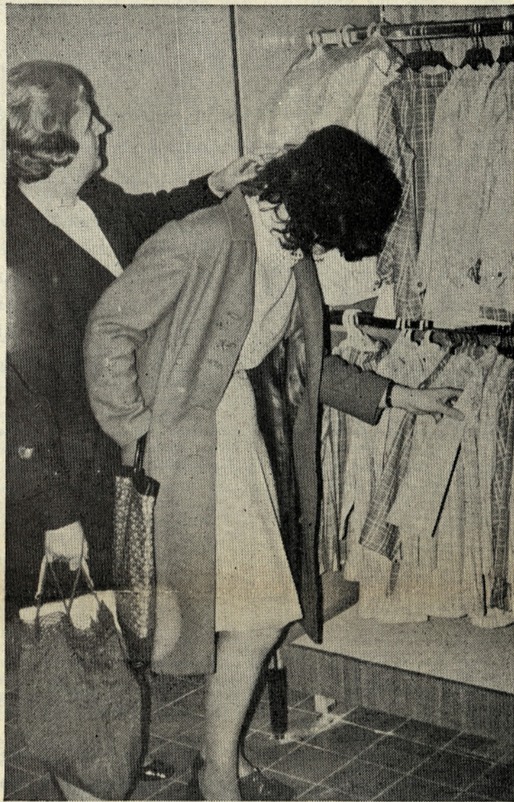
V prodajalni »Triglav« konfekcije

Člen 33: Ugotavljanje obveznosti po zakonu je formulirano precej nedoločeno! Z obdavčenjem dohodka TOZD, se ne bi smelo zagotavljati tudi drugih stvari, ki so v tem členu omenjene! Potrebno bi bilo, da se s samoupravnim sporazumom zagotovi kritje določenih potreb delavcev v združenem delu (t. j. zdravstva, šolstva, kulture i sl.) s tem, da se konkretno določi obseg, vrsta in kvaliteta ter cena teh storitev, v ustreznih družbenih dejavnostih! Ne pa da se pri reševanju teh vprašanj uporablja princip obdavčenja TOZD s strani družbenopolitičnih skupnosti.