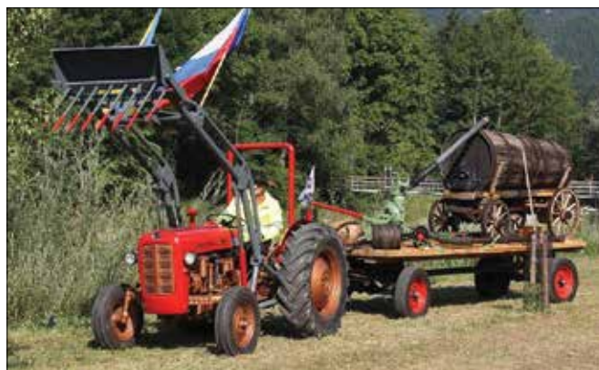
Najlepše urejeni traktor iz leta 1957 s stoletnim sodom

V šotoru na ciljnem prostoru so bila na ogled vozila znamke BMW – tako starodobna motorna kolesa in avtomobili, ki jih premorejo člani društva, kakor tudi najnovejši modeli bavarskega avtomobilskega velikana, za katere so poskrbeli v