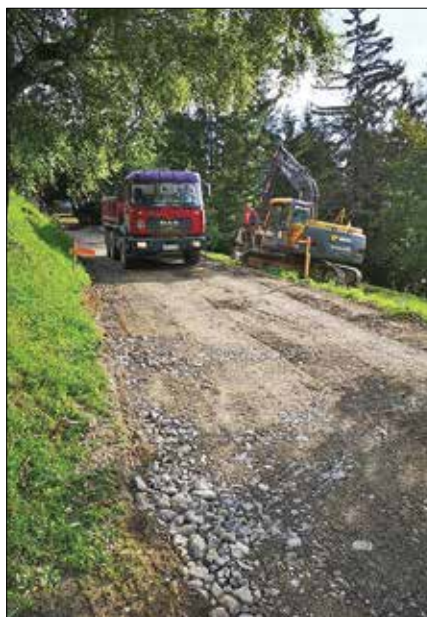
Zaradi gradbenih del je bila cesta zaprta za promet.

Ureditev ceste Križ-Florjan-Krnica je triletni