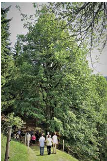
31-metrski lipa bo kmalu dobila status naravne vrednote lokalnega ali državnega pomena.

»Kot župan podpiram obeleževanje in zaščito kulturne dediščine, še posebej, če skrb izvira iz ljudi, ki tam živijo in posedujejo takšne bisere ter so pripravljene to naravno lepoto deliti z drugimi. Zahvala vsem, ki so s svojimi aktivnostmi pripomogli k obeleženju mogočne kladnske lipe. Vsako drevo je po svoje lepo in pomembno, z označitvijo najbolj mogočnih dreves pa prispevamo delček k oblikovanju našega odnosa do narave.«