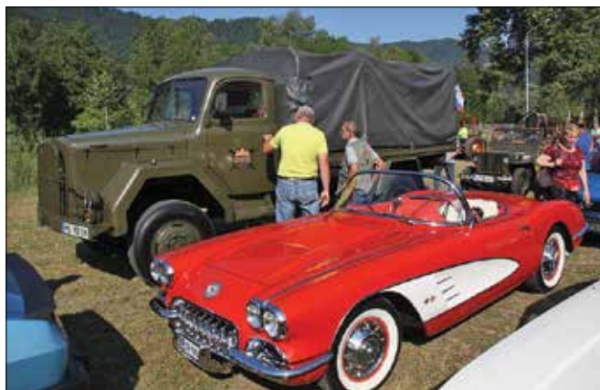
Dva najbolje ocenjena, vsak v svoji kategoriji

se udeleženci po slastnem zajtrku odpravili na panoramsko vožnjo, katere cilj je bil v osrčju Logarske doline pri gostišču Kmečka hiša Ojstrica. Med potjo so se ustavili v Lučah ob jezcu na Šmici pri vlcerski bajti, kjer jih je čakala kmečka malica. Tam so si lahko ogledali tudi zanimive etno hiške, v katerih so predstavljene rokodelske večšine, ki so nekoč zagotavljale pomemben vir dohodka lokalnim prebivalcem. Krajši postanek in osveži-