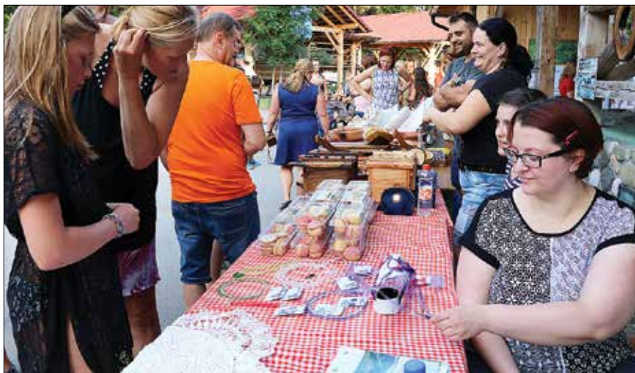
Turisti so si z zanimanjem ogledovali ročno izdelan nakit in drobno pecivo.

Nad lokalno ponudbo so bili tako tujci, ki v