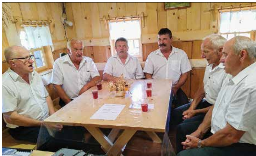
Vesela pesem pevcev iz Luč je zaključila dogodek v Vrbju.