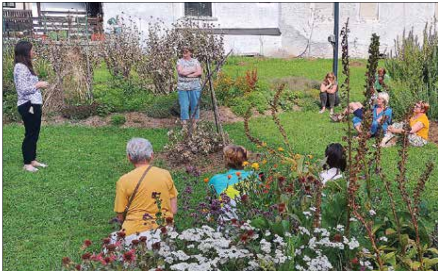
Zeliščna kopel je prijetno doživetje za udeležence.