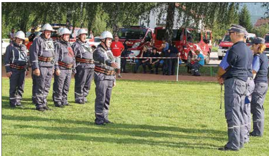
Mozirski gasilski veterani so po dolgem času zopet sestavili svojo desetino in nastopili na memorialu Viktorja Lukšeta.

Skupni rezultat obeh vaj je bil odločilen za uvrstitev na lestvici. Pri veterankah so bile najboljše članice PGD Polje, druge so bile gasilke iz Gaberk, tretje pa gasilke iz PGD Kaplja Pondor. Zelo izenačeni so bili rezultati moških veteranskih desetih. Na koncu so bili najboljši veterani PGD Kotlje, za njimi so se uvrstili veterani PGD Ponova vas, tretja pa je bila desetina PGD Oplotnica. Veterani PGD Rečica ob Savinji so za las zgrešili stopničke in zasedli četrto mesto.