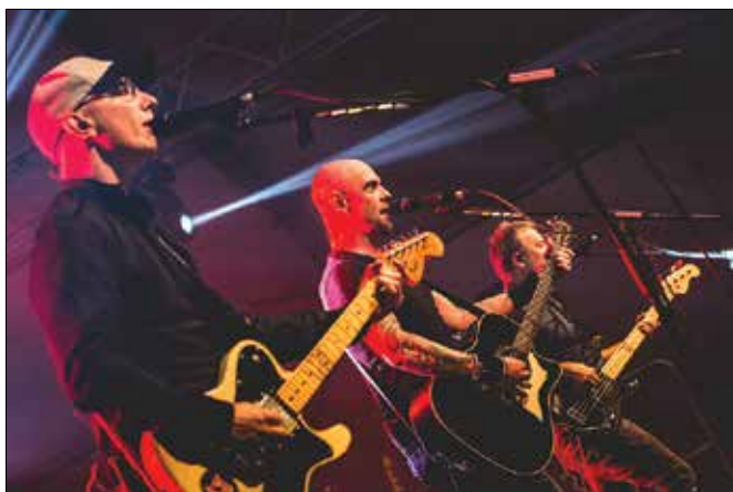
Mladi vseh starosti so v petek zvečer spremljali dveurni nastop Siddharte.

Oba večera so na svoj račun prišli ljubitelji dobre pop oziroma rock glasbe, okrog dva tisoč jih je uživalo ob odru pod šotorom. Mladi vseh starosti so v petek zvečer spremljali dveurni nastop Siddharte, v soboto pa je legendarna skupina Parni valjak s še daljšim nastopom navdušila vse prisotne, ki so dodobra poz-