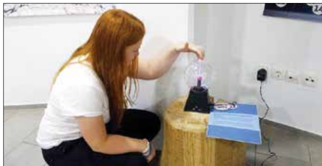
Razstava na poljuden način prikazuje, kako nastanejo najpogostejši svetlobni pojavi v gorah.

Z razstavo želita avtorja na razumljiv in poljuden način povedati ter pokazati, kako nastanejo naj-