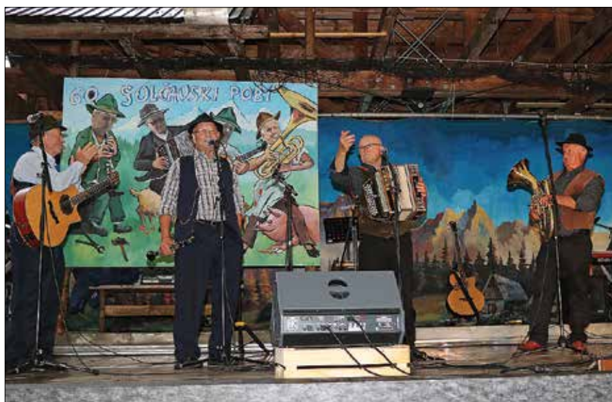
Solčavski fantje so tudi po 60 letih nepogrešljivi na prireditvah v domačem kraju in širše.