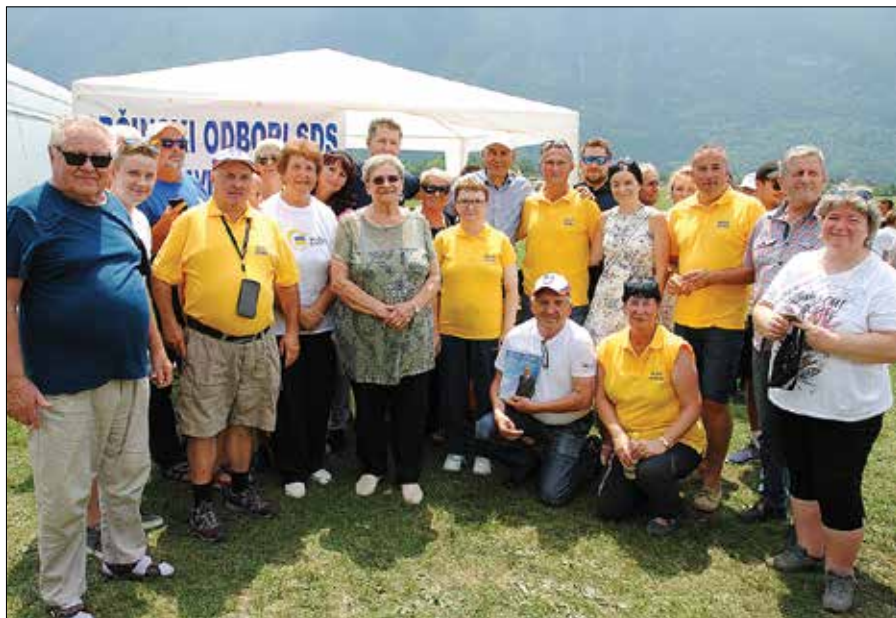
Člani in simpatizerji SDS iz Zgornje Savinjske doline s predsednikom stranke Janezom Janšo