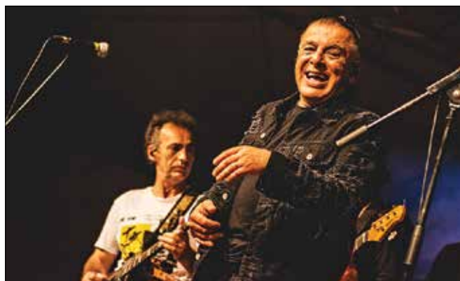
Poslušalci so pevcu skupine Parni valjak Akiju Rahimovskemu na njegovo zadovoljstvo izdatno pomagali pri prepevanju.