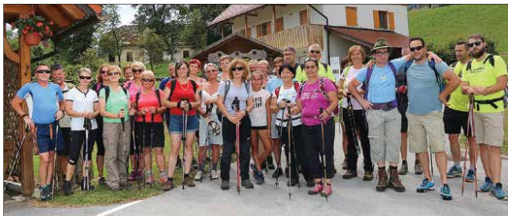
Pohodniki na startu pohoda v Radmirju