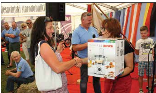
Nekateri srečneži so prejeli tudi praktične nagrade.