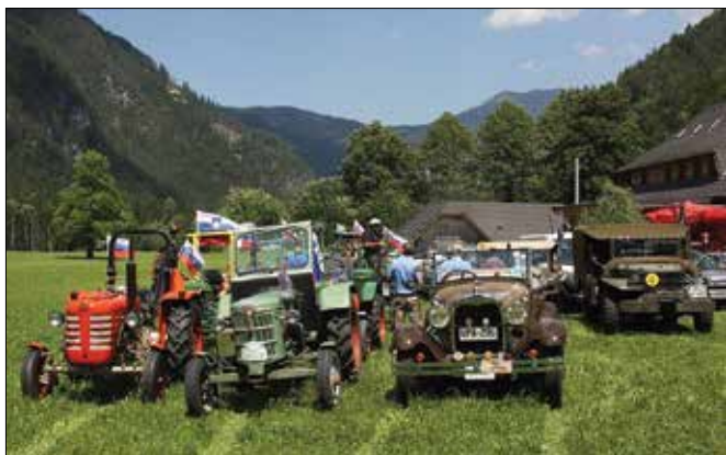
Cilj letošnje panoramske vožnje je bil v Logarski dolini.

jev, dve motorni vozili pa nista sodili v nobeno od naštetih kategorij. V vsaki kategoriji so organizatorji izbrali »naj« vozilo in lastnika nagradili z modelčkom BMW. Be-