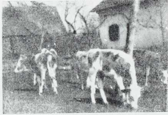
Zivonoreja — velik obet prekmurskih kmetovalcev