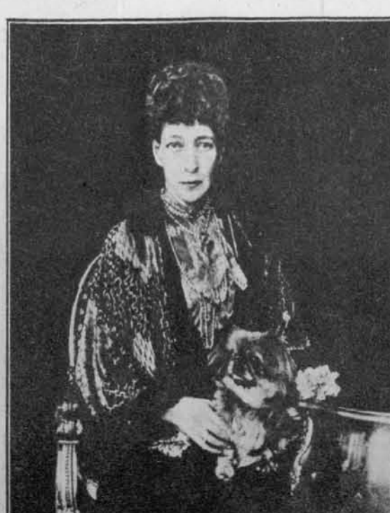
Angl. kraljica-mati Aleksandra, ki je umrla 20. novembra t. l., stara 81 let.