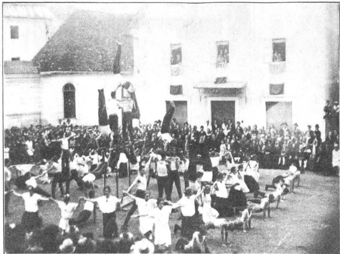
Nastop telovadnega odseka »Kat. del. društva« v Idriji

čl. predsednik in večletni odbornik »Slov. k. izobraževalnega društva Kres« v Gradu.