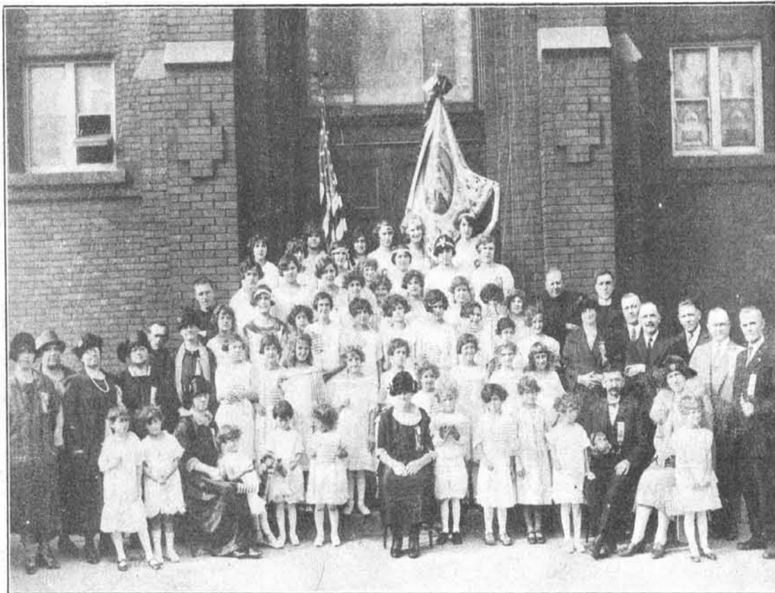
Iz življenja slovenskih izseljencev v Ameriki: