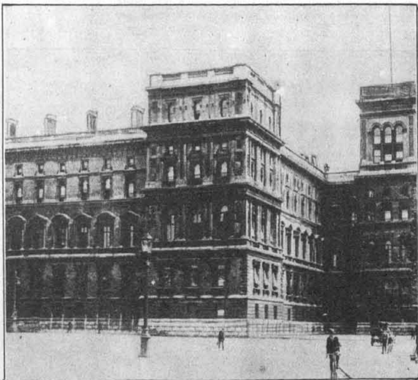
Palača angleškega zunanjega ministrstva (Foreign-Office) v Londonu, kjer je bila dne 1. decembra slovesno podpisana locarnska varnostna pogodba.

Vsem Slovincem je znan ljubljanski Narodni Dom, ki je bil pred 40 leti sezidan na inicijativo rodoljubnih in za slovensko kulturo navdušenih mož s prispevki celokupnega slovenskega naroda. Sleherni kulturni Slovenec je zato od srca pozdravil vest, da se preuredi Narodni dom v bivališče za Slovensko Akademijo znanosti in umetnosti in za Narodno galerijo upodablajočih umetnosti, ki sta poleg naše univerze najvišji slovenski kulturni instituciji. Z vso vnemo se že delajo načrti za prenovljenje Narodnega doma in se bo začelo z adaptacijskimi deli takoj prihodnje spomlad, o čemer bomo trajno informirali naše bralce v Ilustrovanem Slovincu.