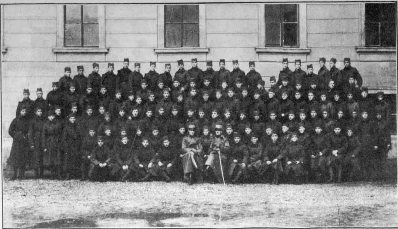
Letoŕnja dijaška četa 40. »Triglavskega« pehotnega polka v Ljubljani (vpoklicani 31. X. t. l.).