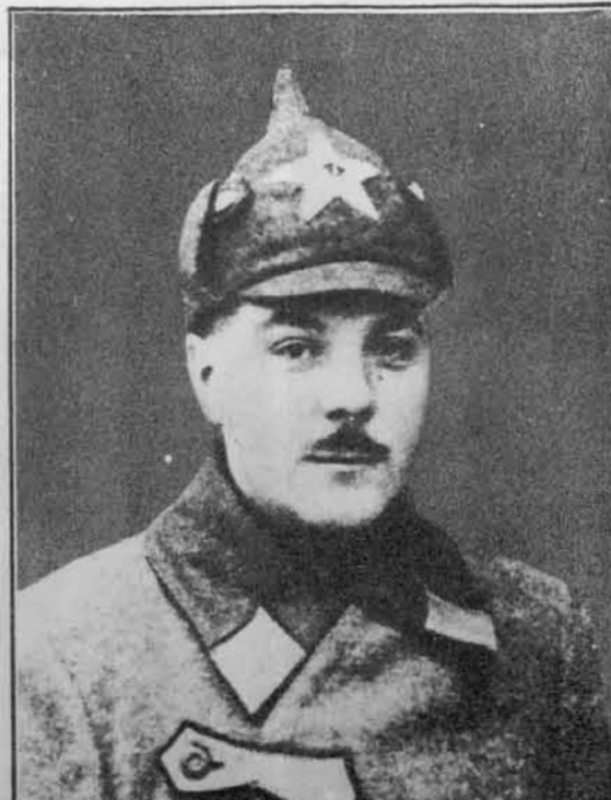
Vorošilov, novi sovjetski ljudski komisar za vojne zadeve, naslednik Frunzejev.