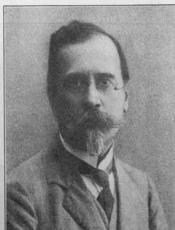
Vladni svetnik dr. Fran Detela, znani slovenski pisatelj, ki je obhajal dne 3. t. m. petinsedemdesetletnico svojega rojstva.