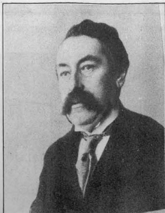
Aristide Briand, novi francoski ministrski predsednik, ki je sestavil svoj kabinet iz levčarskih meščanskih strank.