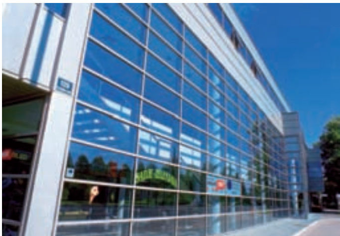
Slika 6: Globalizacija tehnologije: zgradbe po svetu so si vedno bolj podobne. Technology globalisation: Buildings all over the world are becoming more similar to each other.

Večanje izbora elementov. "Sodobni ljudje se izražajo skozi stvari, ki jih izberejo". [Koolhaas, 2001] Tudi z nakupovanjem postajajo vedno večji individualisti. Potrošništvo zato implicira vedno bogatejšo ponudbo, diferencirano za vse okuse in za vse ekonomske razrede. To se odraža v silno pestri ponudbi gradbenih prefabrikatov, ki podpirajo željo po hitri zamenjavi (talne in stenske obloge, sanitarni predmeti, zasteklitveni sistemi, kritine, ...).