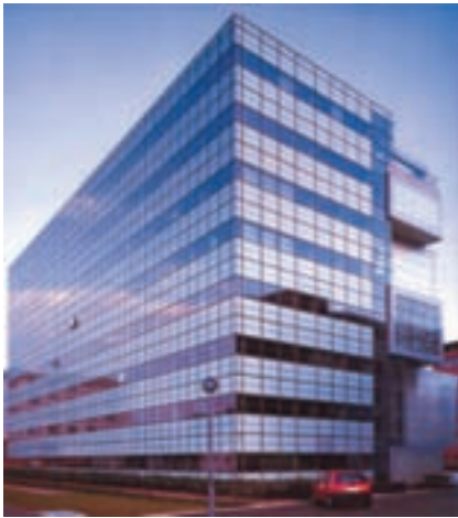
Slika 3: Nizki vzdrževalni stroški: nekorozivni, samočistilni fasadni ovoj. Low maintenance costs: non-corrosive, self-cleaning facade.