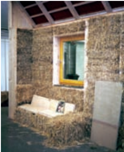
Slika 4: Nizkoenergijske tehnologije - vračanje k naravnim gradivom (les, glina, slama...) Low energy technologies: return to natural materials (timber, clay, straw...).

Nizkoenergijske tehnologije. Doslej naštetih ekonomski pokazatelji (manjšanje mase, krajšanje časa, nižanje vzdrževalnih stroškov) narekujejo razvoj in uporabo modernih gradiv in tehnologij, ki praviloma porabijo vedno več energije kot njihovi predhodniki in so zato ekološko problematični. Nasprotje temu so nizkoenergijske tehnologije, ki se vračajo k naravnim gradivom in tradicionalnim tehnologijam (uporaba lesa, gline, ...) in so tudi ekonomsko konkurenčne.