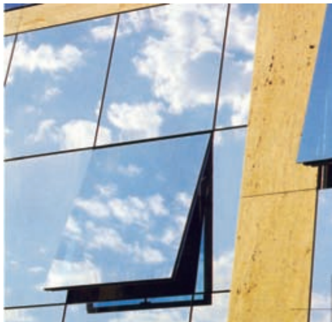
Slika 2: Zgodovino arhitekturne tehnologije spremlja manjšanje mase in večanje porabe energije na enoto. Development of architectural technology limit towards small mass and high energy consumption per construction unit.

Manjšanje mase gradiv arhitekturnih členov najbolj nazorno predstavimo s pregledom uporabe kamna. Že paleolitski razvoj uporabe kamna za orodje in orožje kaže na kontinuirano manjšanje mase posameznega orodja. V začetku okorni in masivni pestnjaki se razvijajo v vedno bolj fina kamnita orodja - mikrolite. V starem paleolitu so iz enega kilograma kremenca izdelali en nož z dolžino rezila 10 cm, v mladem paleolitu so iz enake količine izdelali že okoli 50 nožev s skupno dolžino rezila od 6 do 20 m [Leroi-Gourhan, 1990]. Tehnološki razvoj iz paleolita se ponovi tudi v naslednjem obdobju v razvoju arhitekturne tehnologije. Velikanskim megalitskim kladam so