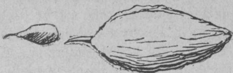
Podoba 1. Podoba 2.

Ako si primoran, peške sejati spomladi, naj pa nekaj tednov prej kalé. Vzemi lonec ali majhen zaboj ter shrani v njem sadno seme, namešano z vlažnim peskom. Posodo postavi na primerno toplo mesto, najbolje v toplo klet. Kedar so kali 2 do 3 mm. dolge (glej podobe 1. in 2.), čas je, da spraviš seme v zemljo. Glej, da opraviš vsa ta opravila ob pravem času!