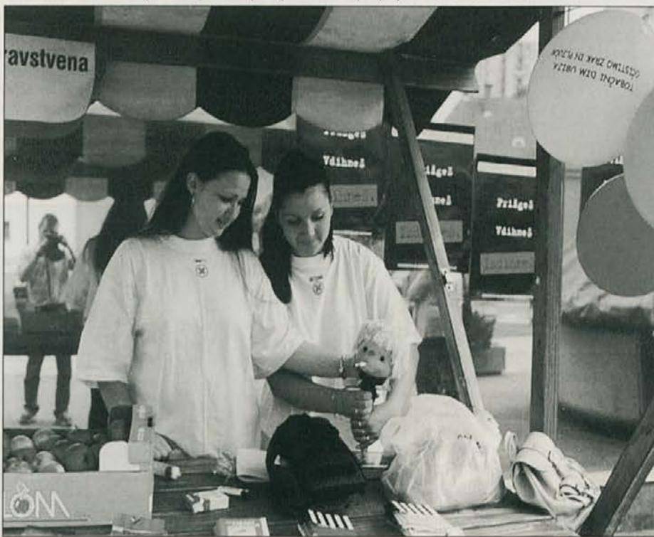
Utrinek z informacijske stojnice v podporo nekajenju pred Namom na Ravnah...