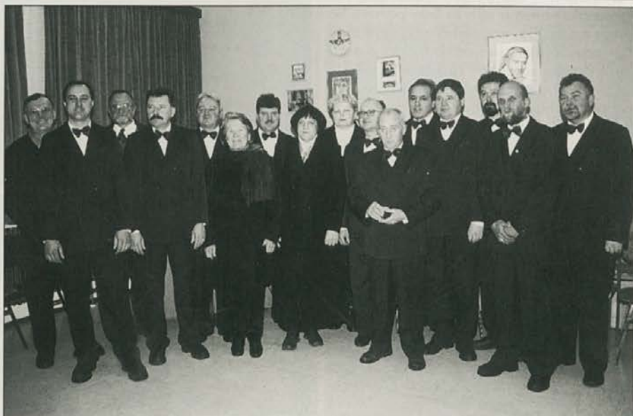
Moški pevski zbor KD Šmartno na "Krpačevih dnevih".