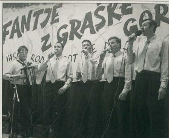
Skupina graškogorskih fantov ob promociji zgoščenske