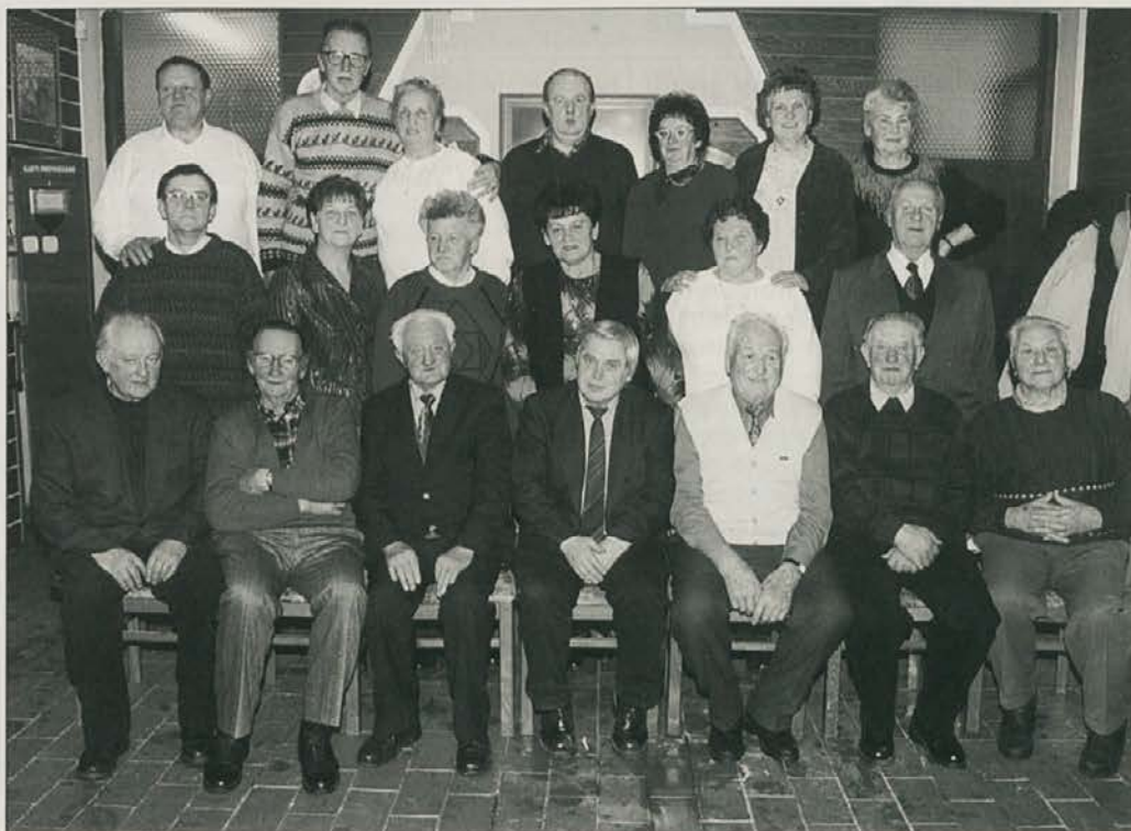
Upokojenci zadruge "Ledina" Slovenj Gradec