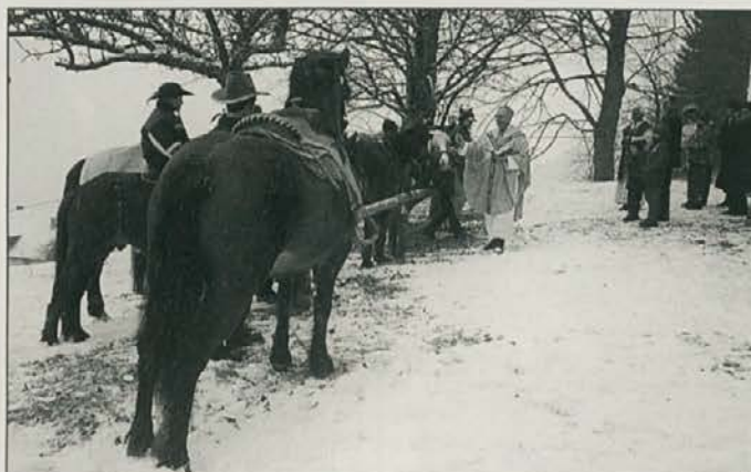
Blagoslov konjem in jezdecem v Javorju. ▲▼

Med božične praznike sodi tudi obhajanje godu Svetega Štefana, v Sloveniji na ta dan praznujemo Dan samostojnosti. Drugače je Štefan