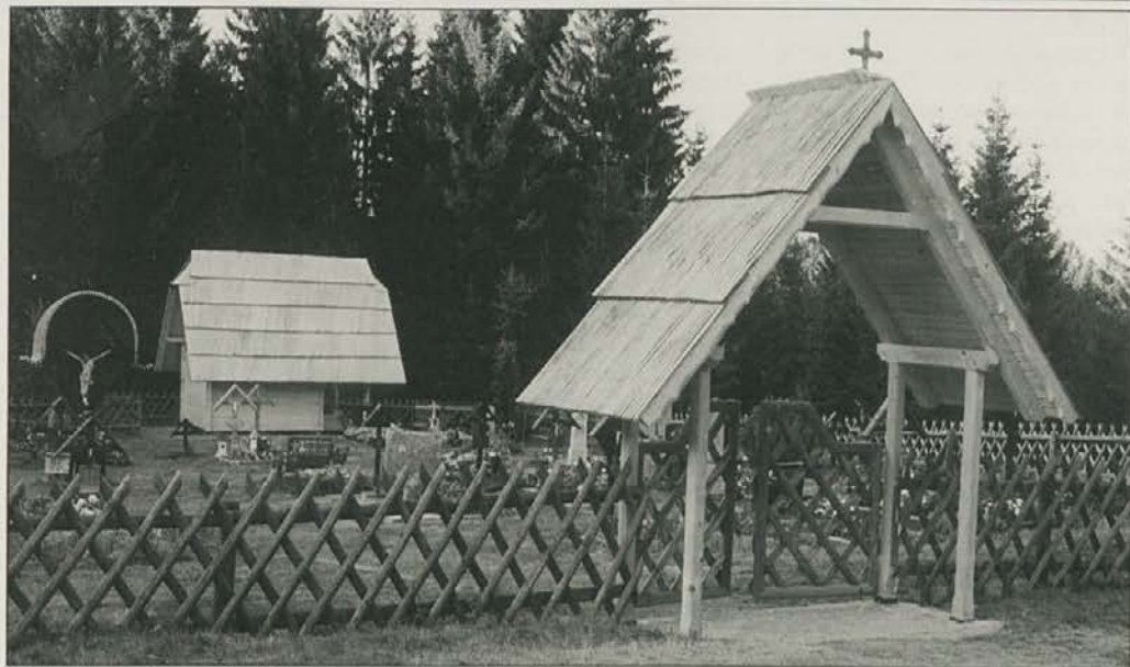
Če vas pozdravijo šintli, ste v Kozjaško - Koroški pokrajini.