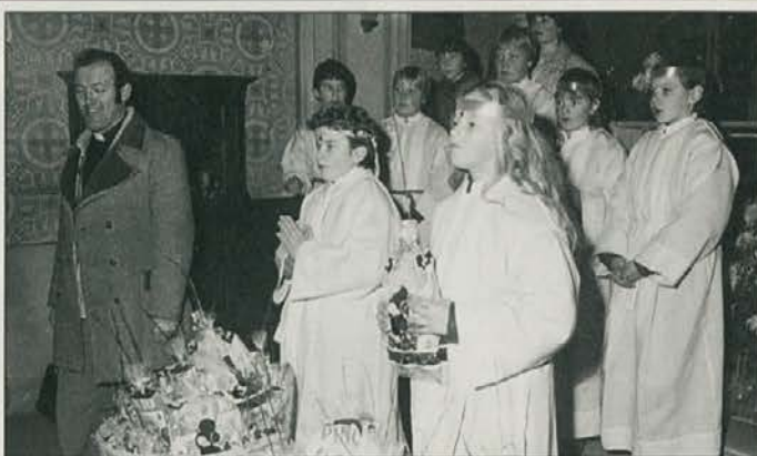
Kralji so prinesli darove v cerkev.

Praznik sv. Treh kraljev, ki se v cerkvenem koledarju uradno imenuje Epifanija, slovensko pa razglašanje gospodovo, je bil v starogrški cerkvi osrednji praznik božičnega časa. S tem praznikom, 6. januarja sedaj cerkev zaključuje božično obdobje.